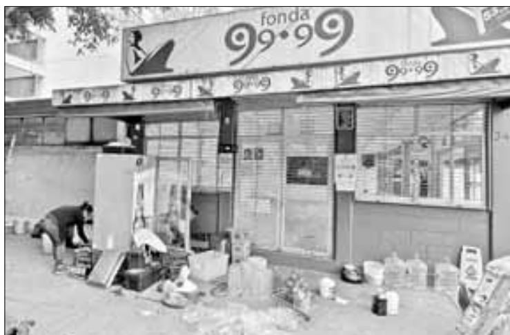
▲ La fonda era un lugar muy conocido por los comensales que gustan de la gastronomía peninsular.