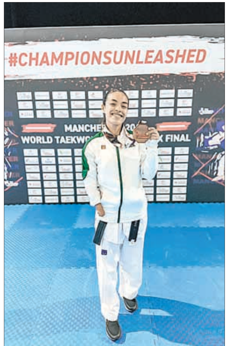
▲ La mexicana derrotó a Ziyodakhon Isakova, de Uzbekistán, para conseguir su medalla en los 47 kilogramos.

Souza y Plaza entrarán en acción este sábado; Soltero y Sansores lo harán mañana.