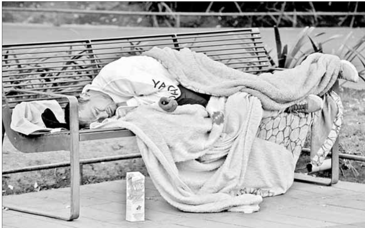
▲ Un hombre en situación de calle y que dice padecer cáncer de médula descansa en el parque La Bombilla.