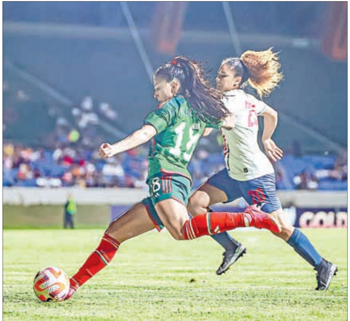
▲ Las mexicanas triunfaron de visita en el estadio Juan Ramón Loubriel, en Bayamón.

Después ganar los Juegos Centroamericanos, así como los Panamericanos, ahora el reto aumenta para las mexicanas en la Copa Oro W, donde han confirmado su lugar Estados Unidos, Brasil, Canadá, Colombia, Argentina y Paraguay.