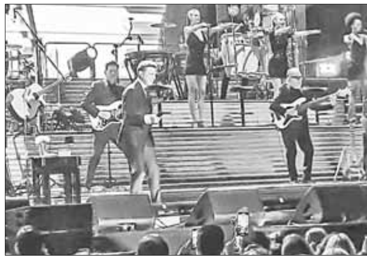
▲ El cantante interpretó los éxitos logrados en 41 años de carrera artística.

En 2024, el artista continuará su gira el 20 de enero en República Dominicana y también ofrecerá en Europa un par de conciertos en España donde ya agotó las entradas del 6 y 7 de julio en el estadio Santiago Bernabéu, que tiene una capacidad para más de 80 mil personas.