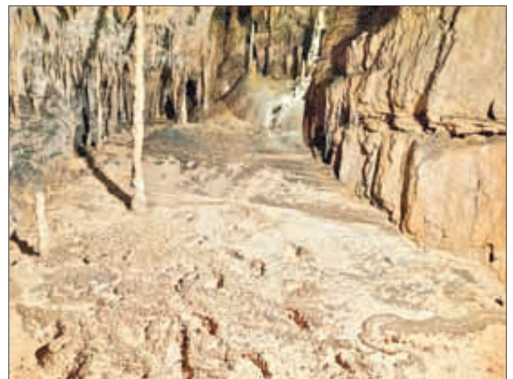
▲ Huellas de pisadas humanas del hombre Paleolítico descubiertas en una galería de la cueva cántabra de La Grama.

Por tanto, parece que los humanos del Paleolítico seleccionaron el pedernal de grano medio para herramientas grandes, a pesar de que era un material difícil de modificar para convertirlo, ya que era más probable que durara más. Esto ofrece una visión fascinante del comportamiento de nuestros antepasados, ya que seleccionaron el pedernal basándose en muchos factores además de lo fácil que era fracturarlo y pudieron discernir la roca más adecuada para fabricar herramientas de piedra, según los autores.