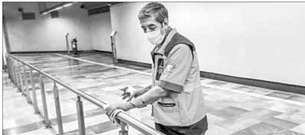
▲ El presidente Andrés Manuel López Obrador informó que el minisalarario pasará de 207.44 pesos a 248.93 pesos a partir del primero de

Twitter: @cafevega cfvmexico_sa@hotmail.com