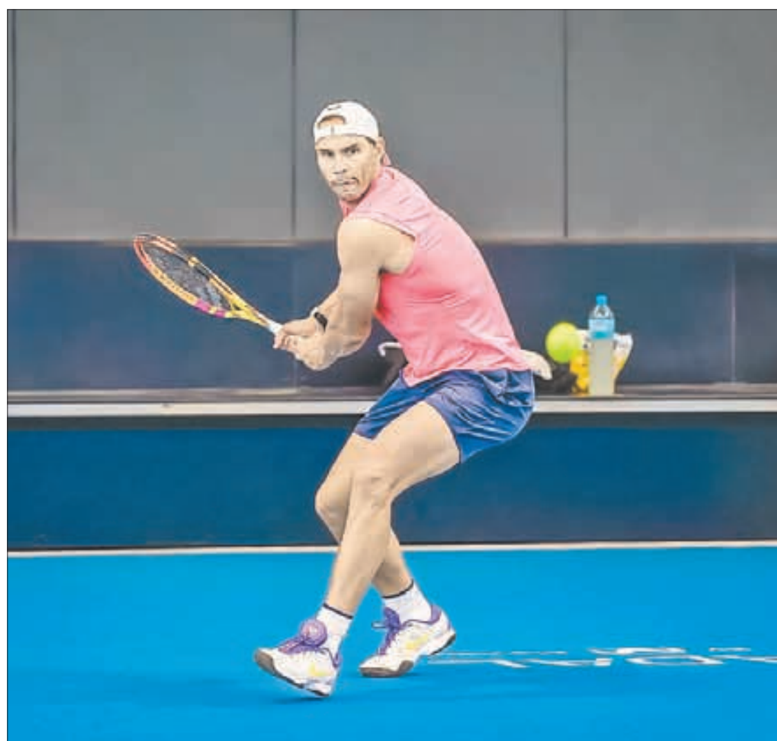
▲ El tenista mallorquín estuvo alejado un año de las canchas debido a una lesión de cadera.