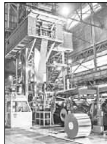
▲ El empresario debió haber liquidado a Pemex más de 112 millones de dólares el jueves pasado por haberle vendido a sobreprecio la planta de Agronitrogenados.

En el convenio entre Alonso Ancira y Pemex se estipuló que él y AHMSA "se obligan a pagar en favor de la solidaridad activa que integran los ofendidos Pemex y Pemex Transformación Industrial, el cumplimiento total de esa obligación de pago".