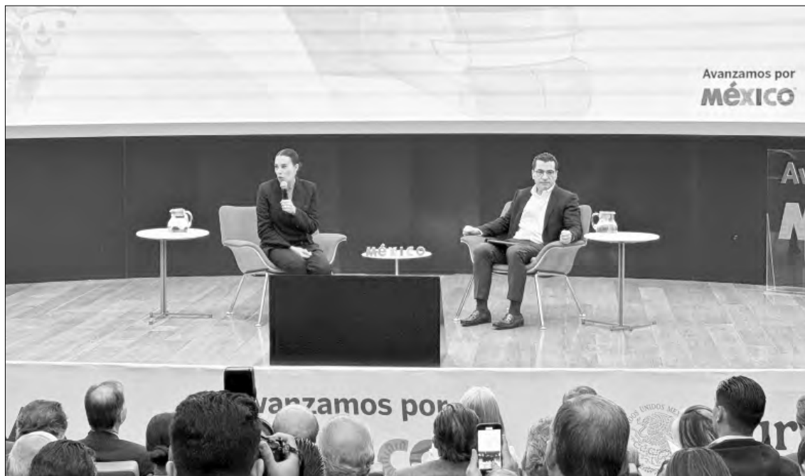
◀ BBVA y la Sectur presentaron una campaña para apoyar al sector, llamada Avanzamos por México.

Uno de los sectores que resultan elementales para activar la economía mexicana, destacó el banquero, es el turismo, pues tiene la capacidad de resistir a los choques internos o externos, y es por ello que se le debe prestar particular atención.