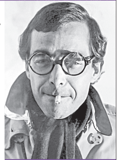
La génesis de Farabeuf / Apocalipsis 1900

22:00 TIEMPO DE FILMOTECA UNAM: KUROSAWA Trono de sangre (Japón, 1957) De Akira Kurosawa