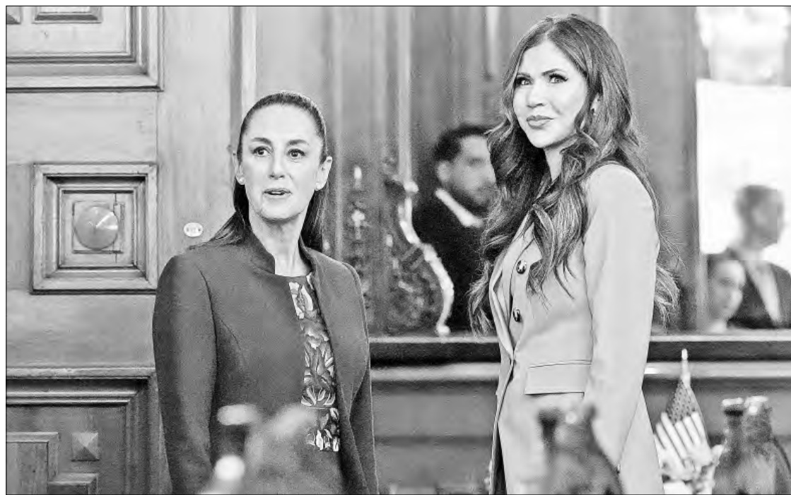
► Welcome, saludó la presidenta Claudia Sheinbaum a la secretaria de Seguridad Nacional de EU.

De la Fuente y Noem ratificaron la vigencia de un memorando de entendimiento firmado en 2022 entre la Agencia Nacional de Aduanas de México y la Agencia de Aduanas y Protección de la Frontera de Estados Unidos. Poco antes de las 16 horas, Noem regresó al AIFA para su retorno a Washington, con lo que cerró su gira por El Salvador, Colombia y México.