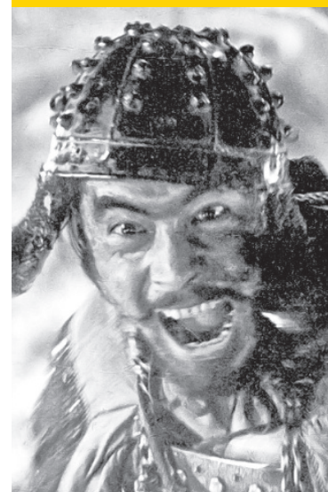
Los siete samuráis

IZZI - TOTAL PLAY • CANAL 20 | TELEVISIÓN ABIERTA • CANAL 20.1 | DISH • SKY • MEGACABLE • CANAL 120