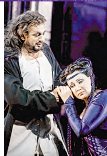
Sansón y Dalila

KUROSAWA Los siete samuráis (Japón, 1954) De Akira Kurosawa