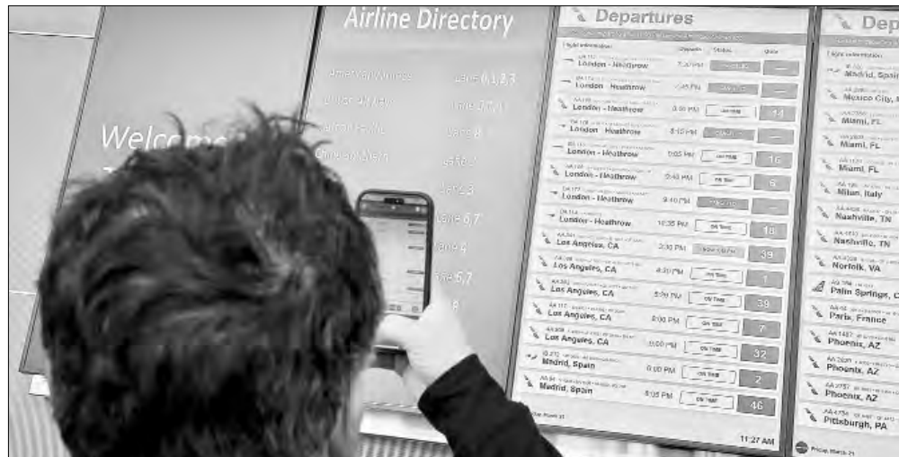
▲ Cierre del aeropuerto en Londres provocó cientos de cancelaciones en vuelos.