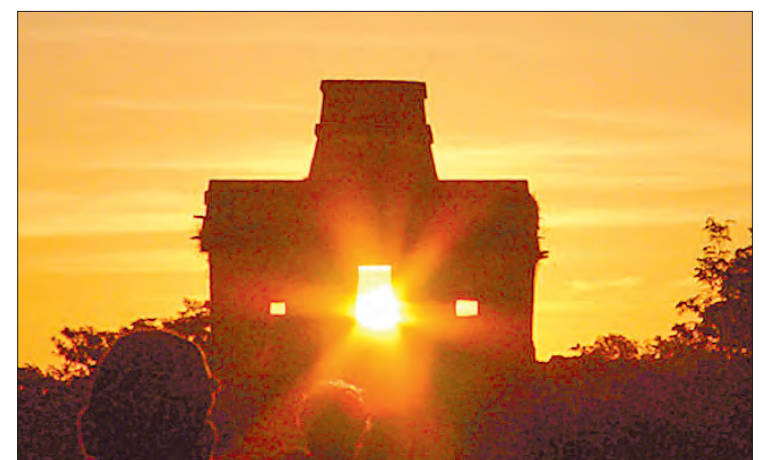
◀ ▶ En el orden de costumbre, zona arqueológica de La Organera, adonde arribaron más de mil 300 asistentes para participar en el ritual de renovación energética; luego, Teotihuacan, sitio visitado ayer por 10 mil personas, y el Templo de las Siete Muñecas, en Yucatán, durante la llegada del equinoccio.