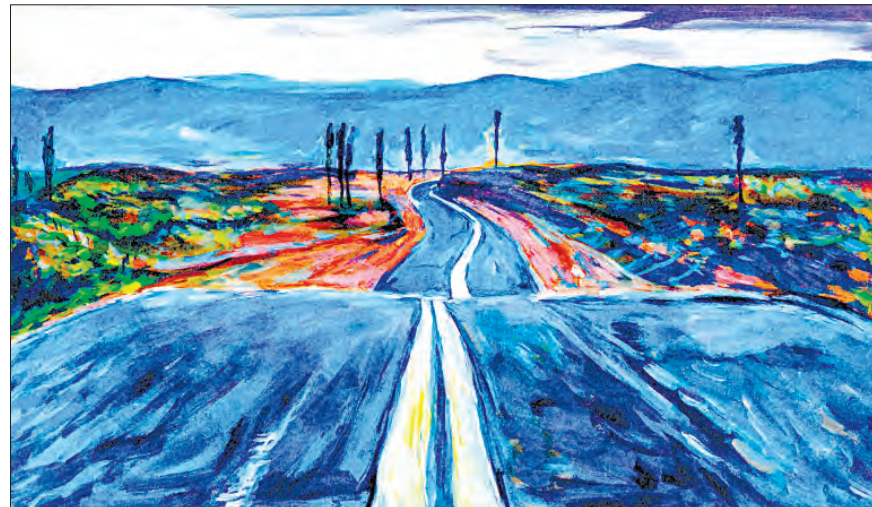
They're painting the passports brown The beauty parlor is filled with sailors The circus is in town

They're selling postcards of the hanging