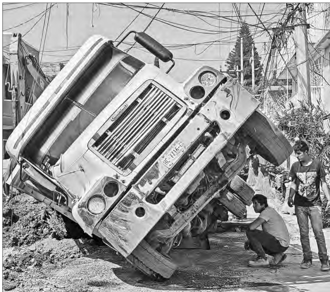
▲ El peso de un camión materialista que circulaba por la calle 325 esquina con la avenida 318, en una zona en la que se reparaba el drenaje, hizo que se