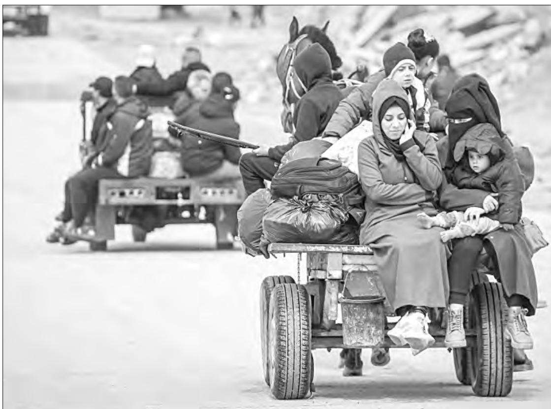
▲ Palestinos se trasladan del sur al norte de Gaza por una carretera costera, lejos de las zonas de la renovada ofensiva israelí en Gaza.

En la ciudad de Rafah, funcionarios municipales palestinos seña-