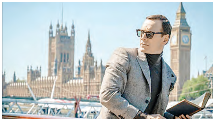
▲ Fotograma de la película Código negro del director estadounidense Steven Soderbergh

Hay una pistola disparando y un auto destruido por una explosión y esa es toda la acción de la película, pues el asunto se resuelve con ingeniosos diálogos en los cuales pesa mucho la fidelidad de pareja, el sentido del deber y la diferencia entre la verdad y la men-