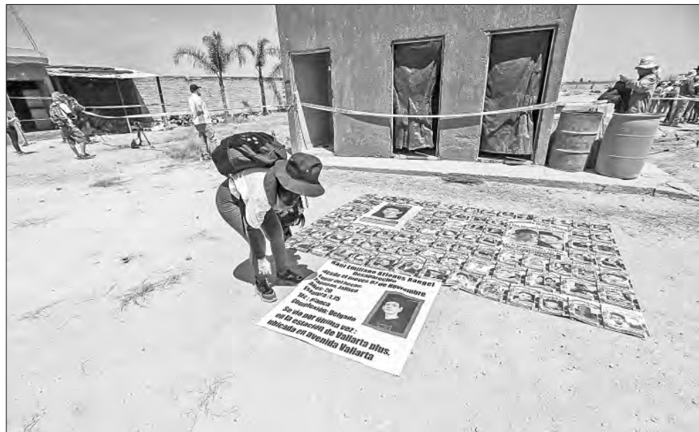
▲ Familiares de desaparecidos que ingresaron ayer al rancho Izaguirre, en Teuchitlán, Jalisco, afirmaron luego de su

Y, MIENTRAS LA Sección Instructora de la Cámara de Diputados (con suficiente mayoría morenista) dictaminó que no se avance en el desafuero del ex gobernador de Morelos Cuauhtémoc Blanco, lo cual será sometido a votación en el pleno de San Lázaro, donde Morena y aliados también son mayoría suficiente, ¡hasta el próximo lunes!