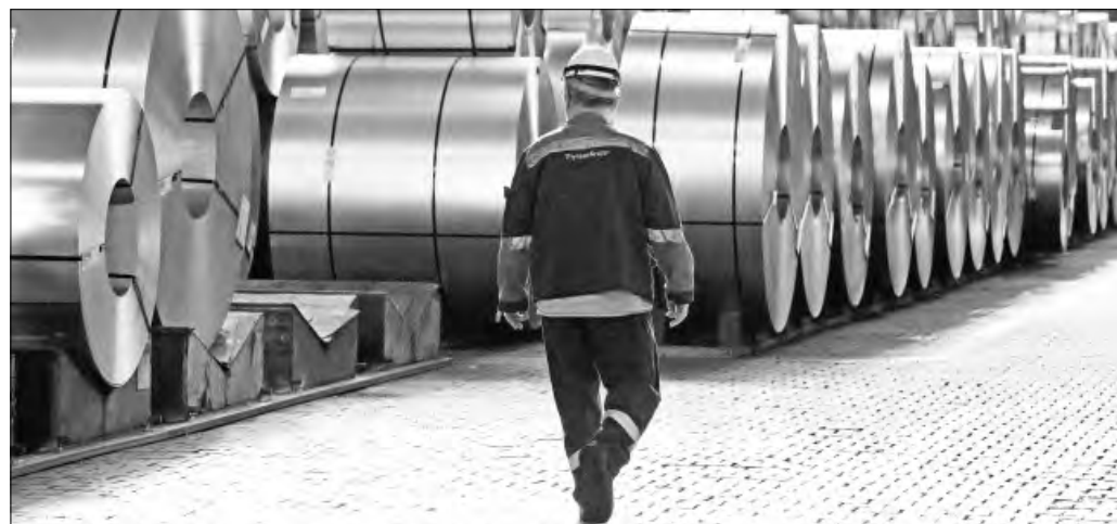
▲ La decisión del presidente de Estados Unidos, Donald Trump, de imponer aranceles por todo y para todos es debilitar la de por sí

Twitter: @cafevega cfvmexico_sa@hotmail.com