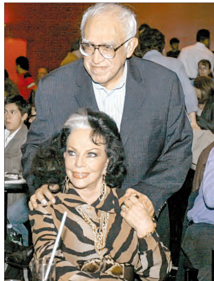
▲ El escritor Carlos Monsiváis durante el homenaje por sus 70 años junto a Tongolele , en 2008.

En años recientes, participó en el teatro musical Perfume de gardenia y, en mayo de 2012, celebró sus 65 años de trayectoria con la obra Tongolele . El espíritu de una época en este mismo recinto teatral del Centro Histórico.