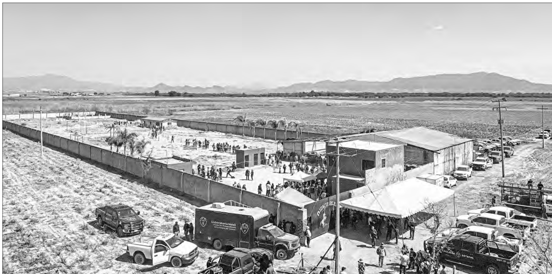
▲▼▶ Vista panorámica del rancho Izaguirre, ubicado a 60 kilómetros de Guadalajara y que fue parte de un ejido hasta 2020. A la derecha y abajo de estas líneas, aspectos de la visita de los colectivos de madres buscadoras, quienes consideran que en ese predio se materializó la desaparición y homicidio de hombres y mujeres de los que no se sabe nada desde hace meses o incluso años. En el rancho hay siete puntos de investigación que sólo están delimitados con cintas amarillas (imágenes en la parte inferior), que deberán ser pericialmente desahogados. La Fiscalía de Jalisco seguía ayer a cargo del caso y fue responsable de la logística para la visita de colectivos y medios de comunicación al lugar.