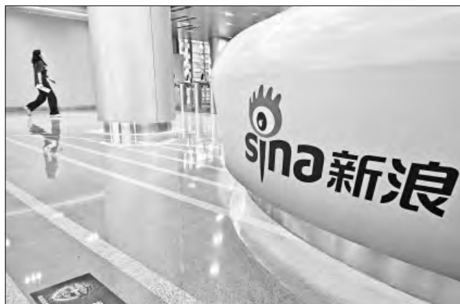
▲ La empresa Sina, propietaria de la red social Weibo, cuenta en su interior con gimnasio, sala de lectura, tintorería y una tienda de conveniencia, entre otras amenidades para sus trabajadores. Sandra Hernández

APENAS EL MES pasado, la Administración del Ciberespacio de China informó que unos 10 mil sitios de Internet ilegales fueron cerrados en 2014 por promover la violencia y difundir información falsa. Incluso se aplicaron advertencias y sanciones económicas a poco más de 4 mil de ellos por infracciones graves.