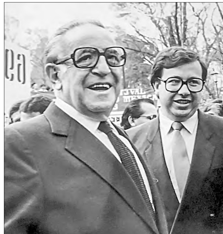
▲ Jesús Reyes Heróles y Heriberto Galindo Quiñones, durante la ceremonia de entrega de los Premios Nacionales de la Juventud en la residencia oficial de Los Pinos, en marzo de 1985.

En este tiempo urge la presencia creciente de ideólogos y de políticos cultos, honestos, patriotas y comprometidos: mujeres y hombres de bien y de grandeza, para integrar y oponer un valladar frente a los radicalismos obtusos, retrógradas y nefastos que, desde la intolerancia y la cerrazón del poder autoritario, pretendan sofocar la democracia participativa y el debate civilizado de las ideas, aquello que don Jesús Reyes Heróles promovió, alentó y defendió con tanto vigor y denuedo.