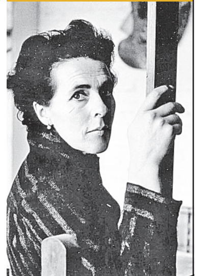
Confidencial: Leonora Carrington

IZZI · TOTAL PLAY · CANAL 20 | TELEVISIÓN ABIERTA · CANAL 20.1 | DISH · SKY · MEGACABLE · CANAL 120