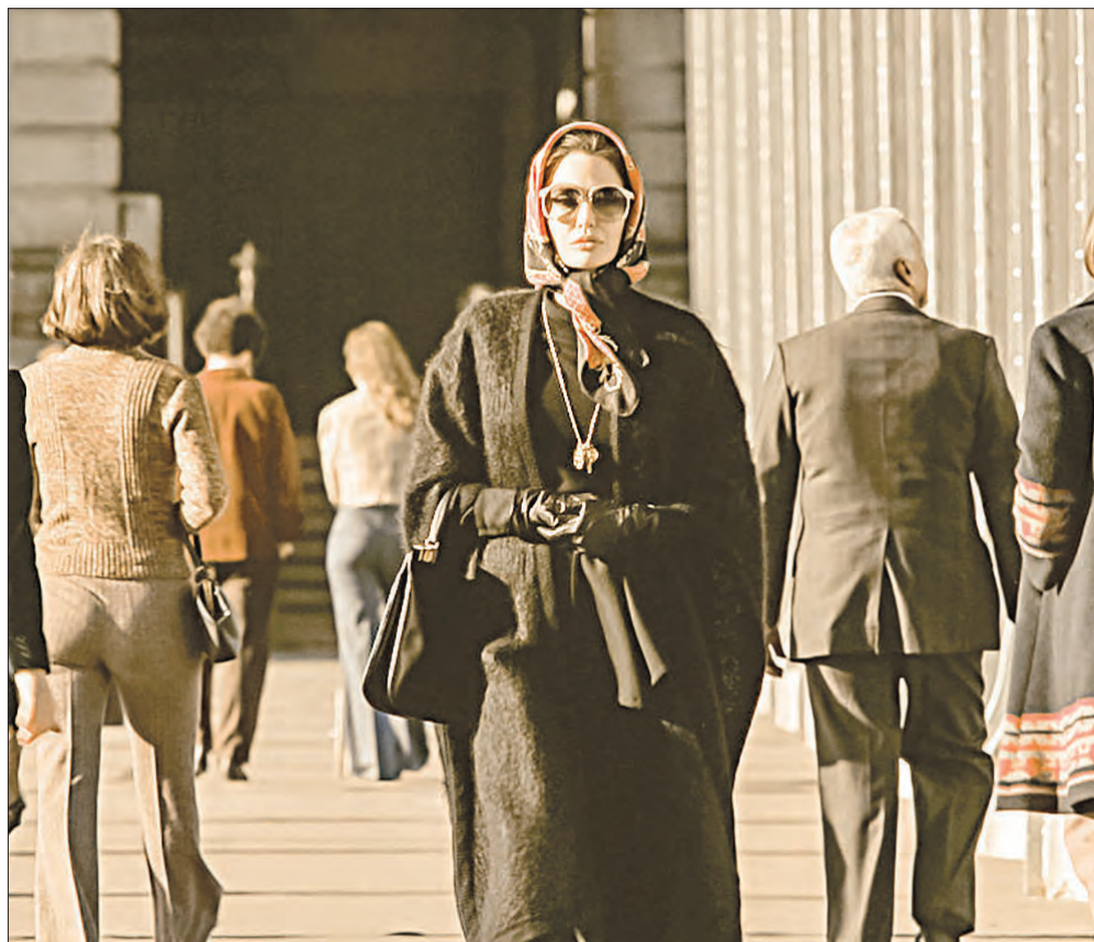
▲ Fotograma de la película de Pablo Larraín, protagonizada por la actriz estadounidense