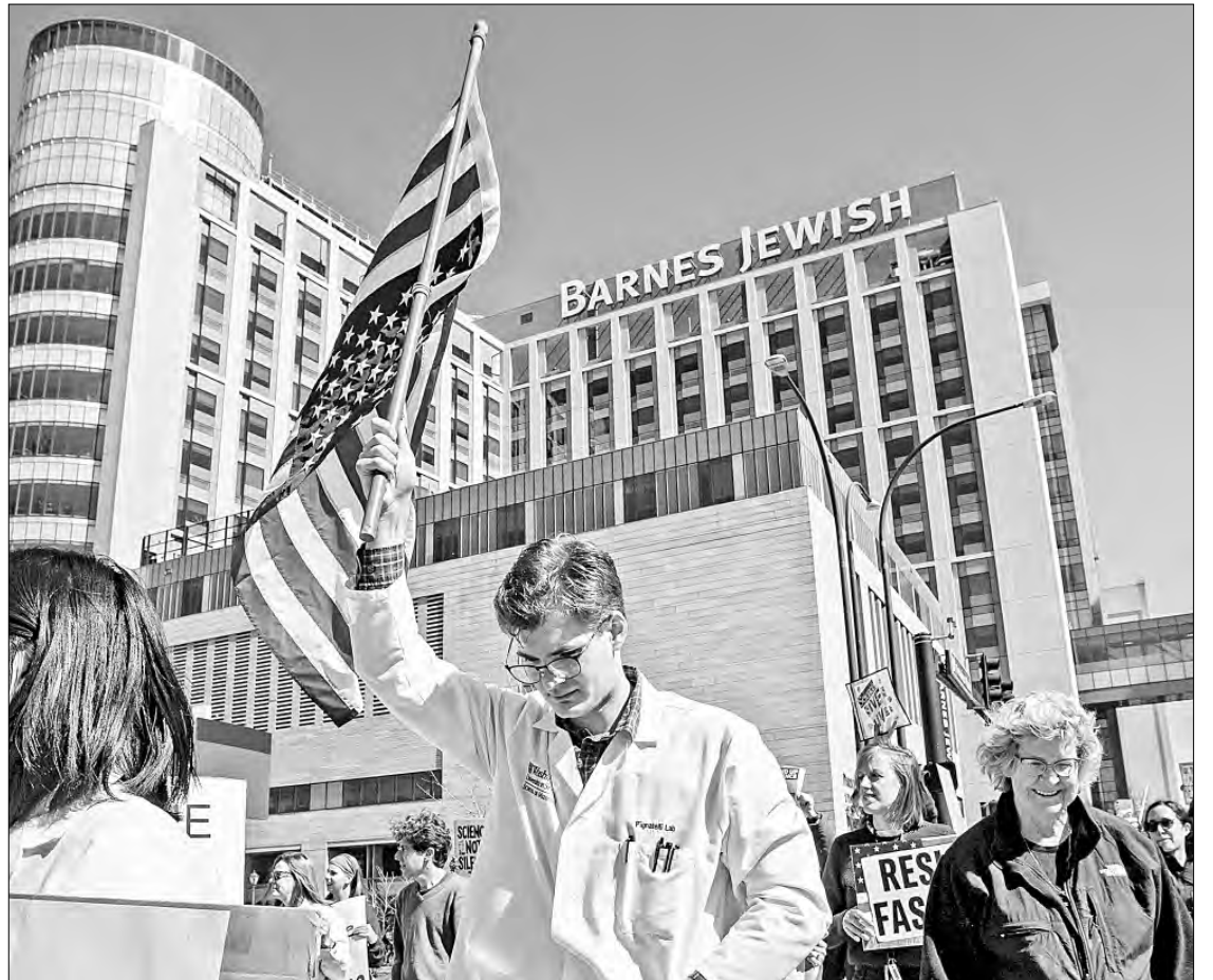
▲ Estudiantes de ciencias protestaron ayer en San Luis, Missouri, contra los recortes presupuestarios y el despido de científicos. En la imagen, un activista con la bandera estadounidense al revés.

“No has despedido a nadie”, le reclamó Musk a Rubio, frente a lo cual el secretario de Estado refutó: ¿Qué pasa con los más de mil 500 funcionarios del departamento de Estado que se jubilaron anticipadamente? ¿No cuentan como despedidos? Preguntó Rubio y añadió —con sarcasmo— si Musk quería que vol-