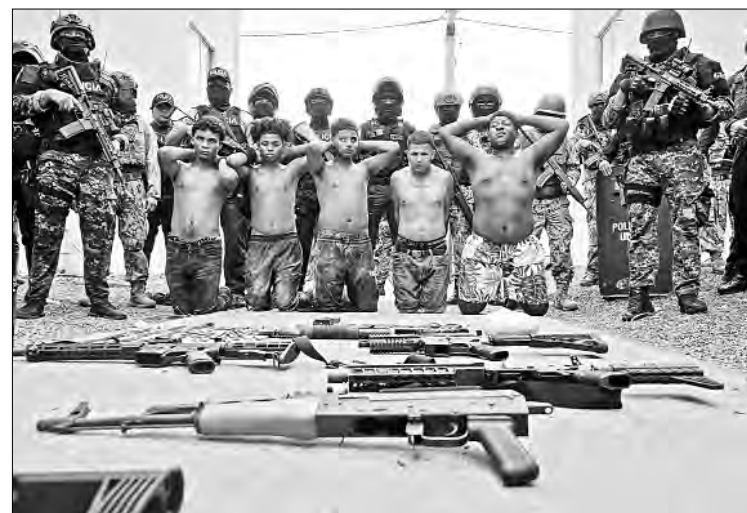
▲ Autoridades policiales presentan a la opinión pública al grupo de personas arrestadas en relación con la matanza de Socio Vivienda 2.

No obstante, Telemazonas reportó, sin mostrar pruebas, que los asesinados serían al menos una veintena de presos.