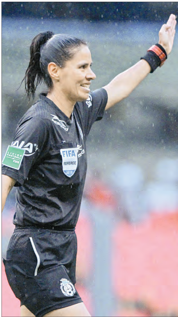
▲ La ex silbante indicó que las árbitras han ido ganando espacios al demostrar que son igual de eficaces que los hombres.

POCO A POCO SE HAN IDO LOS RECLAMOS DE GÉNERO, AFIRMA