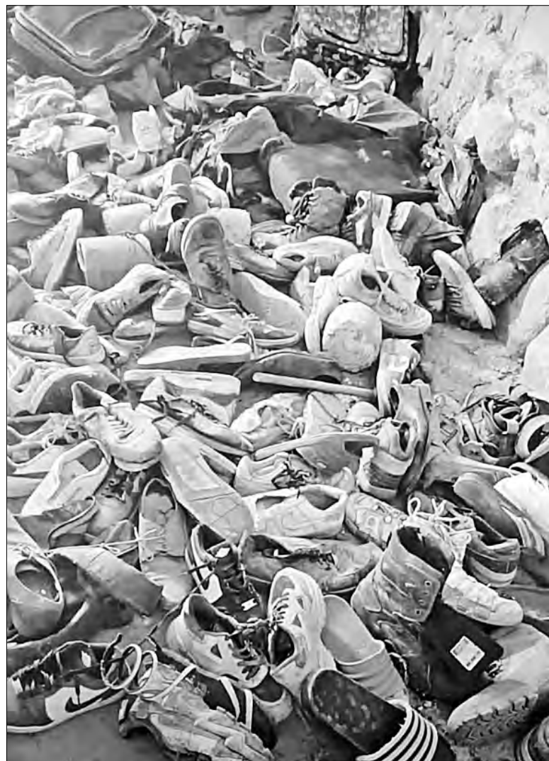
▲ Cientos de piezas de calzado y algunas mochilas localizadas el miércoles por integrantes del colectivo Guerreros Buscadores en el rancho Izaguirre, de Teuchitlán.

El rancho Izaguirre, cercano a la localidad La Estanzuela, se ubica cerca de un predio de similares características también en Teuchitlán, otro narcocampamento en el cual a principios de febrero anterior 38 personas fueron detenidas 36 de las cuales fueron dejadas en libertad al comprobarse que estaban ahí contra su voluntad.