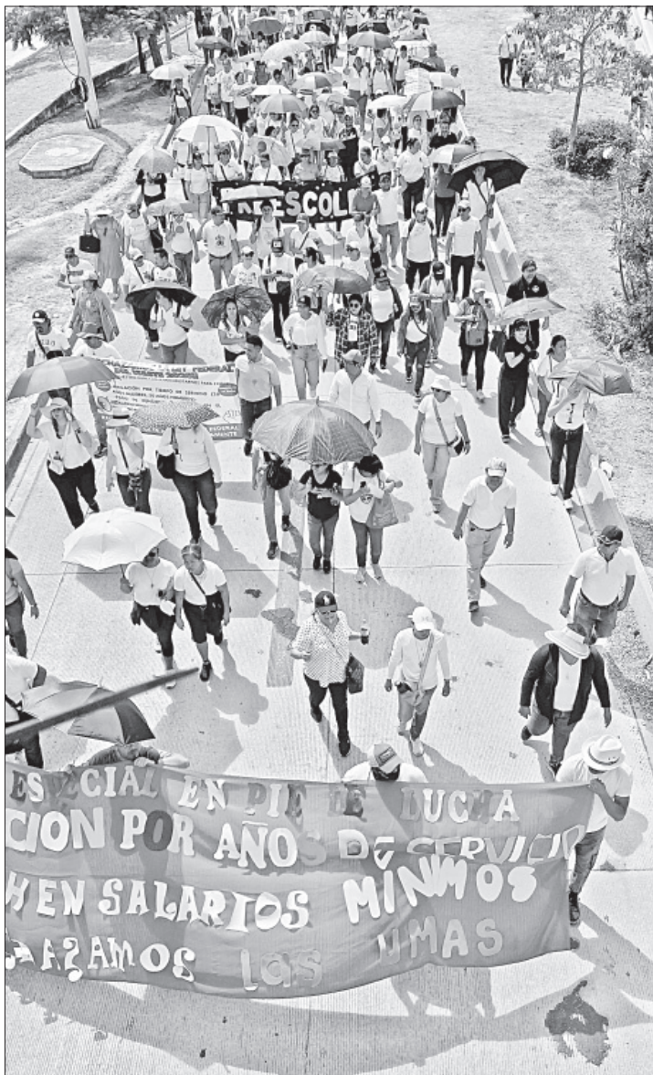
▲ Cientos de trabajadores de la educación marcharon ayer cuatro horas por las principales calles de Cancún, Quintana Roo, para exigir a las autoridades modificar la propuesta de reforma a la Ley del Issste.