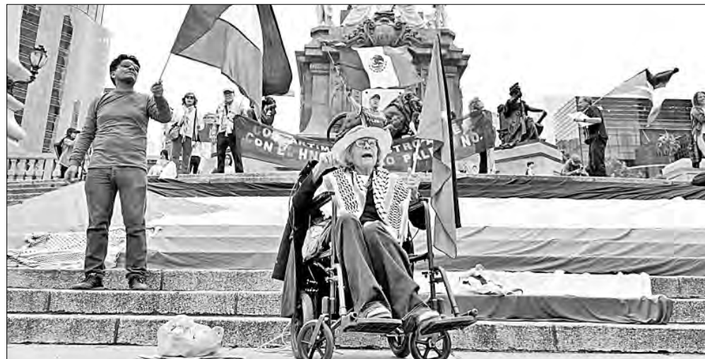
▲ Simpatizantes del pueblo palestino se manifestaron ayer en el Ángel de la Independencia porque se mantiene el acuerdo del alto el fuego en Gaza.