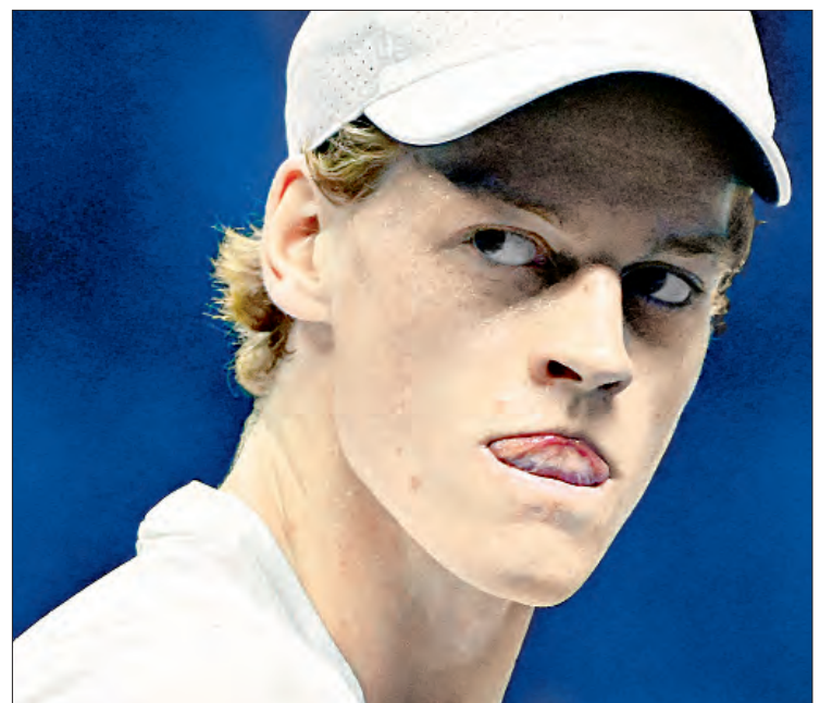
▲ Sinner, de 23 años, afirmó que los errores de su equipo lo llevaron a dar positivo dos veces por rastros de clostebol.

Mala señal, si sólo el italiano puede lograr una sanción así tras violar las reglas, opina Medvedev