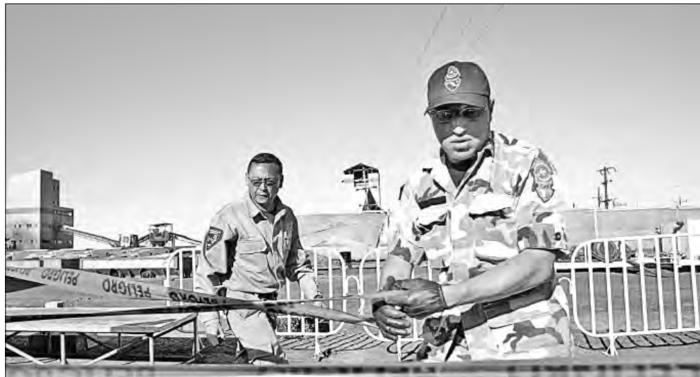
▲ El 25 de febrero de 2006 elementos de la extinta Policía Federal Preventiva cercaron los accesos a Pasta de Conchos antes de la

Twitter: @cafevega • cfjmexico_sa@hotmail.com