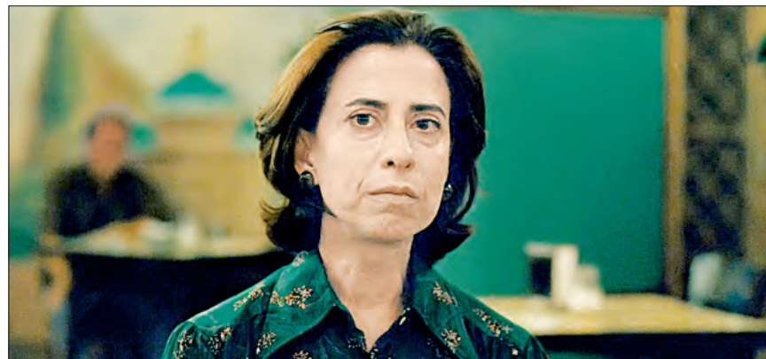
▲ Fernanda Torres en un fotograma de la película de Walter Salles.

Para calibrar mejor el impacto que esta historia verídica tuvo sobre Walter Salles, importa saber que el director, entonces adolescente, fue amigo cercano de la familia, conoció de cerca los pormenores del drama político que luego trascendió como nota de primera plana, el llamado caso Paiva. Esta cercanía afectiva con la familia agraviada explica en parte el tono mismo de la cinta, el cual a menudo transita de un realismo casi documental a una deriva sentimental y costumbrista, alimentada por videos caseros, no siempre bien controlada. Podría argumentarse aquí una estrategia narrativa que elige la descripción minuciosa y cansina de la rutina familiar, acentuando sus momentos de dicha y unidad hogareña, para después mostrar, con efecto dramático mayor, los horrores carcelarios que vienen a cancelarlos. Y en efecto, las escenas de humillación y vejaciones a una Eunice libre de toda culpa se vuelven a ratos muy penosas. Walter Salles tiene, sin embargo, el acierto de manejar una gran sobriedad dramática, dejando sólo como ruido de fondo las torturas padecidas por los disidentes encarcelados, cuyos