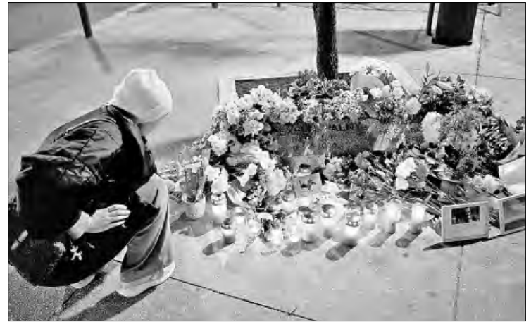
▲ Unas mil 500 personas se congregaron ayer en la tumba de Aleksei Navalny, en Moscú, al cumplirse el primer aniversario de la muerte en prisión del principal opositor al Kremlin. Su viuda, Yulia Navalnaya, recordó la fecha en una iglesia de Berlín. La imagen, afuera de la embajada rusa en Lisboa.