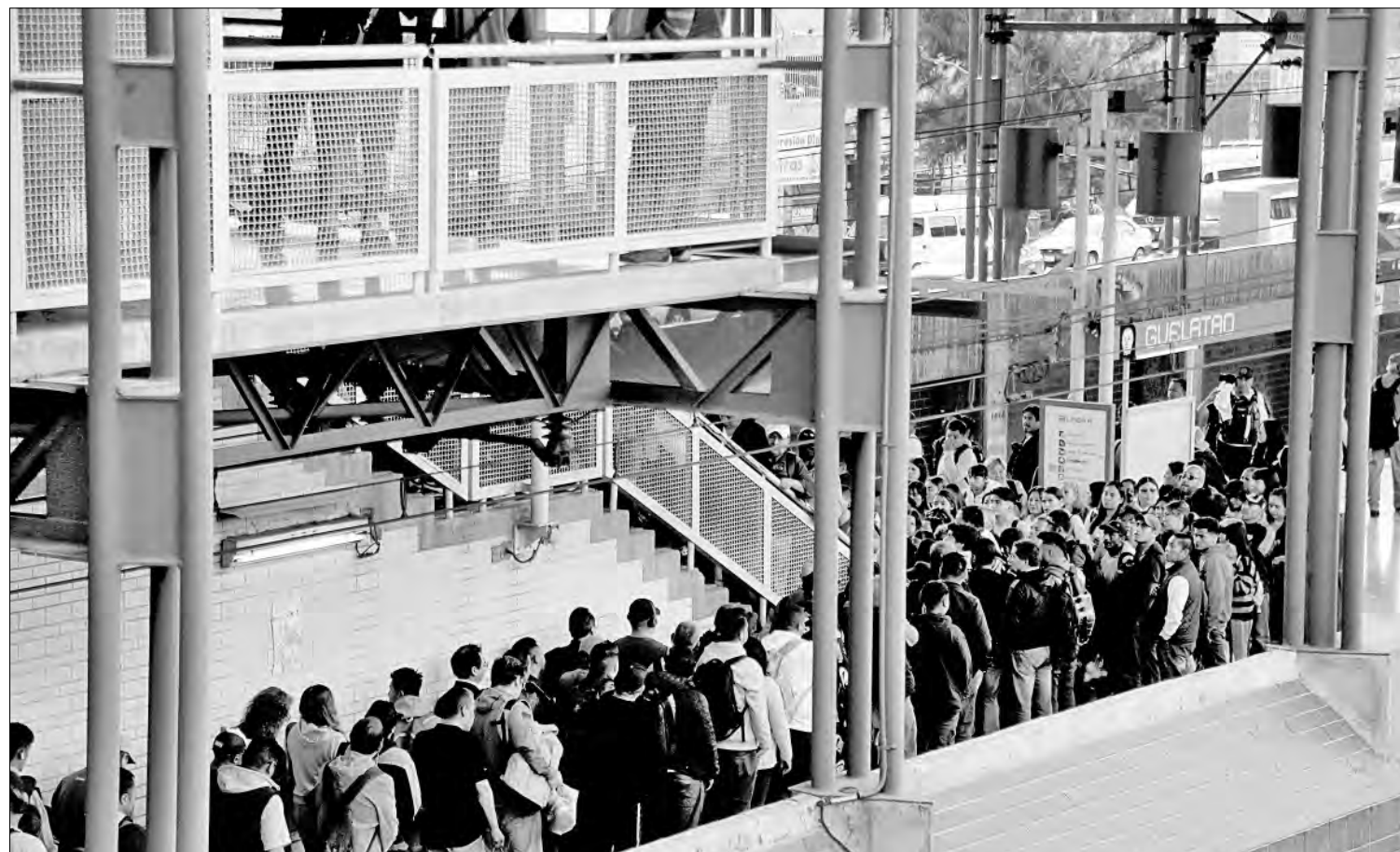
◀ De las averías principales que registró el Metro en 2024, la falta de suministro de energía eléctrica provocó la suspensión del servicio hasta por tres horas, como ocurrió el 6 de septiembre en tres estaciones de la línea A. En esta imagen, la estación Guelatao, una de las afectadas.

El 14 de febrero, en la estación Hidalgo de la línea 3, personal de transportación coordinó un corte de corriente para retirar un globo que cayó a las vías, con riesgo de generar un arco eléctrico.