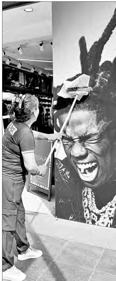
▲ Una trabajadora limpia cristales en uno de los comercios del Centro Histórico de la Ciudad de México.