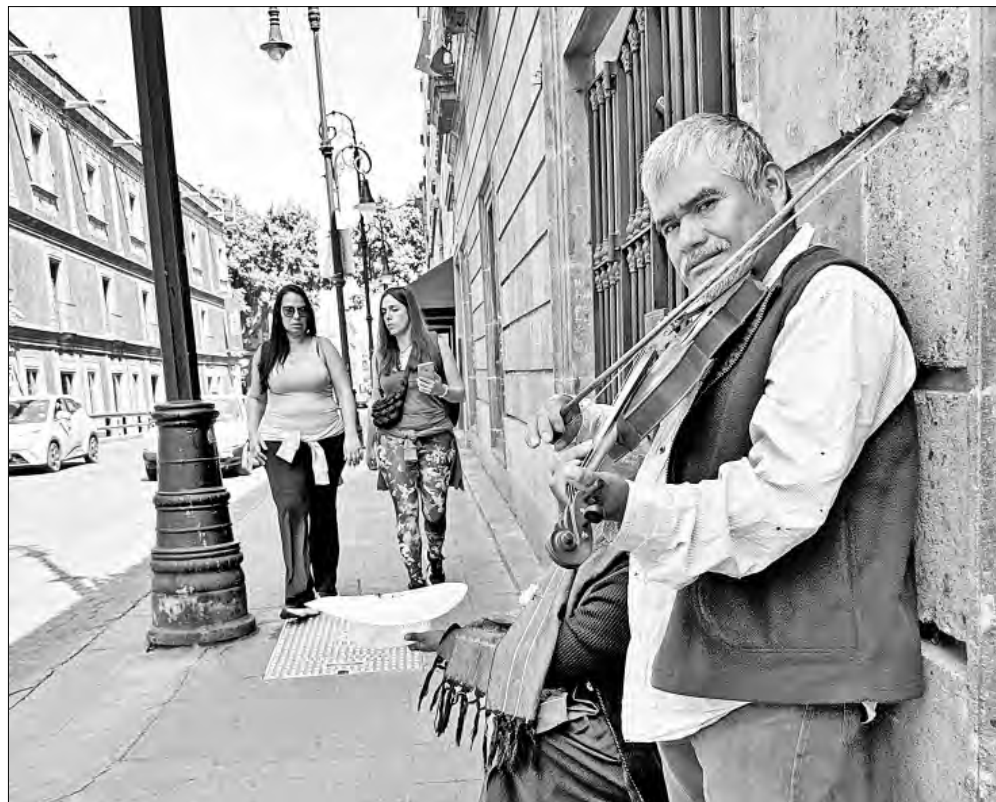
▲ Mañana dominical a ritmo de notas de violín en calles del Centro Histórico.