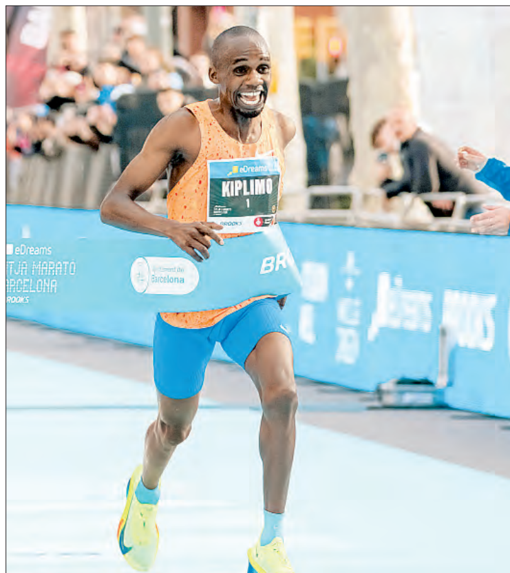
▲ Jacob Kiplimo completó los 21 kilómetros en 56 minutos y 42 segundos.

“Estudiar y entrenar en Estados Unidos me ayudó mucho porque tienen buen sistema y siempre buscan la forma de ayudarte. Ojalá México pueda generar un proyecto similar que ayude a crecer a las nuevas generaciones, eso estaría increíble”.