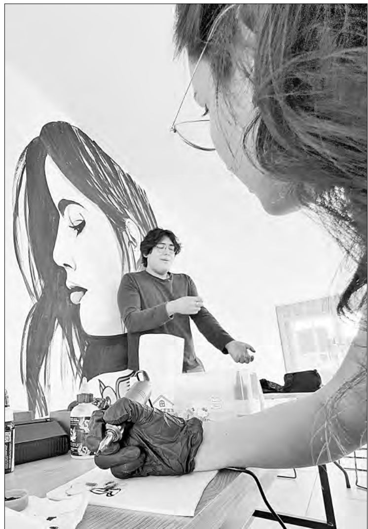
▲▼ En la escuela transitoria Telpochtlallin, ubicada en Lomas de San Lorenzo, Iztapalapa, una de las colonias más conflictivas de la ciudad, jóvenes en situación vulnerable pueden concluir sus estudios académicos o aprender diversos oficios y artes mientras consiguen o crean su propia fuente de empleo.

Rodríguez Chávez señala que no le gusta llamarle escuela a este lugar, porque los espanta y los aleja, sino Telpochtlallin, cuyo significado es jóvenes libres y en movimiento. “Aquí ellos vienen y arman sus horarios y deciden qué hacer. Comparten las mismas problemáticas y empiezan a generar redes de apoyo”, expresó.