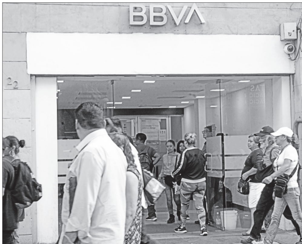
▲ De enero a julio de 2024 la banca obtuvo utilidades de 171.8 millones de pesos, es