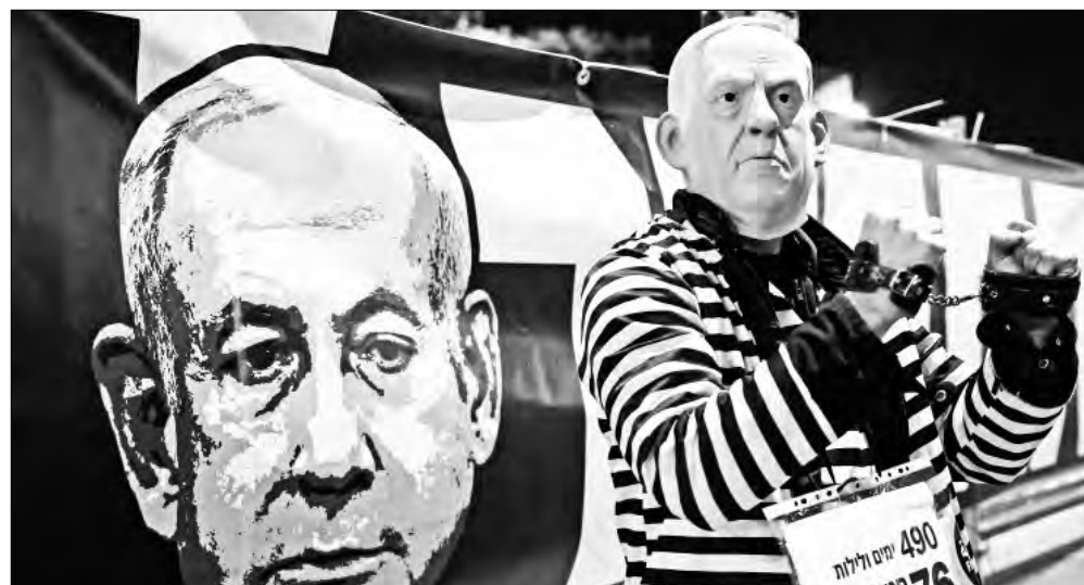
▲ Manifestante con una máscara de Benjamin Netanyahu exige la liberación de rehenes palestinos, frente al Ministerio de Defensa israelí en Tel Aviv.

http://alfredojalife.com https://www.patreon.com/alfredojalife https://substack.com/@jaliferahme https://www.facebook.com/AlfredoJalife https://vk.com/alfredojalifeoficial https://t.me/AJalife https://www.youtube.com/channel/UC1-fxFOThZDPL_c0Ld7psDsw?view_as=subscriber https://vm.tiktok.com/ZM8KnkKQn/ https://twitter.com/AlfredoJalife Instagram: @alfredojalifer