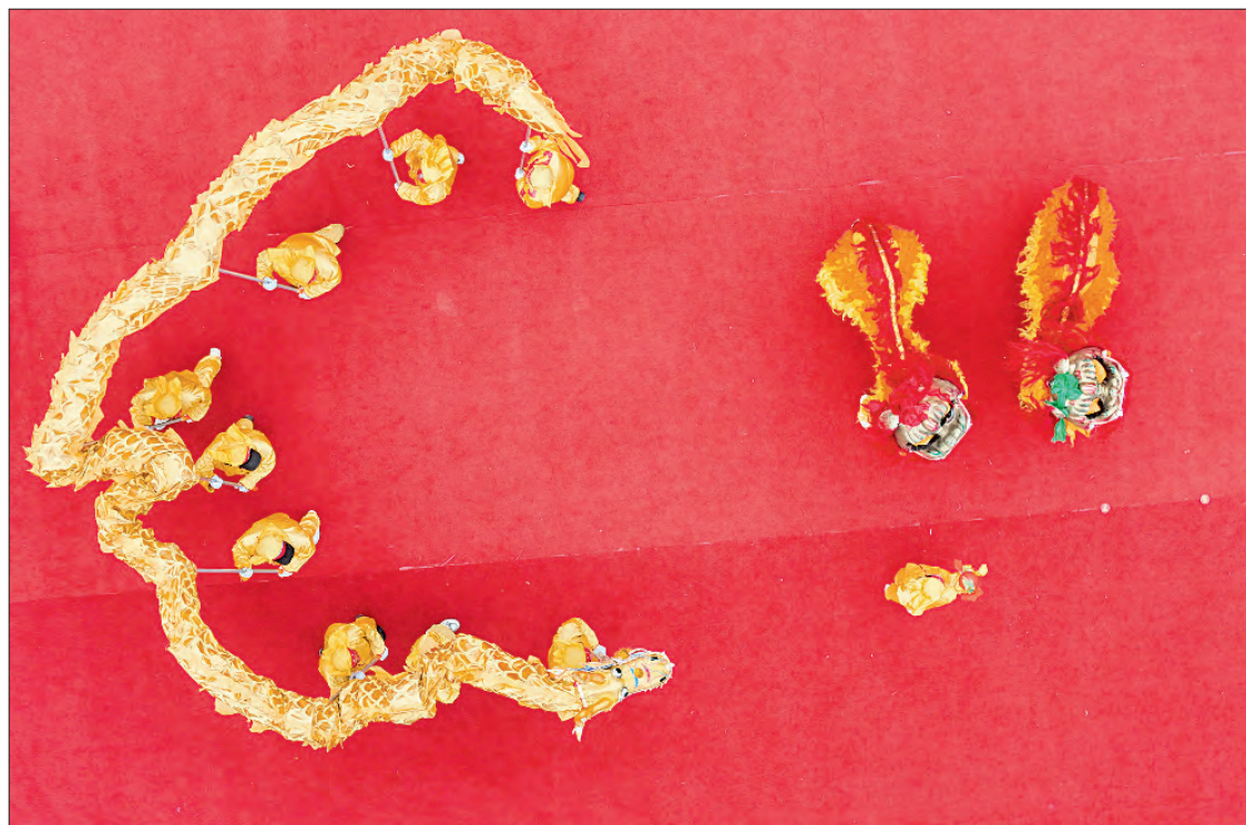
▲ Vista aérea tomada con un dron de artistas realizando una presentación de la danza del dragón durante el Festival de las Linternas en el distrito de Xuyi, en la provincia de Jiangsu, China.