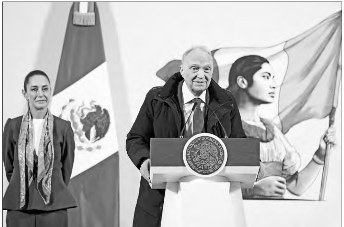
▲ La presidenta Claudia Sheinbaum Pardo escucha al fiscal general de la República, Alejandro Gertz Manero, quien asistió a la conferencia matutina.

mil 431 litros y 109 mil 70 kilos de sustancias químicas, así como 274 reactores de síntesis orgánica. La afectación económica a las organizaciones delictivas en estos laboratorios es mayor a 63 mil 249 millones de pesos.