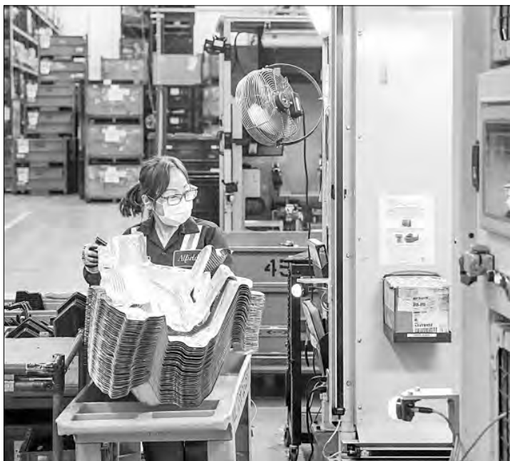
▲ Producción en una planta de Martinrea en Ontario, que suministra autopartes a empresas de Canadá y Estados Unidos.

Los aranceles de Trump al acero anunciados esta semana amenazan con causar estragos en la fabricación de automóviles en Estados Unidos, impactar gravemente en las empresas automotrices nacionales, incluidas Ford, GM y Stellantis, y hacer que los vehículos de estas compañías sean más caros para los compradores en el país, advirtieron líderes de la industria.