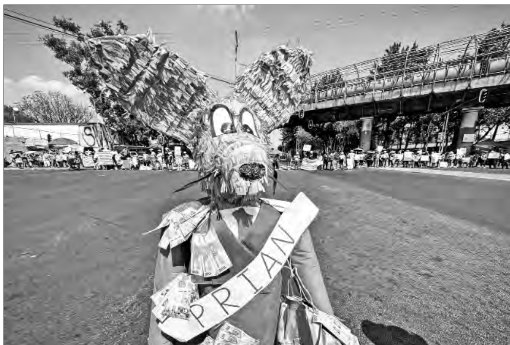
▲ Deudores de créditos de vivienda del Infonavit bloquearon ayer el cruce de

AÑADIÓ, PARA TRATAR de explicar la postura mexicana que en su momento se mencionó extraoficialmente como el amago de cancelar la colaboración institucional con la DEA y la expulsión de México de sus agentes: “Pónganlo muy simple, hay dos caminos: o se repara esa violación al acuerdo que existe entre ambos (al no avisar Estados Unidos que estaba investigando a Cienfuegos), o entonces nosotros pondremos sobre la mesa a revisar toda la cooperación”. Claro que hubo negociación y, derivado de ella, el gobierno de Estados Unidos pidió a la jueza del caso Cienfuegos que retirara los cargos, por razones de política internacional y cooperación entre ambos países. ¡Hasta mañana!