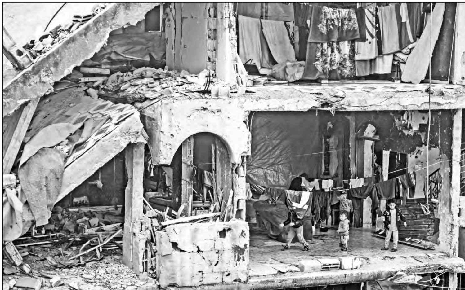
◀ Niños palestinos juegan en una casa que apenas sigue en pie, en Jabaliya, ciudad destruida por la ofensiva aérea y terrestre del ejército israelí.