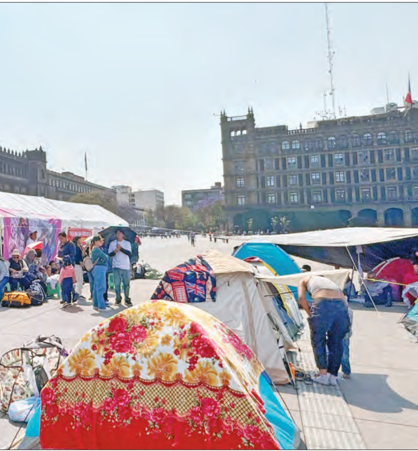
▲ Integrantes de la Alianza de Pueblos por la Justicia Social arrancaron una protesta frente a Palacio Nacional para solicitar la intervención de la Presidenta contra “la cerrazón” del gobernador de Oaxaca, Salomón Jara.