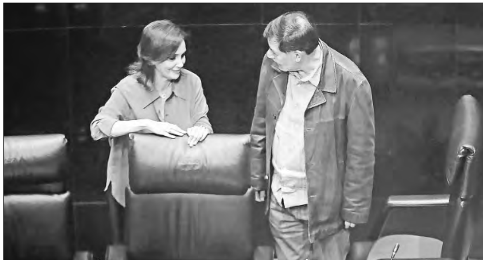
▲ Los polémicos legisladores Lilly Téllez (PAN) y Gerardo Fernández Noroña (Morena)