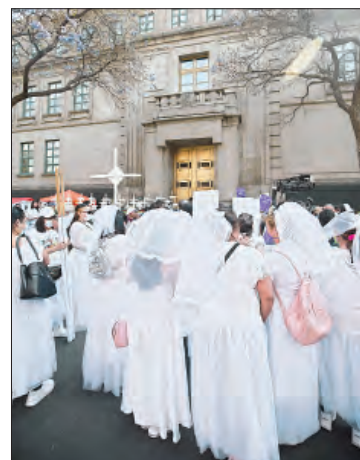
▲ Vestidas de novias, mujeres de 29 organizaciones presentaron un amicus curiae a la SCJN.

También que la Corte reconozca que no existe evidencia científica que permita insinuar que el abandono total parenteral no produce serio menoscabo en todas las áreas de desarrollo de las madres solas. Y que nada demuestre que el régimen de sociedad conyugal garantice la falta de disparidad patrimonial al momento de la disolución, menos en los casos de abandono de las obligaciones parentales.