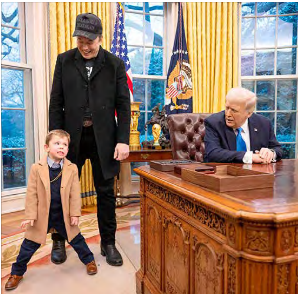
▲ Elon Musk, director del Departamento de Eficiencia Gubernamental, visitó la Oficina Oval con su hijo. Donald Trump firmó una orden ejecutiva para seguir con el recorte de personal y gastos federales. / P 22