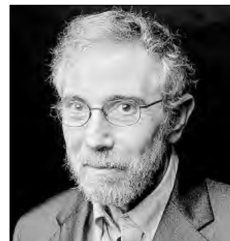
▲ Paul Krugman advierte perjuicio colateral a la planta productiva estadounidense.

El también profesor en la City University of New York aseveró que dichas relaciones comerciales