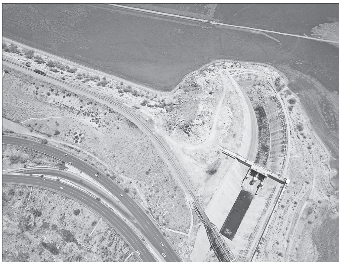
▲ Aspecto de la presa Abelardo L. Rodríguez, en el municipio de Hermosillo, Sonora, la cual está totalmente seca, debido al estiaje que padece la entidad desde 2022.