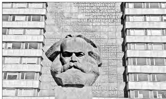
▲ El busto de Karl Marx en Chemnitz, centro de las festividades de la Capital Europea de la Cultura.