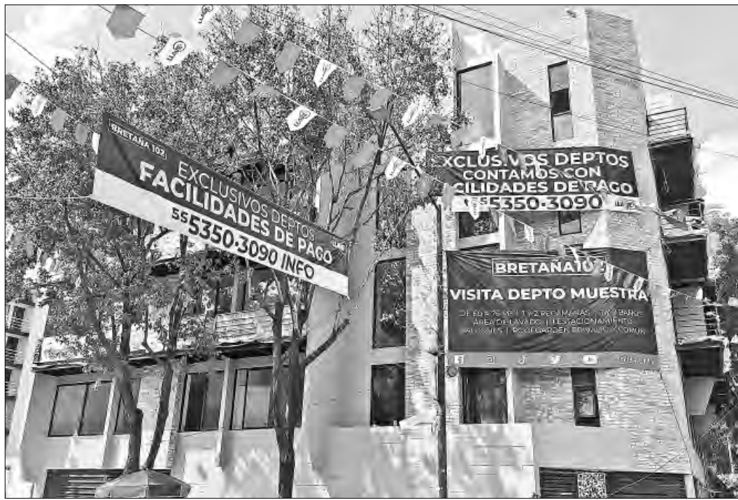
▲ Tras generar ahorros por algunos años, los llamados millennials ya compran casa, señalan

“Últimamente la gente a esas edades no tiene tanta inquietud por comprarse una vivienda como a lo mejor lo tenían en generaciones pasadas. Pero a medida que va pasando el tiempo, cuando se hacen más mayores y se establecen, si que tienen esa inquietud”, destacó.