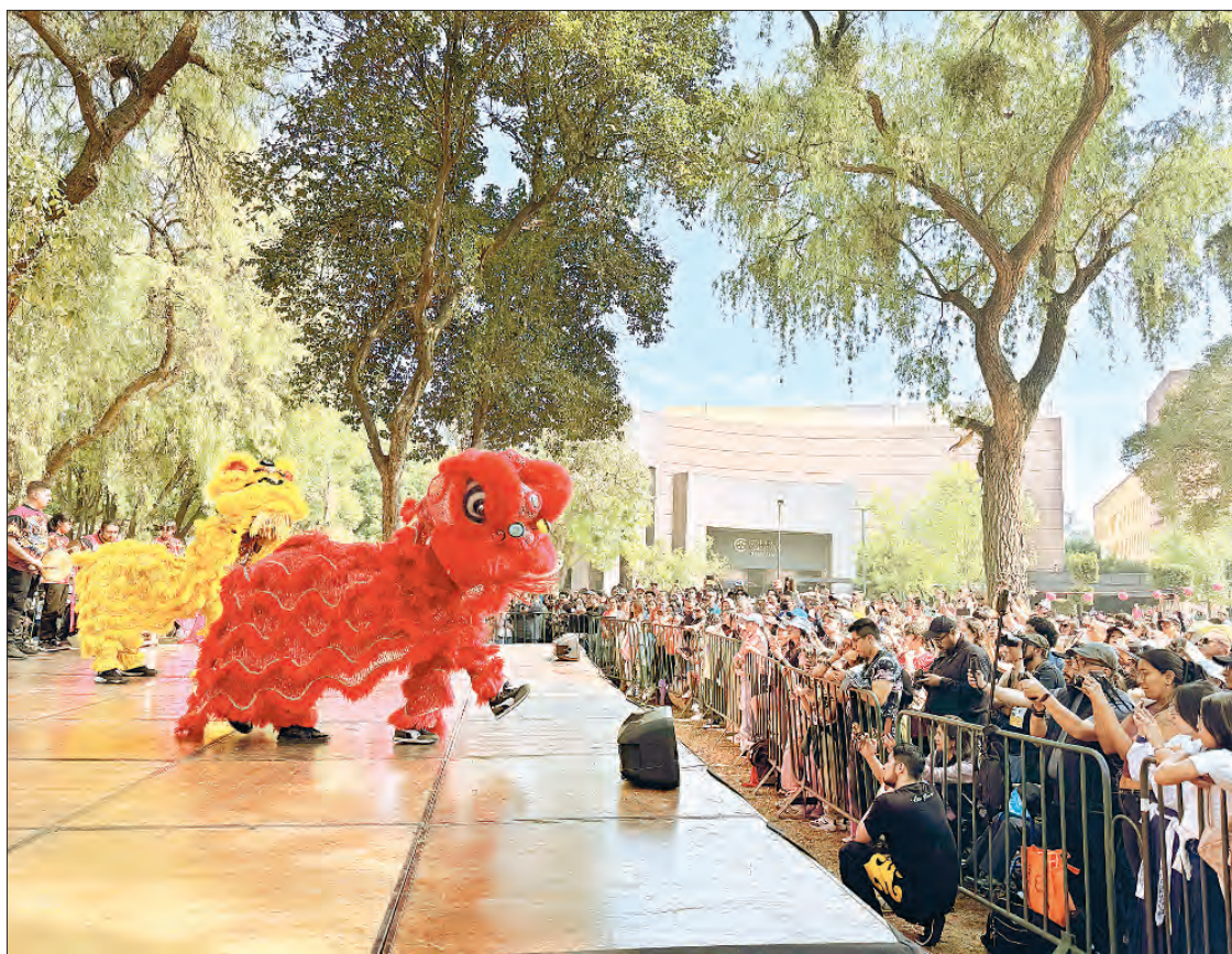
▲ La audiencia no terminaba de salir del asombro cuando aparecieron en el escenario un par de seres fantásticos que interpretaron la Danza del león y el dragón .

Más de 26 mil personas llegaron desde temprano al complejo cultural para festejar a la serpiente de madera