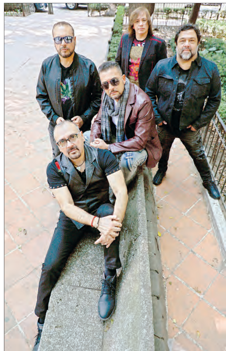
▲ Entrevista con la banda de rock pop Elefante a propósito de su concierto en el Auditorio Nacional, enfilándose hacia su 30 aniversario en 2026.

Elefante regresa al Auditorio Nacional este 13 de febrero, a las 20:30 horas, donde sonarán canciones atemporales como Así es la vida , Ángel , Sabor a chocolate , Mentirosa , El abandono , La que se fue , De la noche a la mañana , entre un sin fin, de “éxitos inmortales” y otras sorpresas.