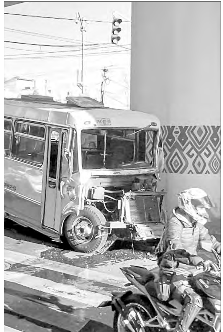
▲ El conductor de una unidad de transporte público se impactó contra un pilar de la línea 12 del Metro sobre avenida Tláhuac, a la altura de la calle Pirules, en la colonia Santa María Tomatlán. Personal de la Secretaría de Movilidad señaló que ante el incidente se activó el protocolo para la atención de las personas lesionadas así como un proceso de investigación.