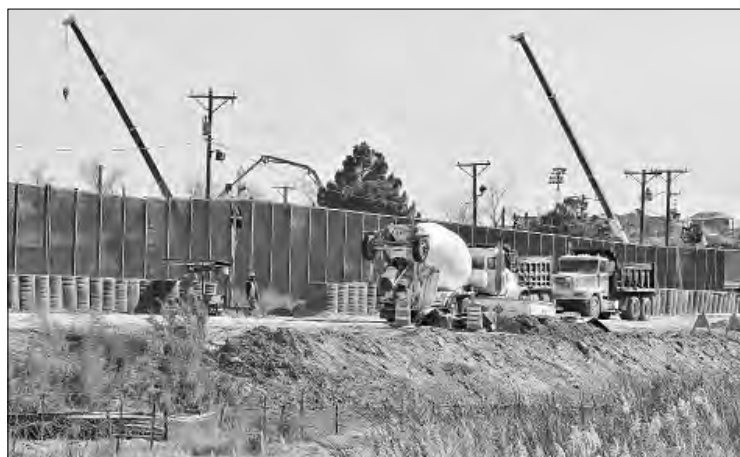
▲ Al poniente de Ciudad Juárez se preparando el montaje de más malla de púas para frenar a migrantes.

Un policía del condado les ofreció apoyo, pero un segundo uniformado “racista” les exigió sus documentos y, al no presentarlos, dio aviso a la autoridad migratoria. Se les detuvo y tras varios días de encierro e incommunicación, se les envió vía aérea a la Ciudad de México.