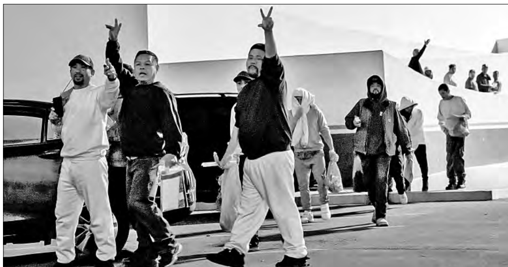
▲ Un grupo de aproximadamente 100 migrantes, algunos detenidos durante redadas efectuadas en campos agrícolas de Denver,

Colorado, fueron deportados anoche por el paso fronterizo de El Chaparral.