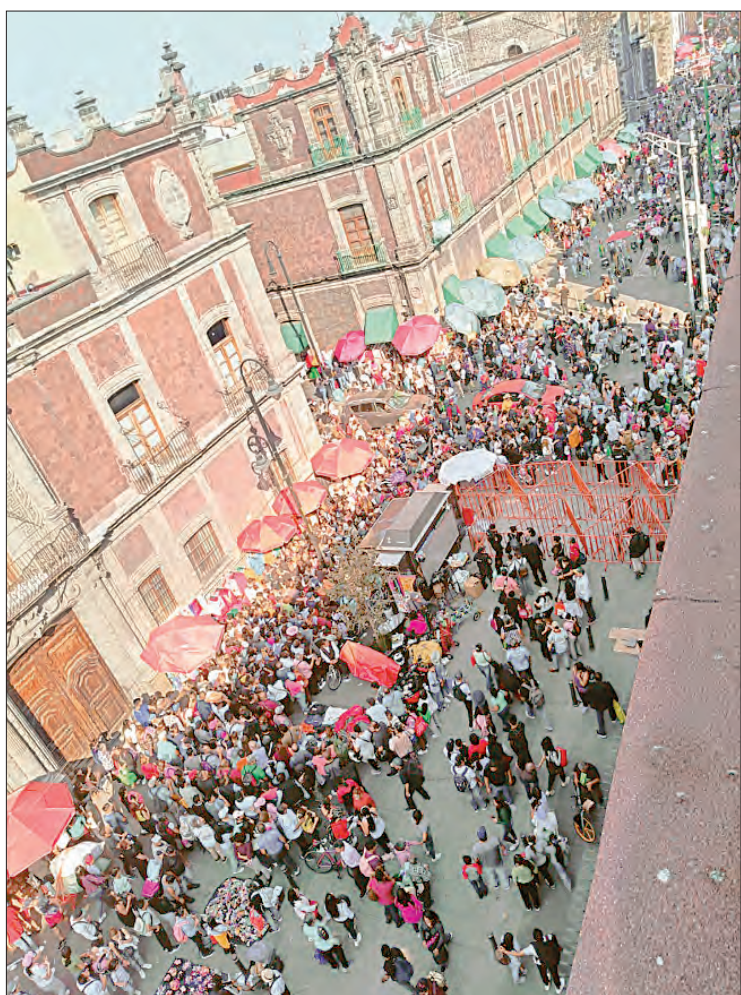
▲ Representantes de los recintos culturales se dijeron afectados por los constantes bloqueos que se realizan en la zona por la relevancia que tiene Palacio Nacional.

“Estamos dispuestos a dialogar y aportar ideas, se requiere el trabajo conjunto de la Autoridad del Centro Histórico, la Secretaría de Cultura local, el Instituto Nacional de Bellas Artes y Literatura, el Instituto Nacional de Antropología e Historia, así como de la Presidencia, Seguridad Ciudadana, Ordenamiento Territorial, y otras más. Tenemos que trabajar juntos”, concluyeron.