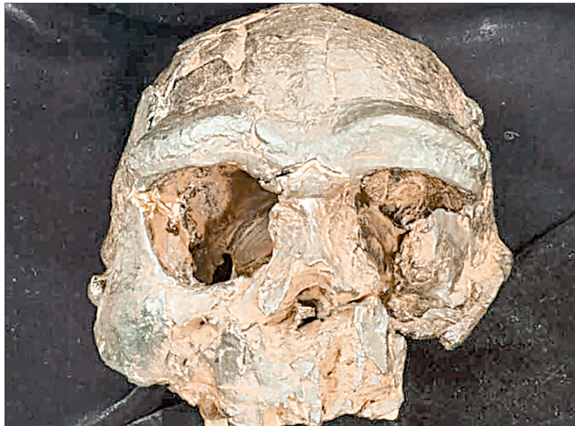
▲ Réplica del cráneo de Homo erectus de Java.

Esta adaptabilidad “amplía la presencia potencial del Homo erectus a la región saharo-india (una vasta zona desértica) a través de África y a entornos similares en Asia”, estimó el especialista en evolución humana.