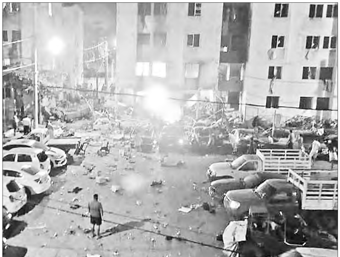
▲ El edificio 588 del andador Tuxtleno, en el fraccionamiento Nuevo Infonavit de Lázaro Cárdenas,