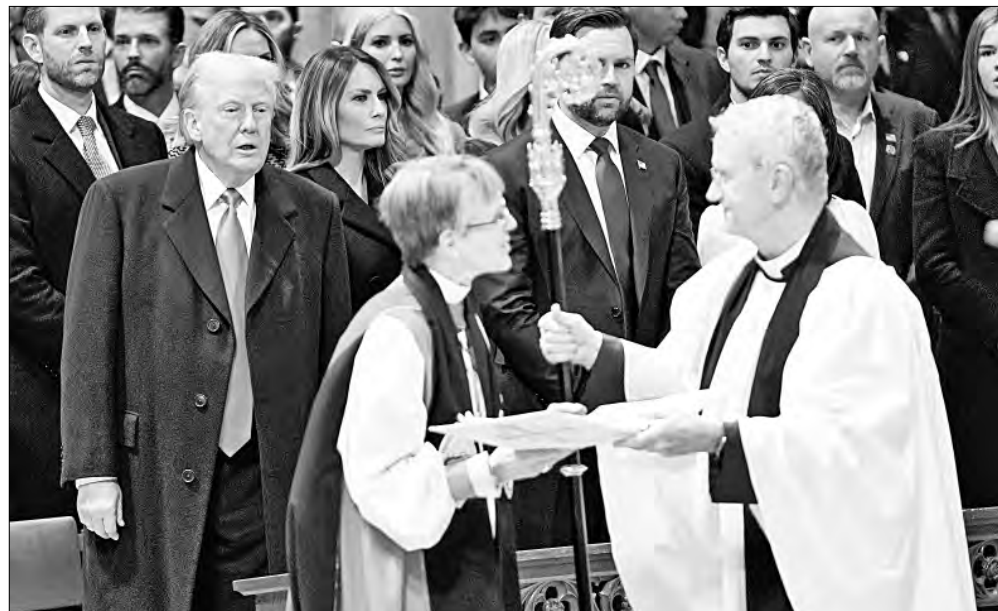
▲ El presidente de Estados Unidos, Donald Trump, observa a la obispa Mariann Budde, quien durante el sermón en la Catedral de Washington instó al mandatario a ser

Y, MIENTRAS TRUMP cierra la frontera a los migrantes sin regularización documental, los caza dentro del país para deportarlos, y envía mil 500 soldados, probablemente a cuenta de un total de 10 mil, a la frontera sur, ¡hasta mañana!