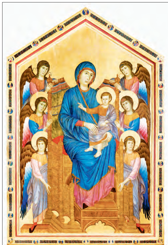
►► Virgen con el Niño , atribuida al Maestro de San Martino, Maestà , del Museo Nacional de San Matteo de Pisa, y Virgen con el Niño en majestad rodeados de seis ángeles (hacia 1280), de Cimabue.