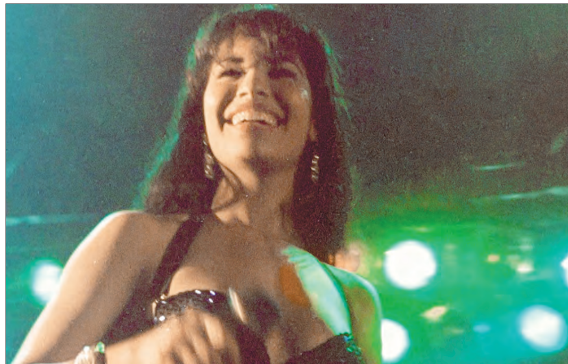
▲ Arriba, imagen de la cinta Sly Lives! (aka The Burden of Black Genius) . Sobre estas líneas, fotograma de Selena y Los Dinos .

Lo que comenzó como un ajuste necesario debido a la pandemia de covid, se convirtió en una parte vital del programa. Desde el 30 de enero hasta el 2 de febrero, el público podrá ver por streaming gran parte del programa. Los precios van de 35 dólares por un boleto para una sola película hasta 800 dólares por acceso ilimitado.