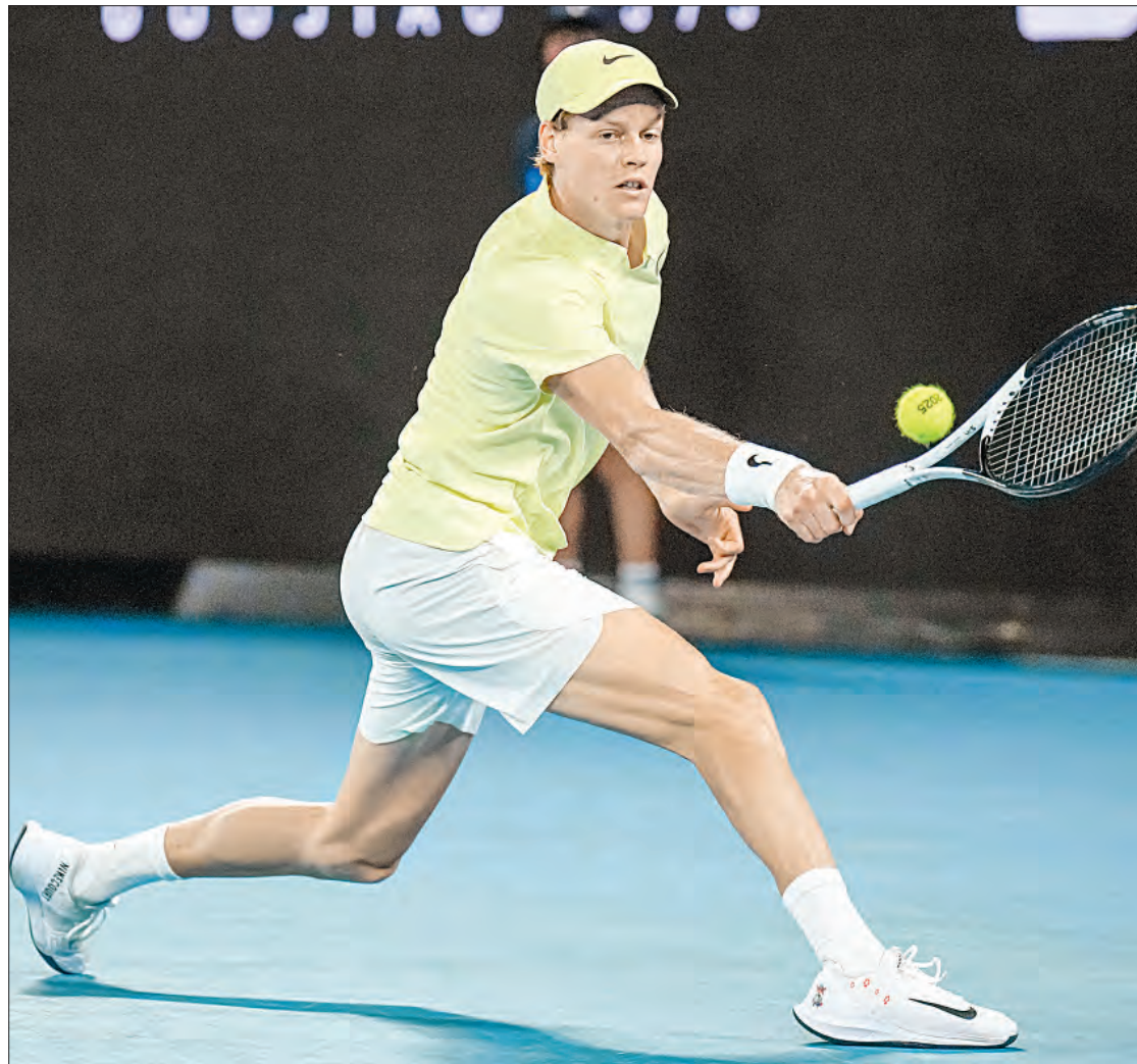
▲ Jannik Sinner (en la imagen) enfrentará al estadounidense Ben Shelton por el pase a la final.

De Miñaur, de 25 años, había llegado por primera vez a cuartos de final en el torneo de su país tras eliminar al estadounidense Alex