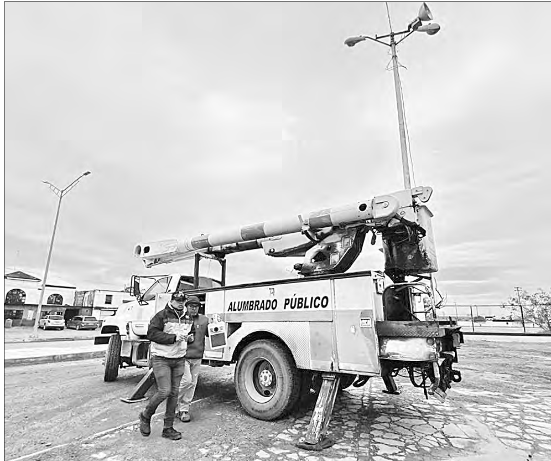
◀ Trabajadores del ayuntamiento de Matamoros, Tamaulipas, hacen arreglos en el viejo estadio municipal, en la avenida Universidad, donde se instalará un campamento para recibir a los migrantes deportados de Estados Unidos.

Burgueño Ruiz externó que la intención es brindar las condiciones de un trato digno, respeto a los derechos humanos y garantía de un buen retorno a todos aque-