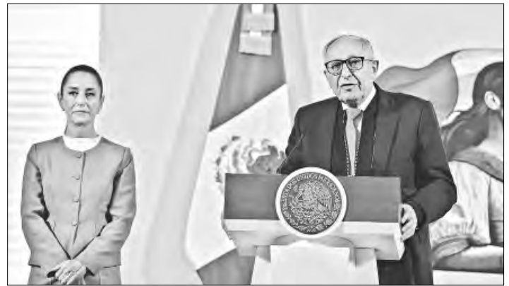
POSIBLE "SEGUNDA VUELTA"

Por otra parte, el secretario de Salud, David Kershenobich, descartó que se necesite activar una alerta por el metapneumovirus humano y dijo que los casos detectados en el país son normales y no deben generar alarma entre la población. Reiteró que se trata de un virus común en esta época del año.