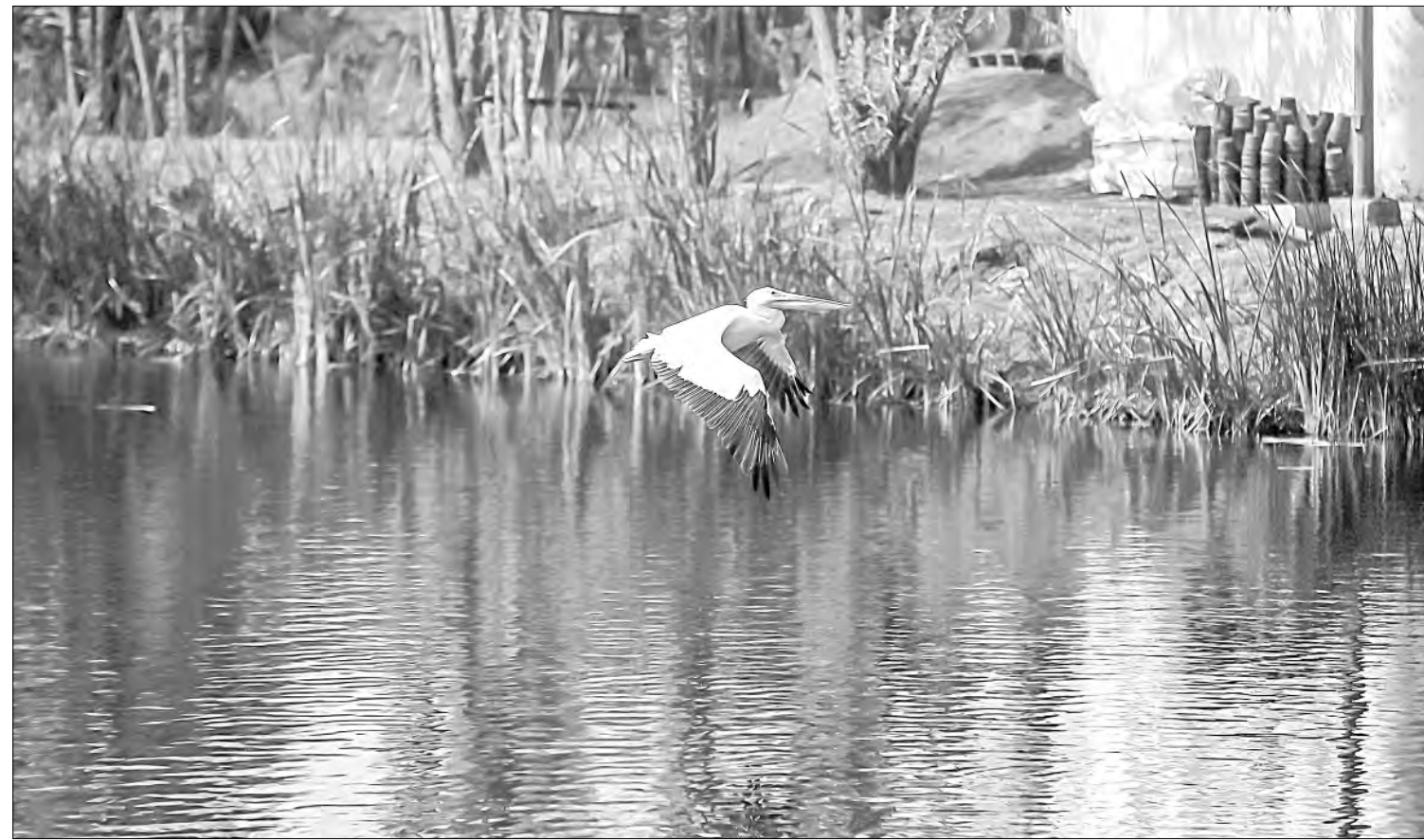
▲ Desde su rescate, en el parque ecológico de Xochimilco se pueden observar diferentes tipos de aves y andar en bicicleta.