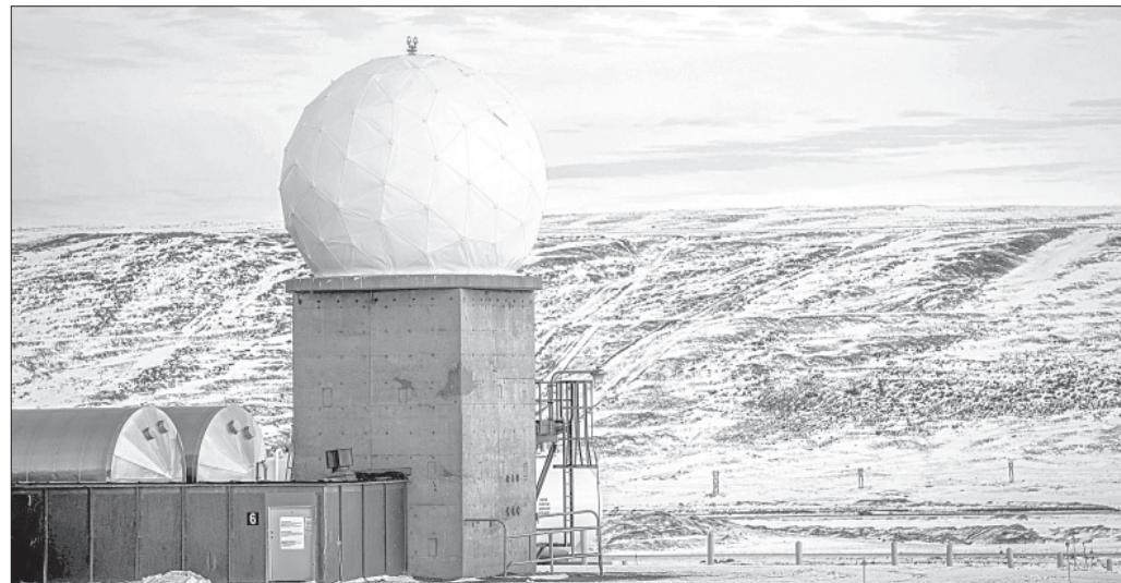
▲ La base espacial Pituffik en Groenlandia, es de sumo interés para Estados Unidos.

http://alfredojalife.com https://www.patreon.com/alfredojalife https://substack.com/@jaliferahme https://www.facebook.com/AlfredoJalife https://vk.com/alfredojalifeoficial https://t.me/AJalife https://www.youtube.com/channel/UCI-fxfOThZDPL_cOLd7psDsw?view_as=subscriber https://vm.tiktok.com/ZM8KnkKQn/ https://twitter.com/AlfredoJalife Instagram: @alfredojalifer