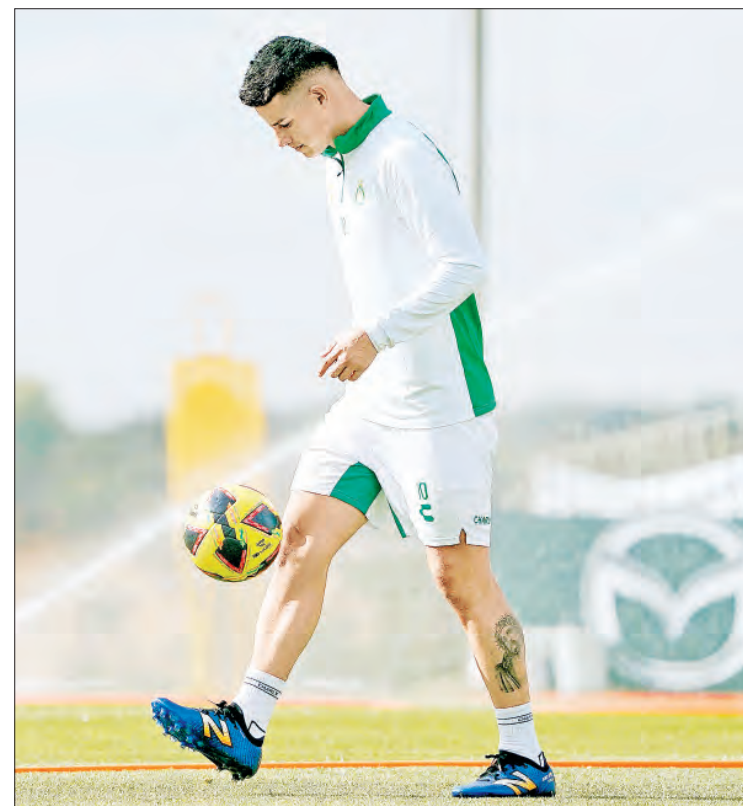
► El astro colombiano fue presentado ayer de manera oficial por el León. Manifestó su ilusión por integrarse con el conjunto esmeralda y su deseo de jugar el Mundial de Clubes 2025.