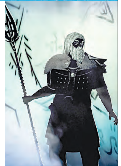
Las visiones de Odín

22:00 TIEMPO DE FILMOTECA UNAM: HISTORIAS DE SERVICIO Y DE LEALTAD El cuento de la doncella (Alemania, 1990) De Volker Schlöndorff