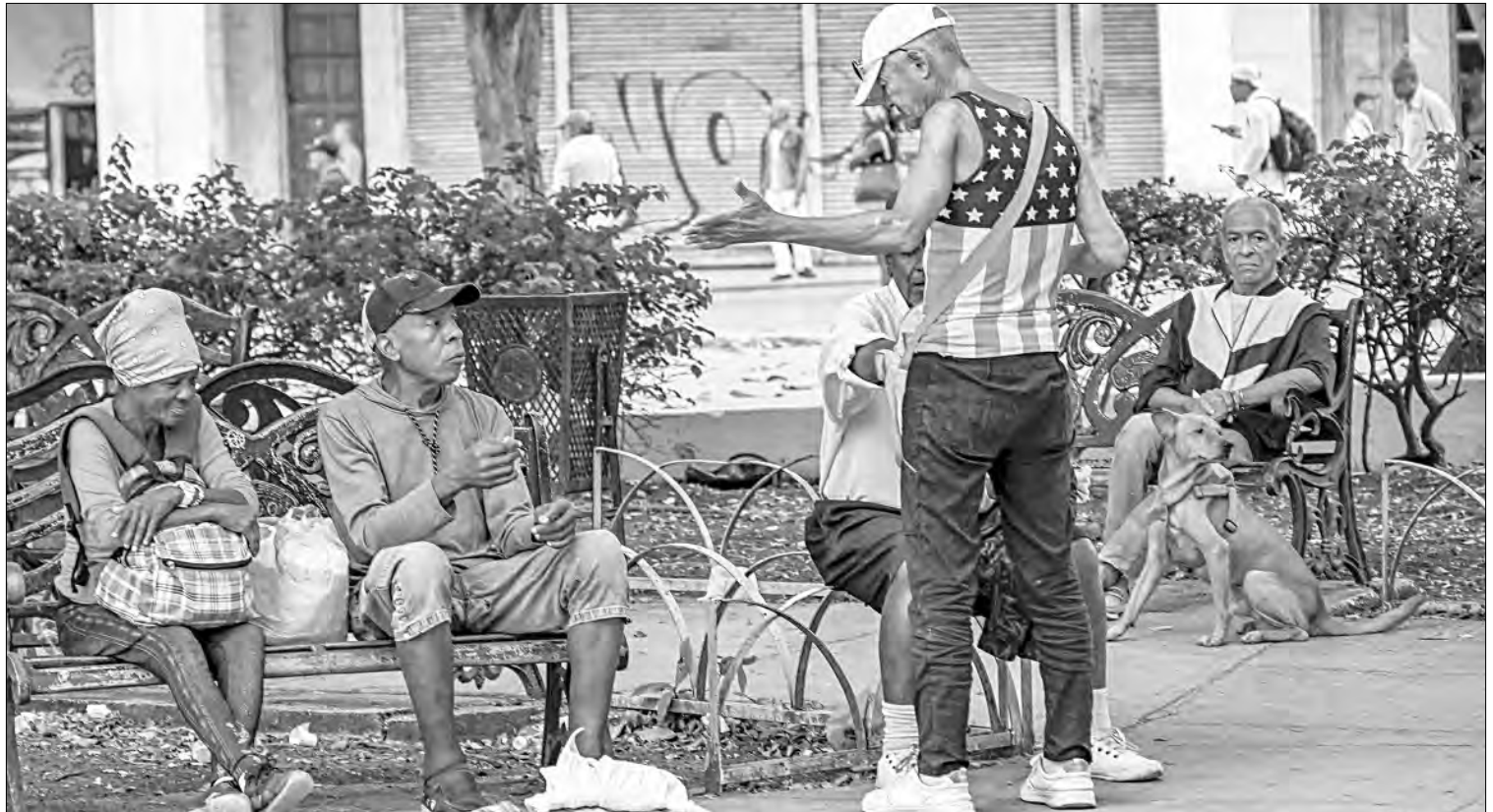
▲ Cubanos conversan en un parque de La Habana, en imagen captada ayer.

La presidencia de Cuba señaló en X que la isla nunca debió estar