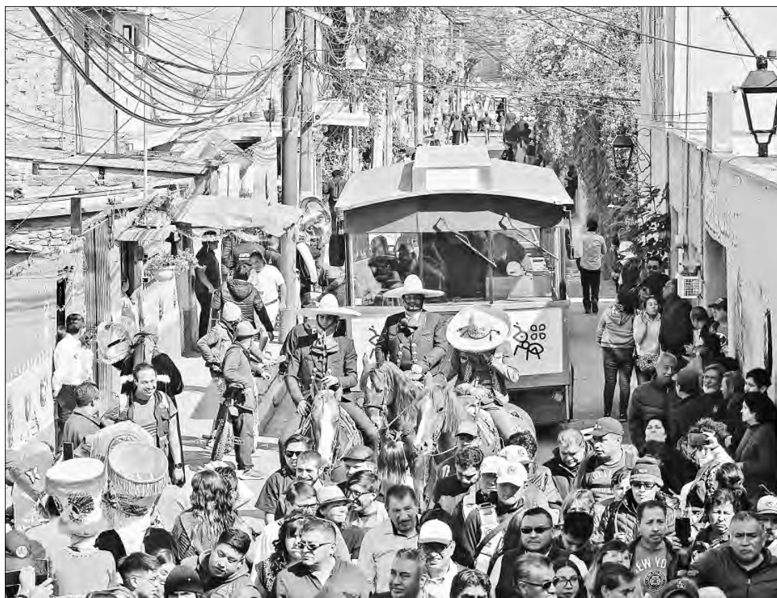
◀ La jefa de Gobierno, Clara Brugada, inauguró los trabajos de rescate del pueblo originario de San Juan Tlihuaca, en Azcapotzalco, como parte del programa Yólotl Anáhuac.

Entregó Clara Brugada obras en San Juan Tlihuaca, primero en ser rehabilitado