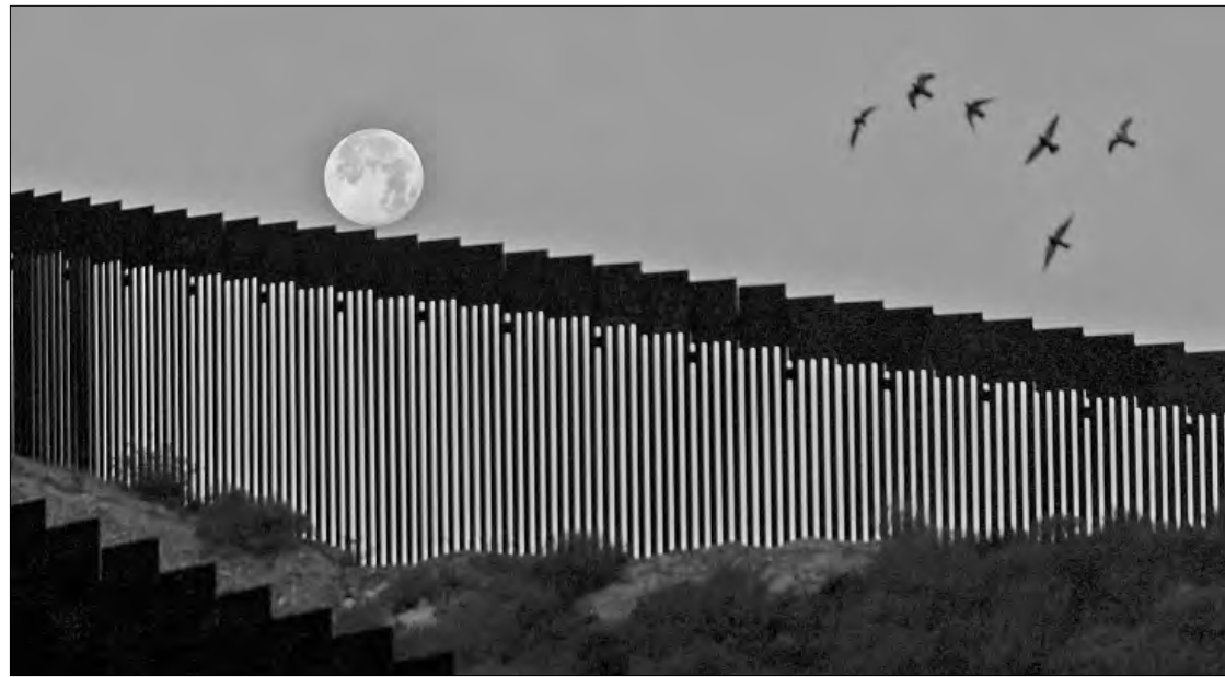
▲ La Luna en salto de valla.

men que en lugar de ser un proceso de selección abierto se privilegie el amiguismo.