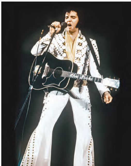
▲ El Rey del Rocanrol, Elvis Presley.

PD. A NUEVE años de su postrero adiós, recordamos al Muñeco Lalo Tex, compositor, guitarrista, cantante y la imagen frontal de una de las bandas más emblemáticas del rock mexicano: Tex Tex. Lalo falleció víctima de un infarto la madrugada del 18 de enero. Pocas horas antes, había tocado en el frontón El Puente, en Chimalhuacán. Actualmente Tex Tex sigue rocanroleando chido liderado por Chucho Tex. Salú , por eso.