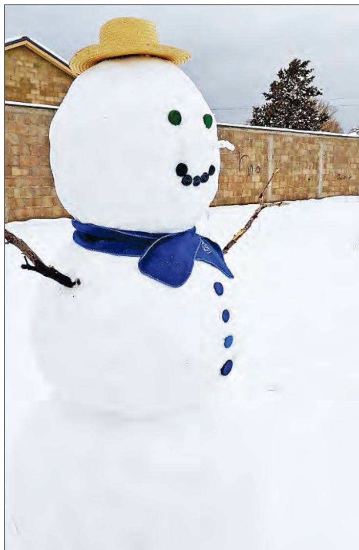
▲ Pobladores de Ciudad Madera se conectaron con su flanco lúdico.