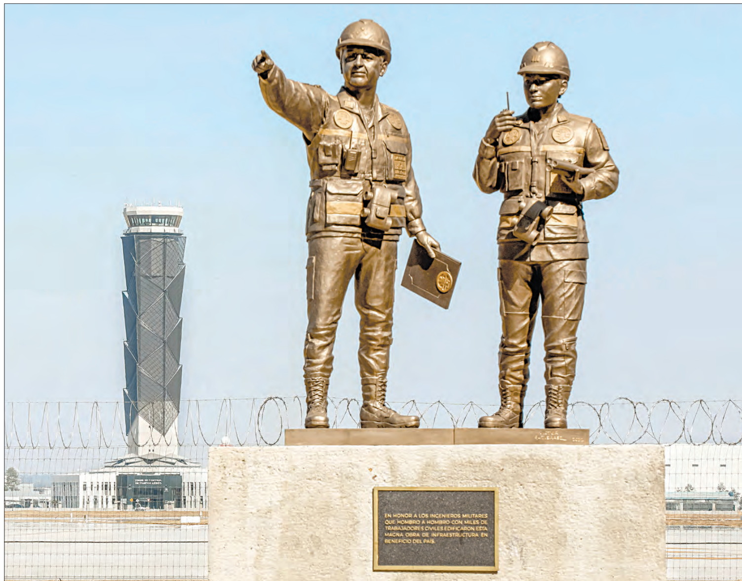
▲ Monumento ubicado en las instalaciones del AIFA que honra a los ingenieros militares que participaron en su construcción. Al fondo se observa la torre de control, de 89 metros de altura, inspirada en un

“El nuestro fue un proyecto totalmente atípico, pero así somos los mexicanos: entrones, trabajadores, singulares, y lo que se reconoció, entre otras cosas, fue que este nuevo aeropuerto, como la mayor parte de los del mundo, ya no es mera infraestructura de transporte aéreo convertida en un gigantesco mall, sino que ahora hay el cometido de convertir esa infraestructura en el portal de entrada a los países y tener una responsabilidad cultural, social y ambiental.”