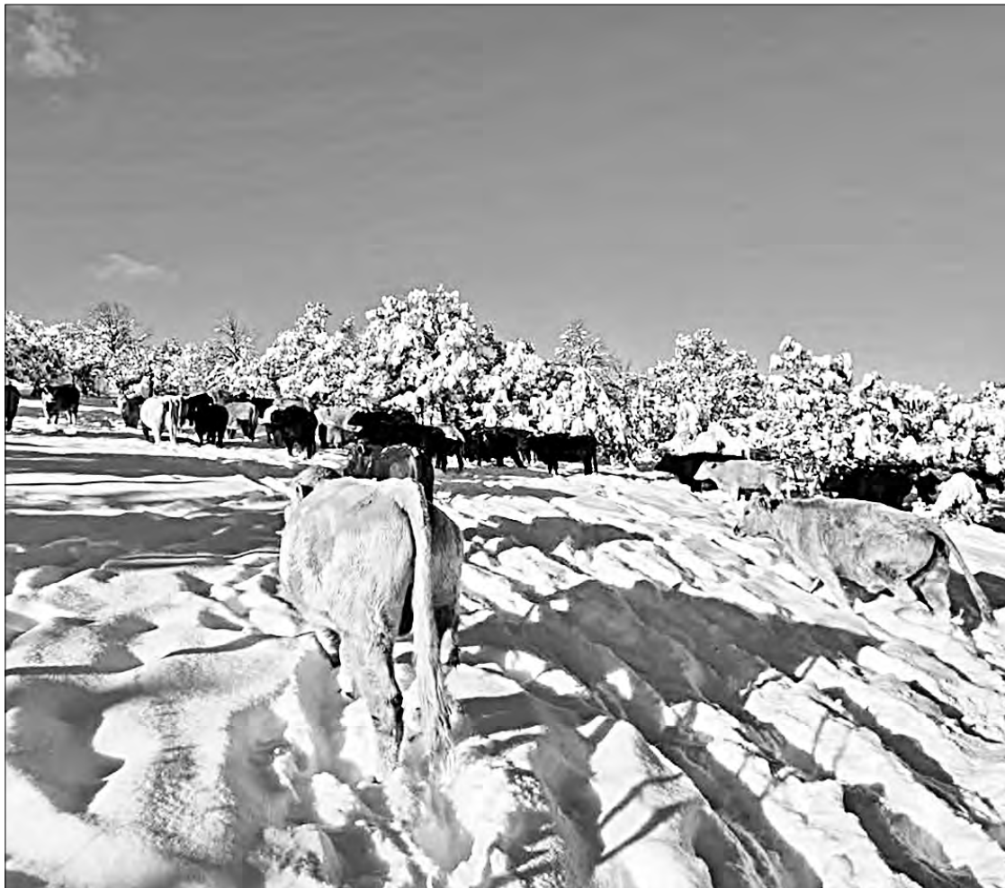
◀ Un grupo de vacas caminan sobre la nieve en la comunidad de Teseachic, municipio de Namiquipa, Chihuahua, tras la llegada del frente frío 21 y la segunda tormenta invernal de la temporada.

Con la finada y una persona en situación de calle de Juárez, junto con una más que pereció intoxicada por dióxido de carbono, sumaron cinco