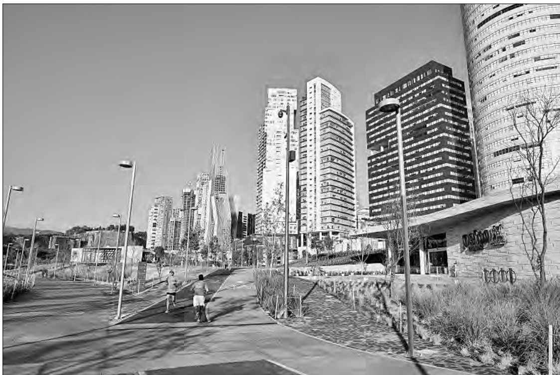
▲ Aspecto del parque La Mexicana, ubicado en Santa Fe, cuyo sistema de actuación por

Los SAC La Mexicana y Distrito San Pablo se encuentran vigentes, aunque el primero no cuenta con recursos pendientes para ser ejercidos, y en el segundo apenas se creará el fideicomiso para obtener recursos y ejecutar los proyectos estratégicos, entre los que se encuentran la conservación de inmuebles catalogados, diversificación de vivienda y mezcla de usos de suelo, movilidad, mejoramiento de espacios públicos e infraestructura hidráulica y aprovechamiento de inmuebles de propiedad pública.