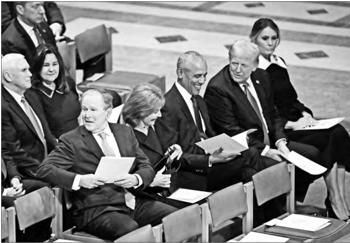
CUATRO EX MANDATARIOS MÁS EL ACTUAL, EN LA CEREMONIA