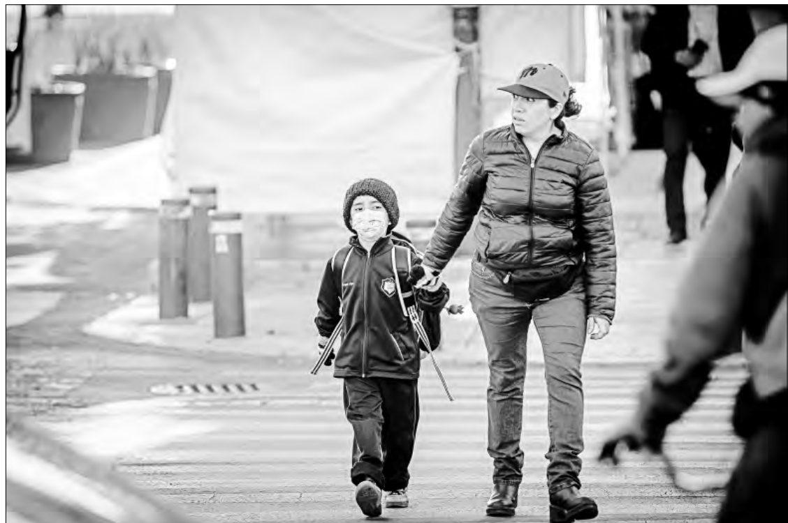
▲ En medio del frío matinal, centenas de niños y niñas se presentaron para reanudar las actividades

En un recorrido por la vialidad se observaron varios negocios que tienen instaladas tarrazas en tramos de la banqueta; uno de ellos, con razón social Puro Sinaloa, con sellos de suspensión de actividades, aunque con el engomado ya desprendido tirado en el piso.