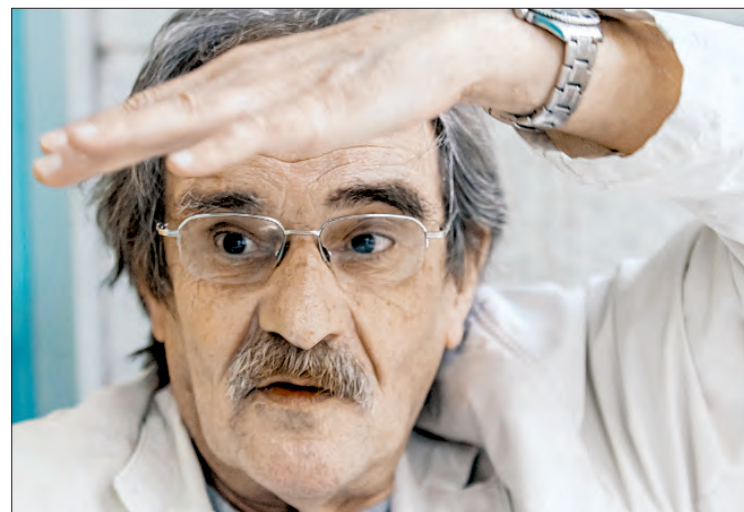
▲ Ayer fue velado el periodista, patólogo y cineasta mexicano, quien falleció a los 76 años a causa de un tumor cerebral.

En 2015, publicó Historias épicas de la medicina , libro que marcó un hito en la divulgación científica y