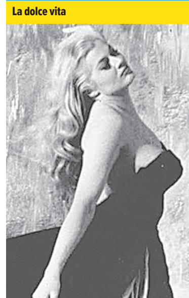
La dulce vita