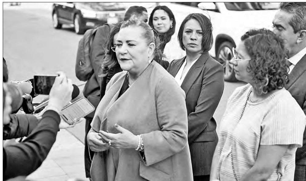
▲ Los consejeros y la presidenta del INE, Guadalupe Taddei, estuvieron ayer en Palacio Nacional con la mandataria Claudia

o herida, la reacción popular debe ser a fondo”. Nótense las siete palabras finales, que son una arenga abierta del sargento Calderón a la acción directa y frontal ( https://goo.su/4poUyW ).