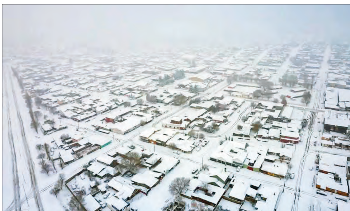
▲ Arriba, los alrededores de la presa Peñitas, en el municipio de Ciudad Madera, Chihuahua, lucen completamente cubiertos por la nieve; abajo, las viviendas amanecieron pintadas de blanco tras el impacto de la segunda tormenta invernal y el frente frío 21.