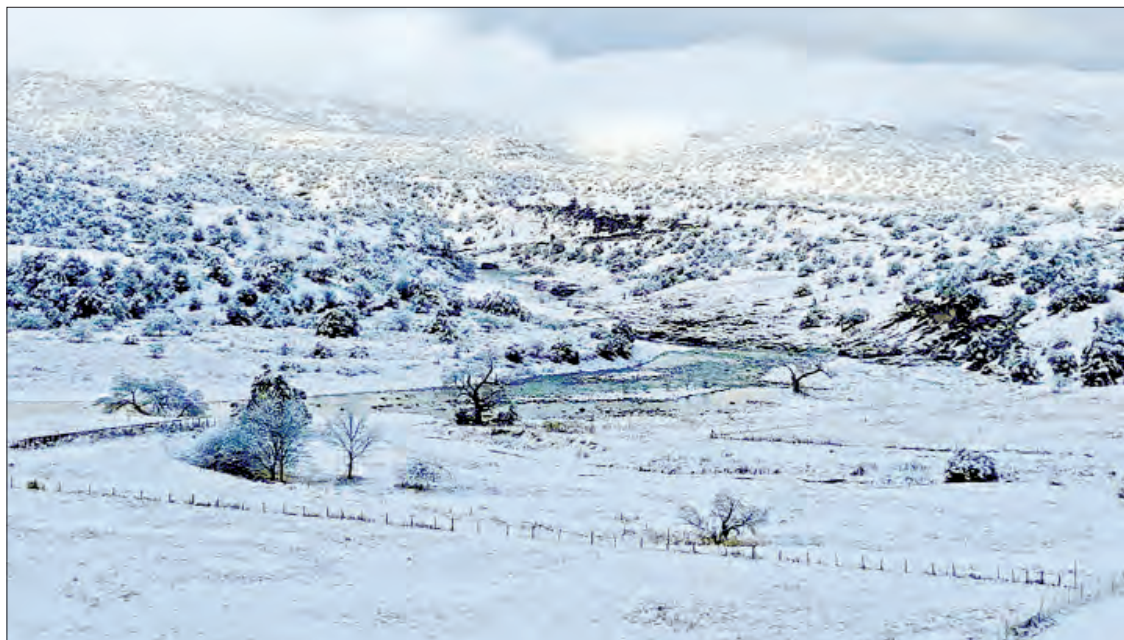
▲ Sirupa, en la Sierra Madre Occidental.