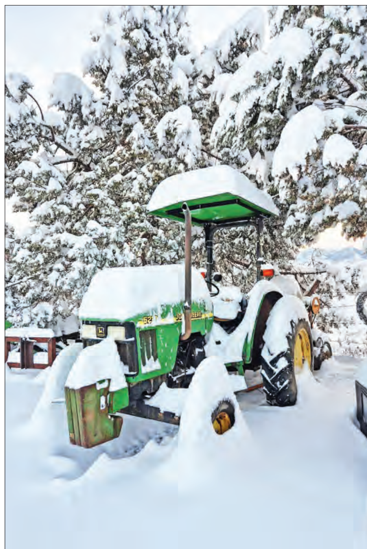
▲ Aspecto de un rancho de la comunidad de Teseachic, municipio de Namiquipa.