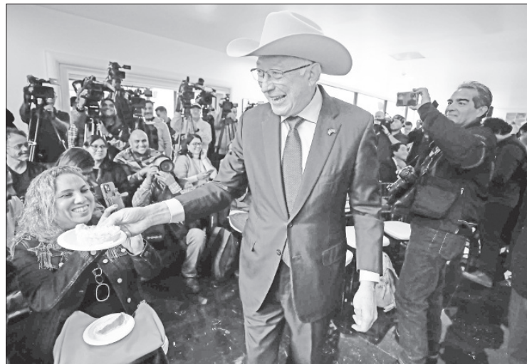
▲ El embajador estadounidense expresó en su última conferencia que no se arrepiente de nada.

“No me arrepiento de nada. Me voy sintiendo que llevamos un trabajo fuerte y bueno, que se tenía que llevar entre los dos países de más consecuencia en el mundo que son para mí Estados Unidos y México. Y espero que ese trabajo seguirá”, concluyó el embajador Salazar.