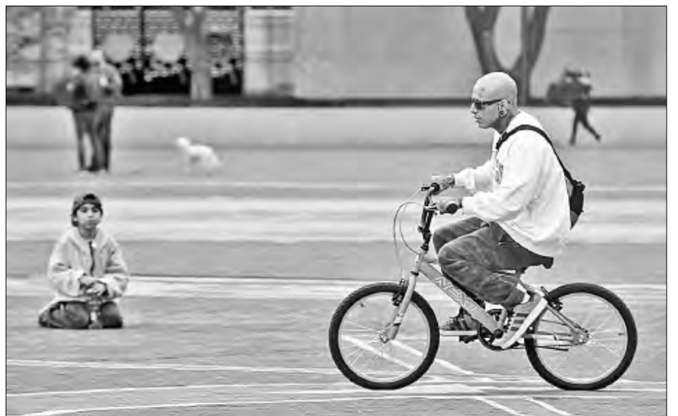
▲ Luego de tomar la foto del recuerdo del niño con su regalo de Día de Reyes, un adulto disfruta del obsequio ante la mirada infantil.