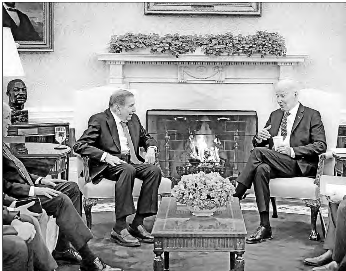
▲ El opositor venezolano Edmundo González (a la izquierda) fue recibido en la Casa Blanca por el mandatario estadounidense, Joe Biden. “Hablamos sobre diversos aspectos de la relación bilateral”, declaró el ex candidato presidencial, quien perdió ante Nicolás Maduro.

FUIMOS A AGRADECER EL APOYO, DICE EL OPOSITOR