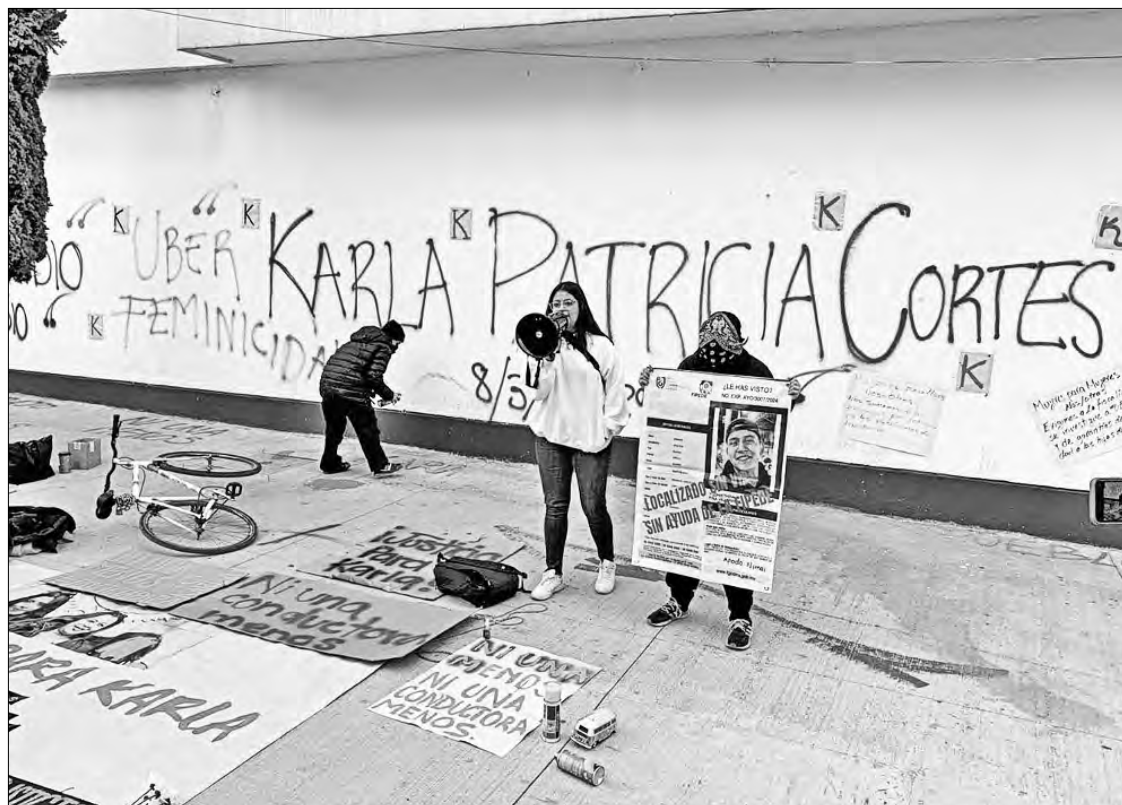
▲ Los manifestantes cerraron la circulación de Doctor Río de la Loza, donde demandaron mejorar