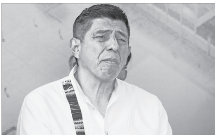
▲ El morenista Salomón Jara Cruz, gobernador de Oaxaca, en imagen de archivo.

Tras la presentación de las cifras por el fiscal general, Consortio Oaxaca consideró grave que se incluyan homicidios dolosos y feminicidios y se traten sólo como asesinatos con tal de hacer un golpeo político,