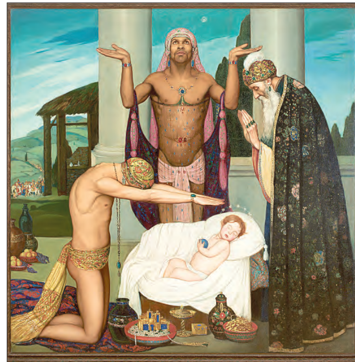
▲ El óleo Los Reyes Magos, del duranguense Ángel Zárraga (1886-1946), invita a hacer una reinterpretación de esta milenaria festividad. Expuesto en el Museo Nacional de Arte (Munal), el cuadro, pintado en 1910, es una visión heterodoxa del mito cristiano, ejemplo de ello es la parte inferior del cuadro, donde se observan recipientes con diseños artesanales michoacanos que contienen oro, incienso y mirra. Zárraga fue alumno de la Academia de San Carlos, donde estudió bajo la tutela de José María Velasco, Santiago Rebull y Julio Ruelas.