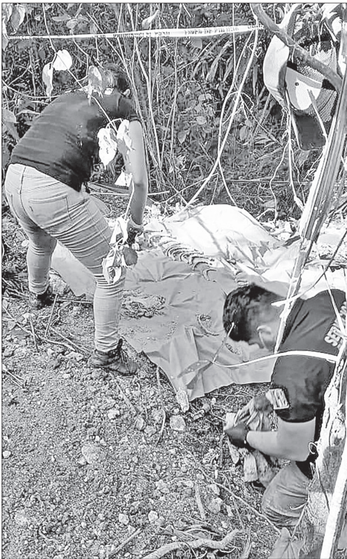
▲ Trabajos de exhumación de los restos de dos personas en una fosa clandestina en el municipio de Palenque, Chiapas; en Concordia han sido halladas 29 osamentas.

A finales de junio y principios de julio fueron hallados 19 cadáveres en la caja de un camión de volteo y en noviembre los cuerpos de cinco personas a la orilla de una carretera.