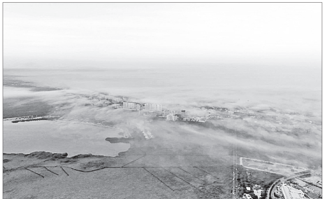
▲ Un escurrimiento de aire frío e interacción con la humedad del Caribe occidental provocó densos bancos de niebla que cubrieron las ciudades de

Pidió además evitar llevar sobrepeso a bordo de automotores “fundamentalmente en caminos convencionales o carreteras de nuestro estado, recuerda que hay vehículos pesados”.