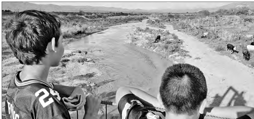
▲ Dos niños observan el paso del contaminado río Sonora, en Cananea.

X: @cafevega Correo: cfvmexico_sa@hotmail.com