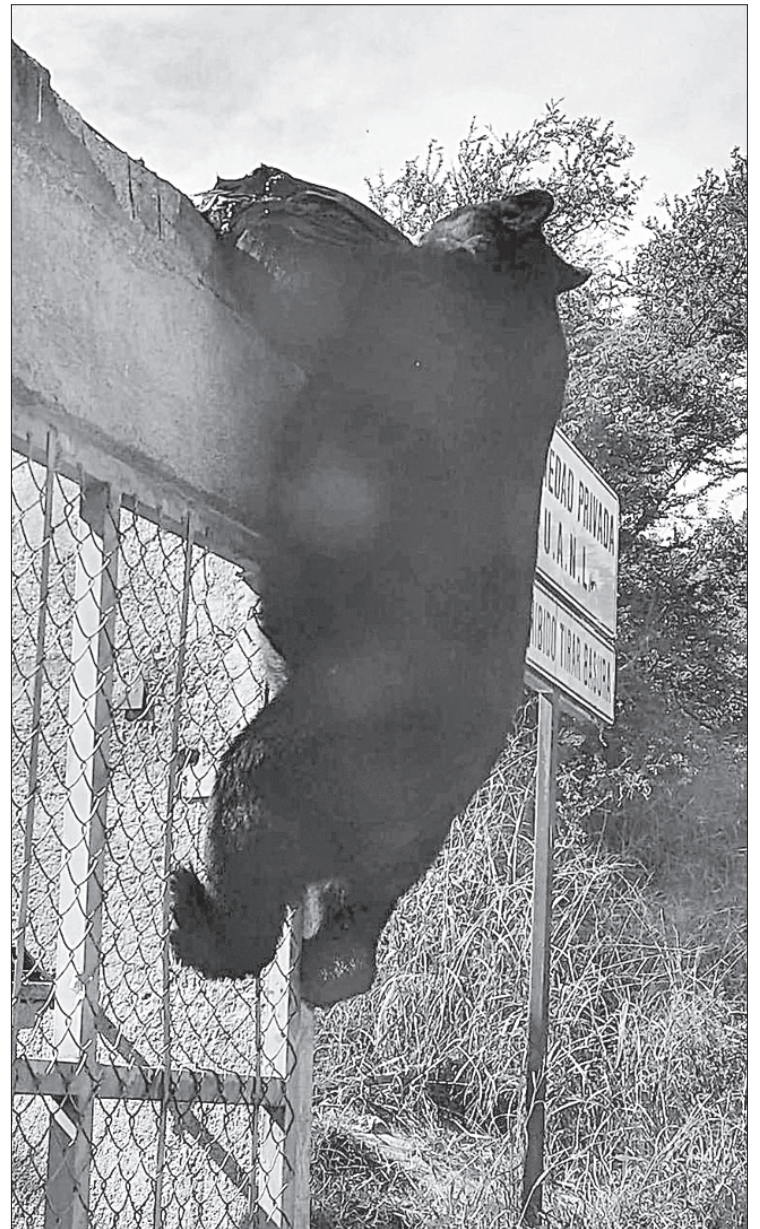
▲ En las instalaciones de la Facultad de Ciencias de la Comunicación, en el campus de la Universidad Autónoma de Nuevo León, ubicado en el sur de Monterrey, es frecuente ver que descienden de las zonas montañosas.

“La pérdida de áreas verdes, el desplazamiento de especies—como el avistamiento de osos— y la crisis hídrica son consecuencias que no pueden ignorarse. Existe la preocupación, pero falta mucha información. Ahí es donde el estado está quedando a deber.