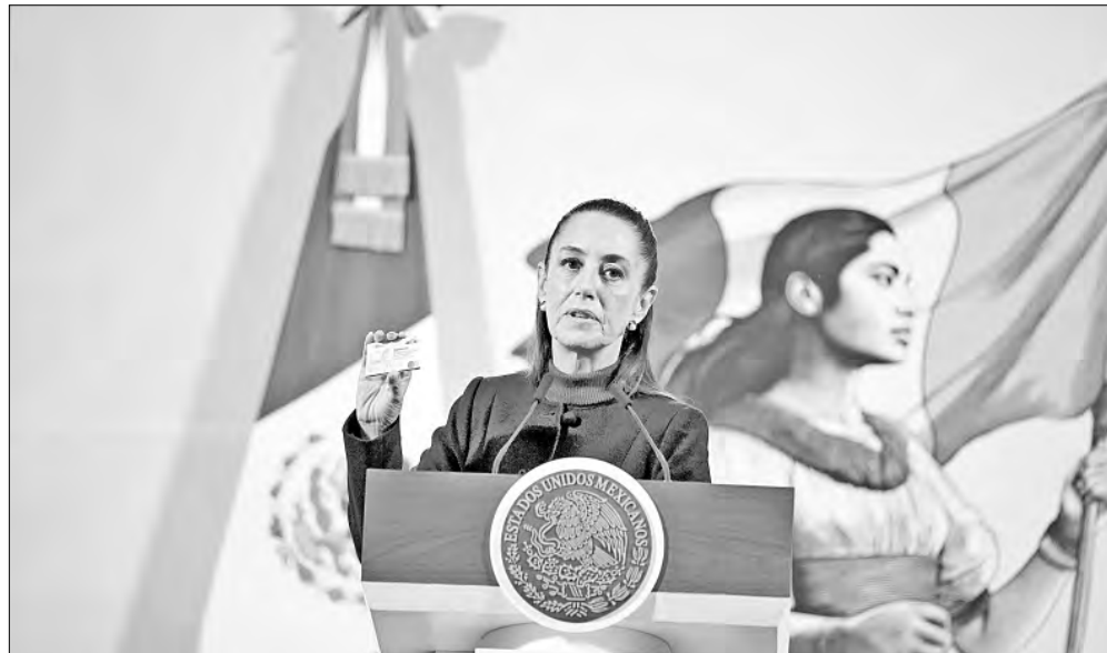
▲ La presidenta Claudia Sheinbaum mostró en la conferencia de prensa la nueva tarjeta

Facebook, TikTok, Twitter: galvanochoa Correo: galvanochoa@gmail.com