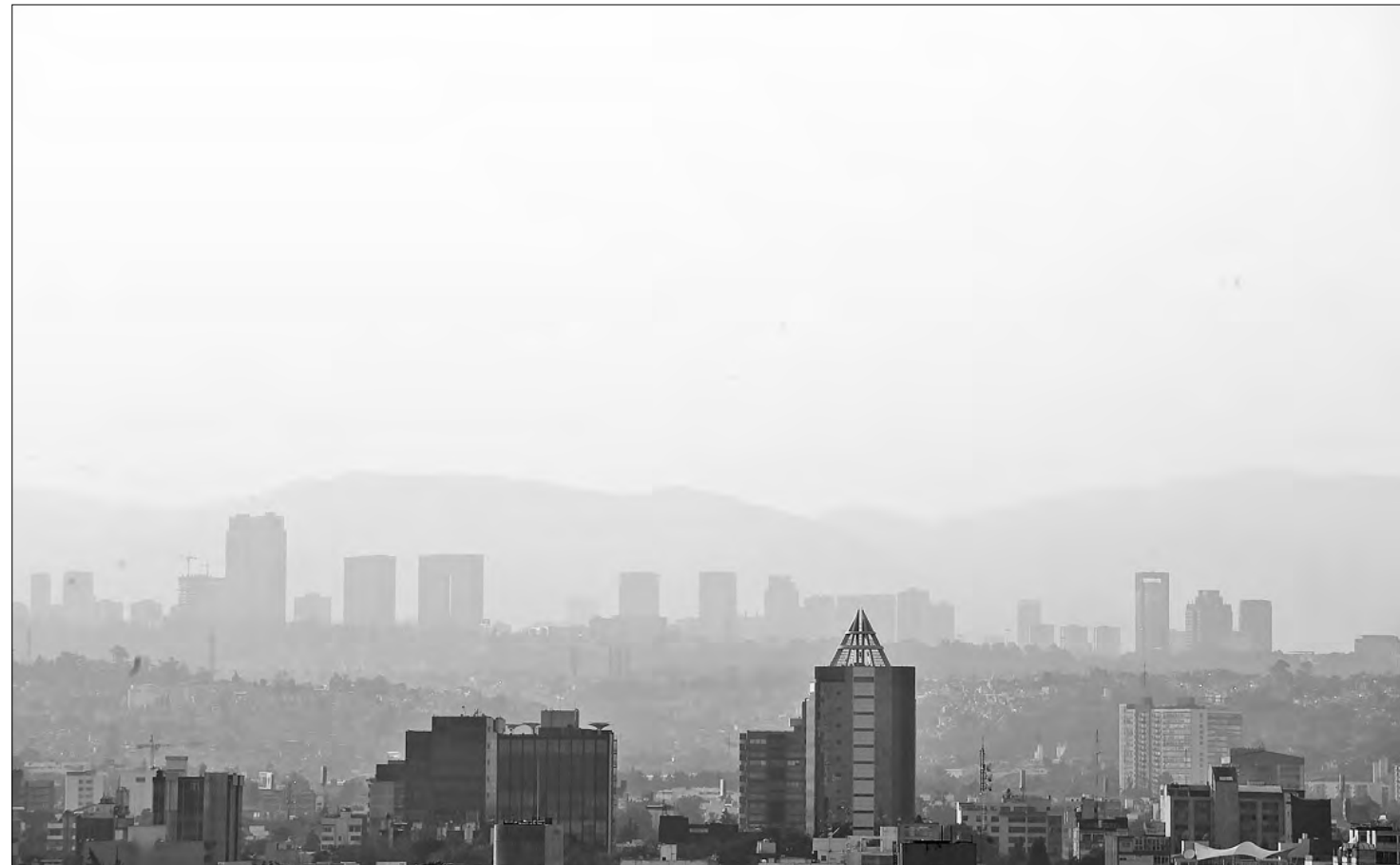
▲ Gris atardecer en la Ciudad de México, a horas de que termine 2024.