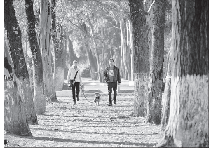
▲ La Ciudad de México también es gozada por sus zonas verdes, que proporcionan un alivio momentáneo al "mundanal ruido".