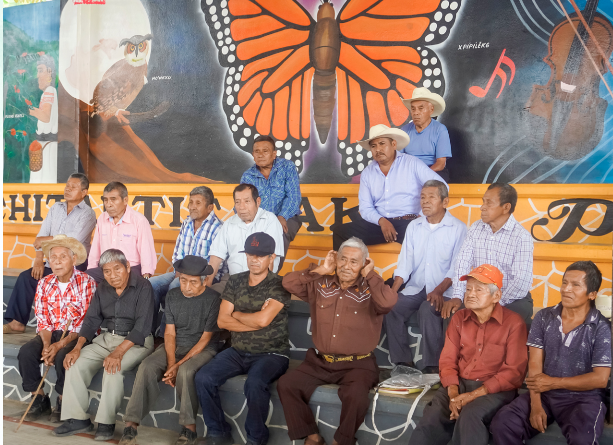
Integrantes del Consejo de Ancianos de Papaloctipan, 2024.