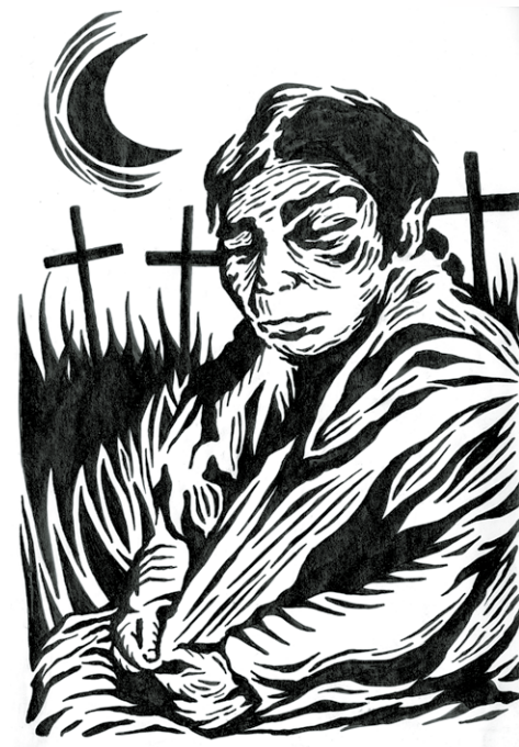
Dibujo a tinta de Arath Monter

¿Cómo haré cuando en la calma sepa que al fin he podido iniciar mi cometido de desbaratarme el alma? Cuando explote como palma al nacimiento de un verso, ¿cómo haré, cuando el disperso sentimiento abandonado sepa que al fin ha encontrado la verdad del universo?