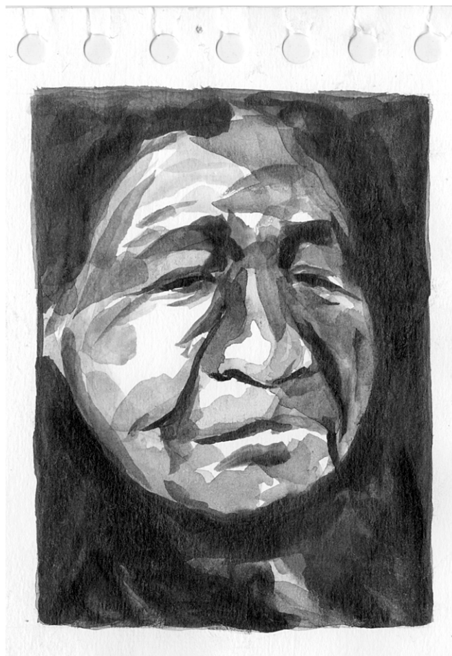
Dibujo a tinta de Arath Monter

Ahora bien, los distintos ámbitos de comunalidad, como los denominara Gustavo Esteva, presentan dimensiones históricas diferenciadas, la mayoría de las veces difíciles de comprender por los antropólogos y/o sociólogos que se han aventurado a disertar en torno a la comunalidad estrictamente desde sus expresiones comunitarias. Esto fue perceptible en el caso mexicano en los debates sobre la autonomía regional versus autonomía comunitaria que en su momento el Estado debería reconocer en su relación y reconocimiento de los derechos de los pueblos indios. Un debate que al parecer no vendría más al caso dadas las pretensiones