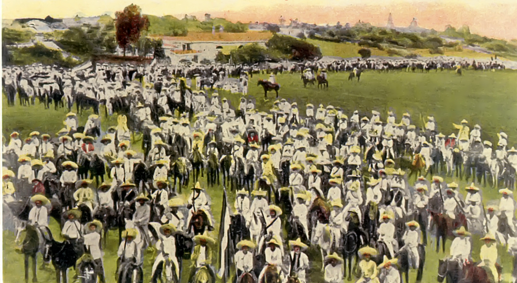
El coronel Zapata (rebelde) y su partida de seguidores. Postal de la época