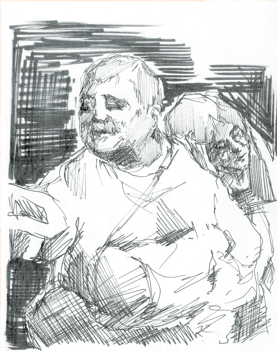
Dibujo a tinta de Arath Monter

Adentro de la choza, atizó los rescoldos que, en la chimenea, aún guardaban suficiente calor desde la noche anterior; se sirvió café caliente en un jarrito y a grandes sorbos se lo terminó al mismo tiempo que daba unos mordiscos al pan de elote que estaba sobre la mesita de madera; luego se dirigió hacia la puerta del jacal para iniciar la jornada, tomó su sombrero de palma, guardó en su morral los bastimentos, agarró su bastón de madera de barreta, se anudó el paliacate sobre el cuello y cerró la puerta tras de sí.