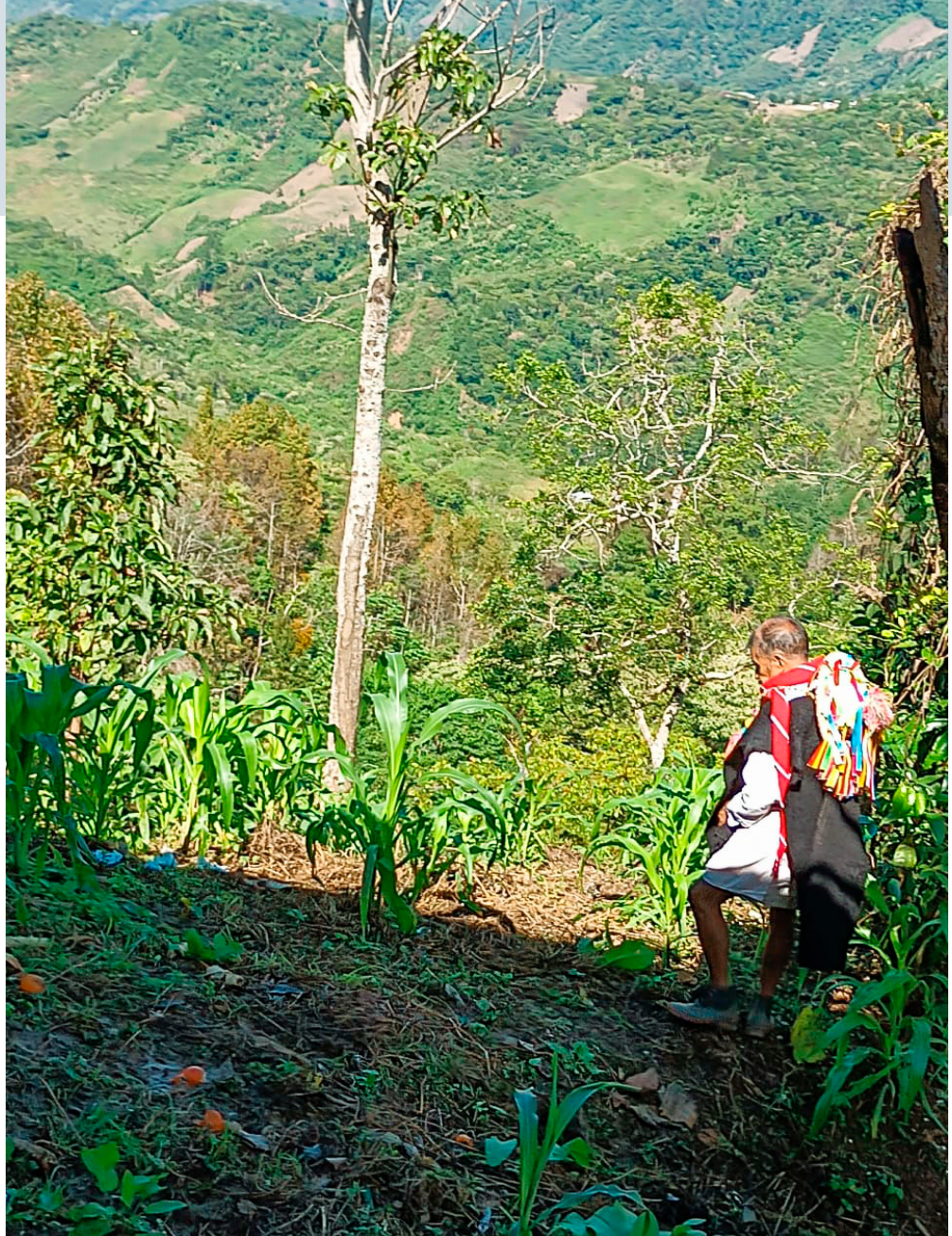
En las laderas de Acteal, Chiapas.

autonomía energética, en la salud, partería y medicina tradicional, en la alimentación, en la educación, en el acceso al agua y en la comunicación.