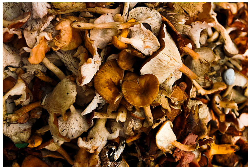
Feria del Hongo, Cuajimalpa, CDMX, 2024.