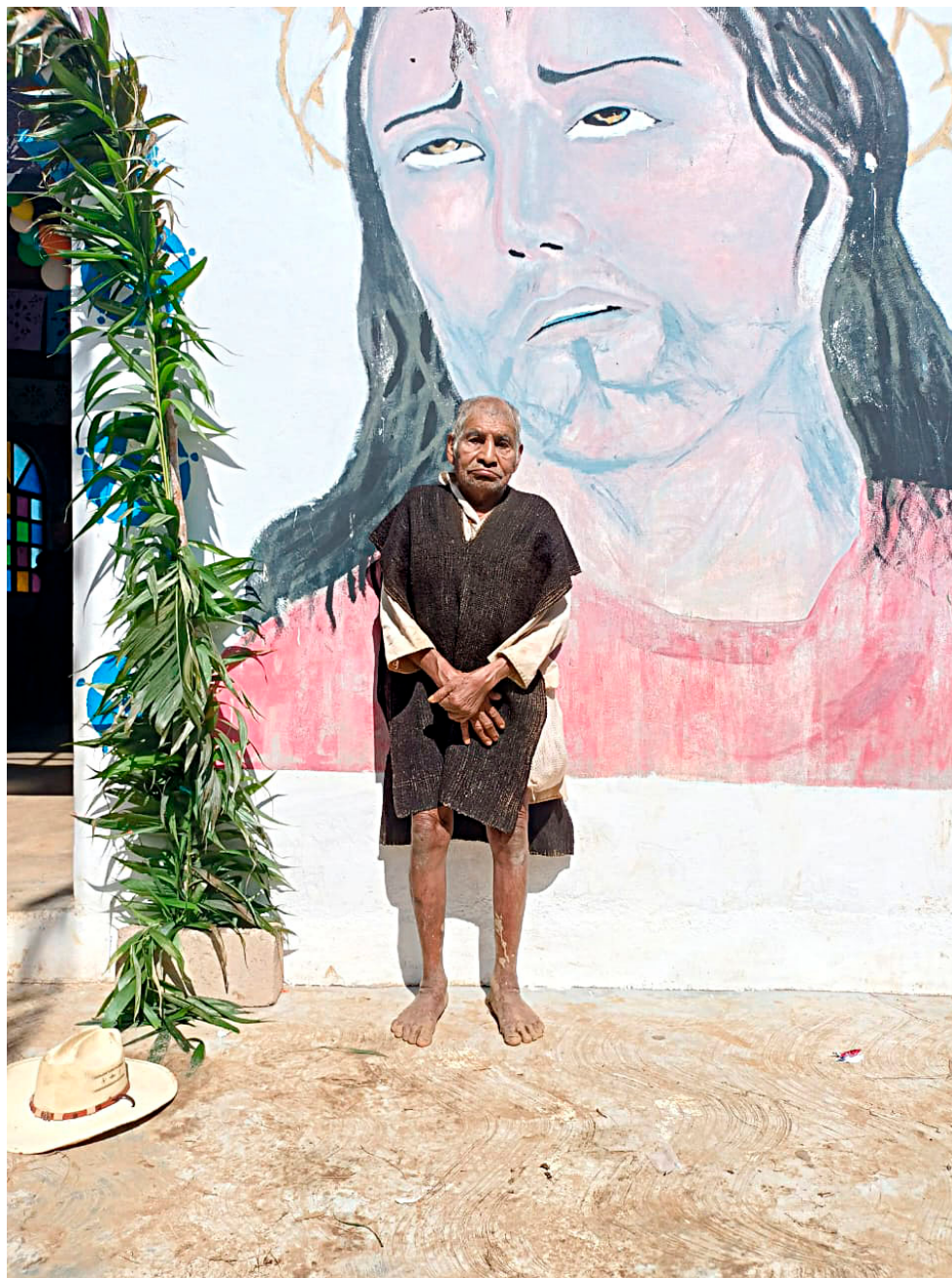
Hombre tsotsil en Acteal, Chiapas.

“Hemos visto la necesidad de padres tseltales casados para la administración de los sacramentos que sólo los sacerdotes ordenados lo pueden dar. Nuestro corazón nos dice que sería uno de los caminos para el fortalecimiento de nuestra Iglesia autóctona”, escribieron en una carta 24 parejas de diáconos indígenas al entonces papa Juan Pablo II en 1993 a través de la misión jesuita de Bachajón (De Vos, 2010). Como un espejo del proceso tseltal y que aunque para la misión dominica en la región tsotsil de Los Altos, el diaconado (inaugurado con un “prediácono” desde 1985 en Chavajeval entre tsotsiles) no implicaba lograr el paso siguiente al sacerdocio casado para los servidores tsotsiles, el anhelo de alcanzar ese ministerio con el apoyo y acompañamiento de las mujeres simbolizaba también la culminación para completar exitosamente el proceso de la Iglesia autóctona. Los sacerdotes indígenas