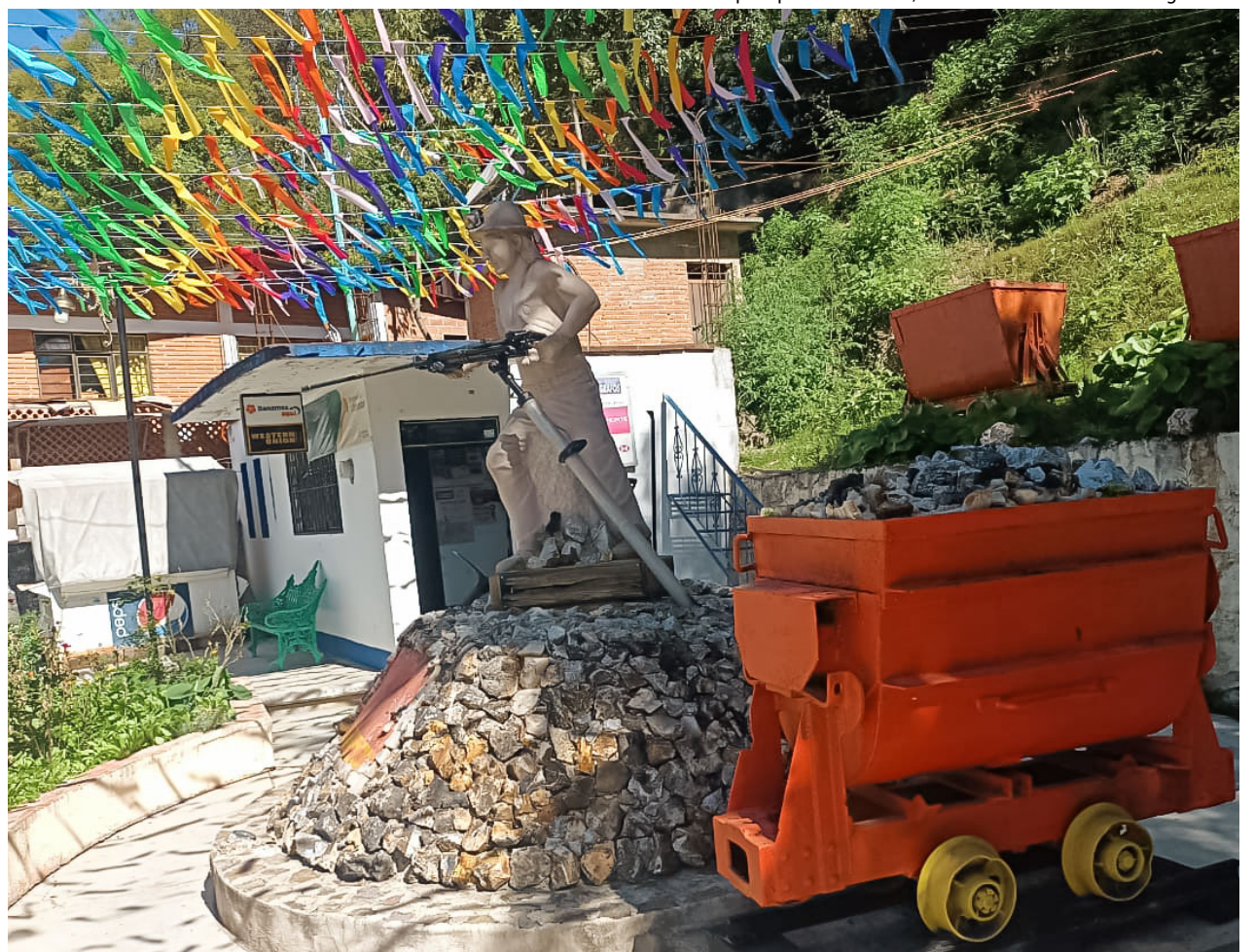
Monumento a la minería en Calpulálpam de Méndez, Oaxaca.

Y continúa la carta insistiendo en que si Calpulálpam se ha visto obligada a realizar acciones directas como el decomiso de unidades de transporte que circulan con mineral extraído de manera clandestina, eso no es lo mismo que lo que alega la minera cuando “de manera apócrifa se está denunciando a los habitantes de Capulálpam de un intento de secuestro del gerente de la empresa minera, lo cual es un intento más de criminalizar a los defensores del territorio, como se ha hecho en otros lugares de Oaxaca para frenar sus luchas. ¿Dónde está la aplicación del acuerdo de Escazú para estos casos?”, dice la comunidad y las organizaciones que la defienden. “Sabemos que la comunidad de Capulálpam ha actuado siempre de manera pacífica y lo seguirá haciendo, por tal razón no podemos quedar callados cuando se les imputan falsos delitos a sus habitantes con la finalidad de criminalizarlos. Exigimos a las autoridades de los gobiernos federal y estatal a intervenir en lo que corresponde a sus atribuciones protegiendo a los defensores de Capulálpam como se establece en el Acuerdo de Escazú y con pleno respeto a sus derechos como comunidad indígena y como comunidad agraria” ■