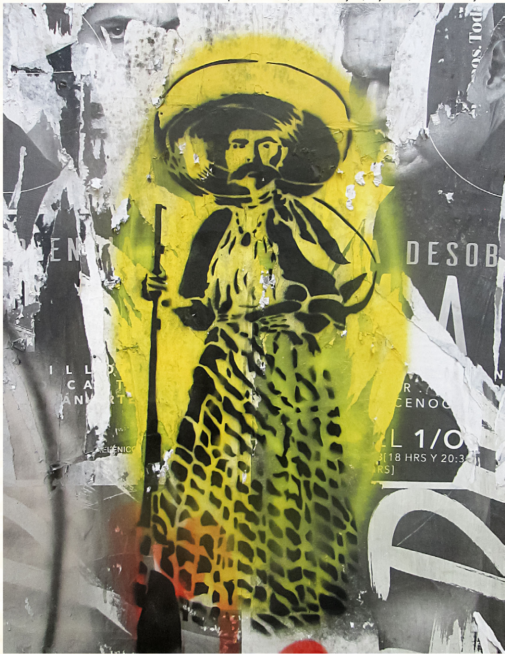
Emiliano Zapata con falda, estencil callejero, Coyoacán, CDMX.

3. Desde el siglo XVI hasta el XIX se habla de la lengua “mexicana”. El término “náhuatl” fue creado por los criollos que, al apropiarse del término “mexicano” para definir la nacionalidad, consideraron inaudita la idea de utilizar, también, el “mexicano” como lengua nacional. Mexicanos sí, pero hispanófonos. Así se generó la idea de las tribus nahuas y el “náhuatl” para reemplazar al mexicano que, además, se convirtió de lengua en “dialecto”. Hablar de la “lengua mexicana” como la lengua franca que se hablaba en el México prehispánico (y que hoy hablan cerca de 4 millones de habitantes) entra dentro de las acepciones aceptadas y tiene, como señalan Jane H. Hill y Kenneth C. Hill, “prioridad en la tradición gramatical” ( Speaking Mexicano 1986, 91).