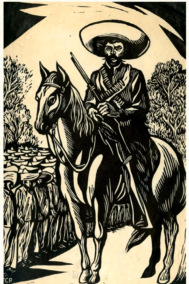
Emiliano Zapata, grabado, 1940. Fernando Castro Pacheco

lación y traducción de Fernando Horcasitas. Nota preliminar de Miguel León Portilla. Dibujos de Alberto Beltrán. México: UNAM. Instituto de Investigaciones Históricas, 1968.