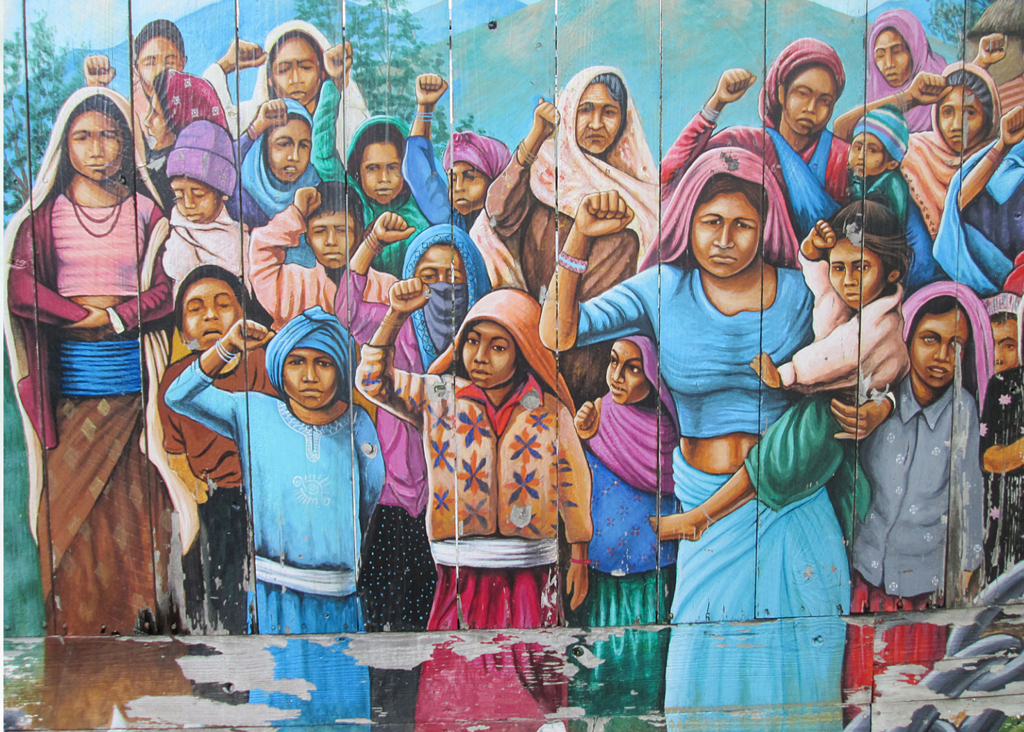
Indígenas guatemaltecas con el puño en alto, mural callejero, San Francisco, California.