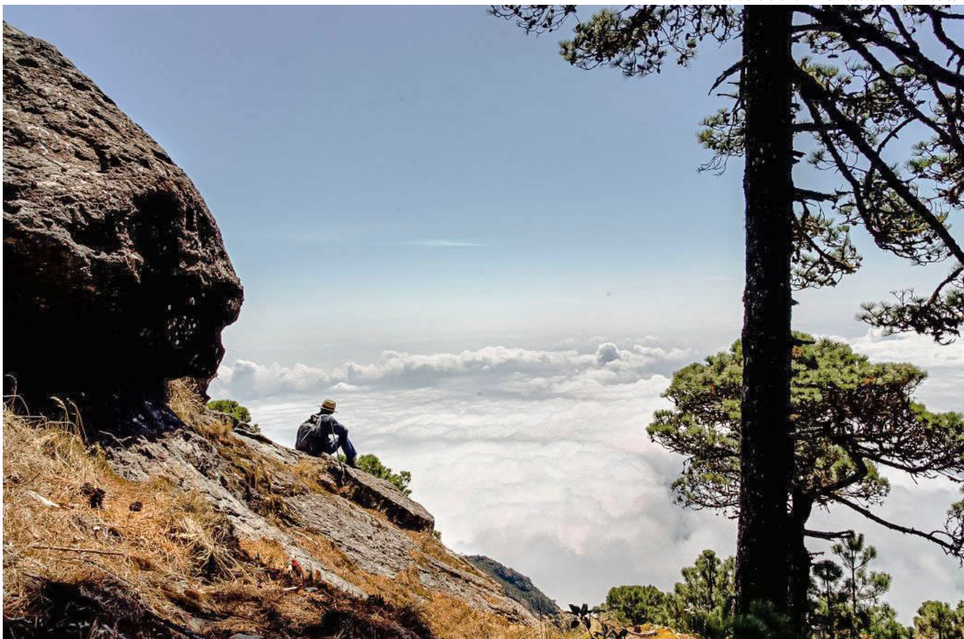
Panorámica de la Sierra Mixe.