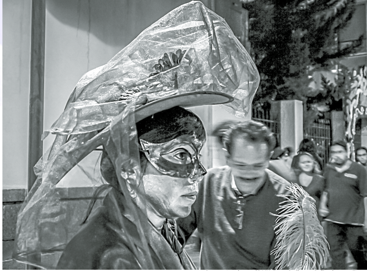
Personaje urbano, CDMX.