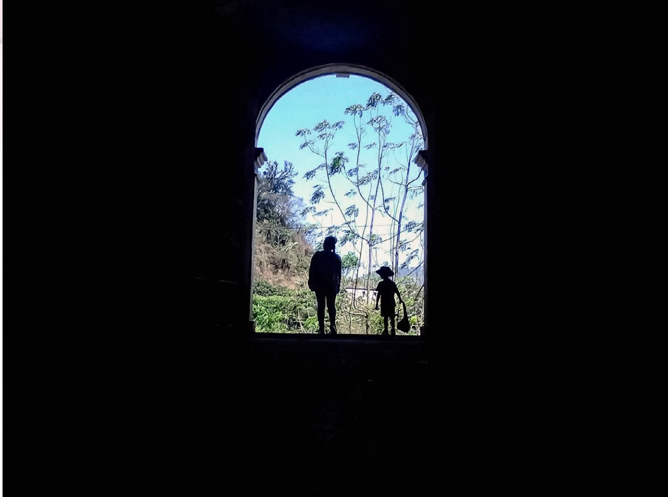
Madre e hijo, Sierra Mixe, Oaxaca.