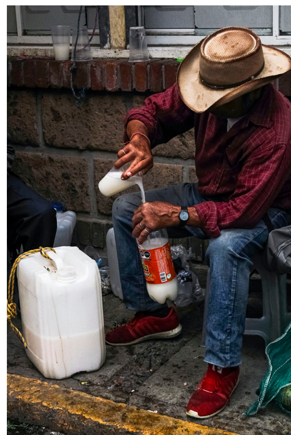
Vendedor de pulque, Jiquipilco, Estado de México.

Ver también "Arriba el pulque", Ojarasca 256, agosto 2018. Leído en la Primer FERIA del Hongo y el Pulque, Santa Cruz Ayotuxco, Huixquilucan, Edomex.