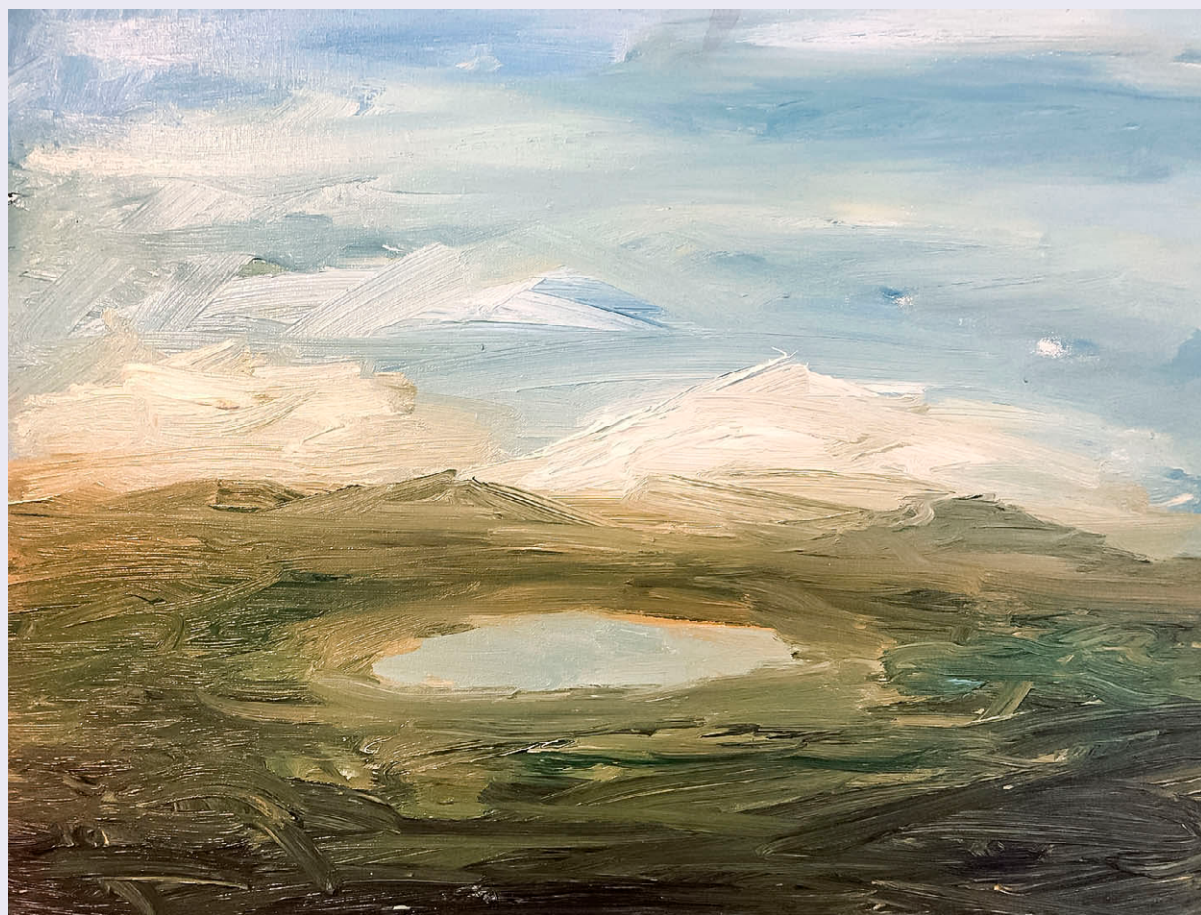
El Valle de México en el año 3043. Óleo sobre tela de Antonio Ortiz, Gritón

existir resisten, que personas de todas las edades en todas las latitudes hagan del No consciente una afirmación para la vida y salgan a decir ¡basta! Como siempre lo han hecho, así pasen los años y los ciclos ■