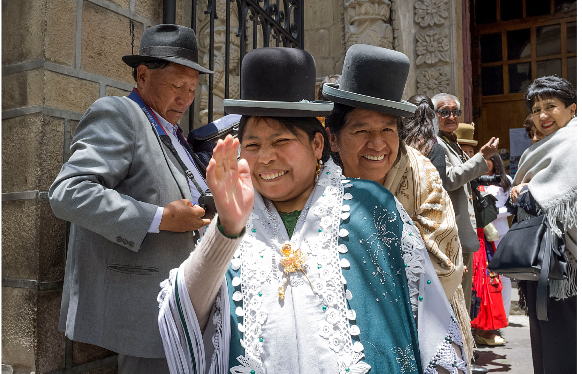
El Alto, Bolivia.