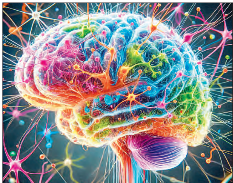
▲ La inteligencia no se concentra en una sola región del cerebro como se conocía hasta ahora, sino en las conexiones de este órgano. Imagen generada por la inteligencia artificial Copilot de Microsoft