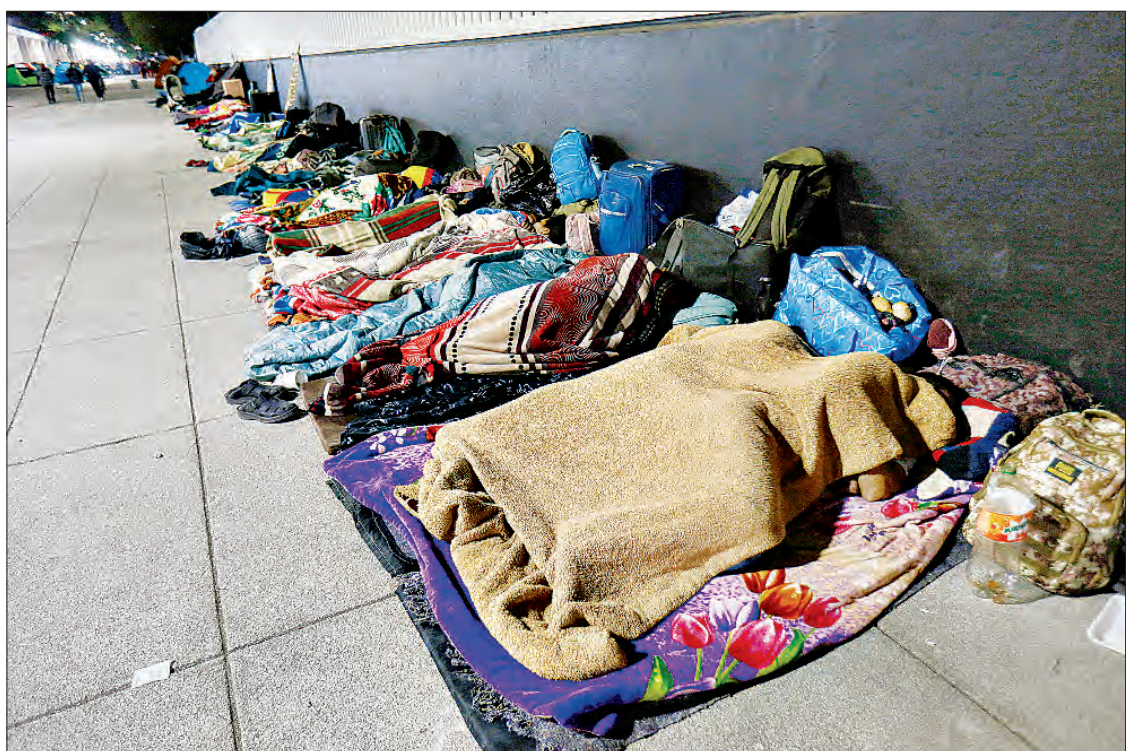
▲ Hay peregrinos que sólo tienen a la Virgen por abrigo y rendidos la abrazan, pero la mayoría cuentan con tiendas de campaña, cobijas y materiales diversos, como espuma de embalaje o cajas de cartón. Hay millares de cobertores: de tigre o con los escudos de equipos de fútbol; frazadas con motivos de historieta, bolsas de dormir Coleman, colchonetas y colchas de distintos tipos. Son muy comunes las mantas viejas, con diseños cuadrículados. Muchas son pesadas. Duermen en banquetas y algunas jardineras; se recuestan sobre bancas; dormitan sentados o de pie.