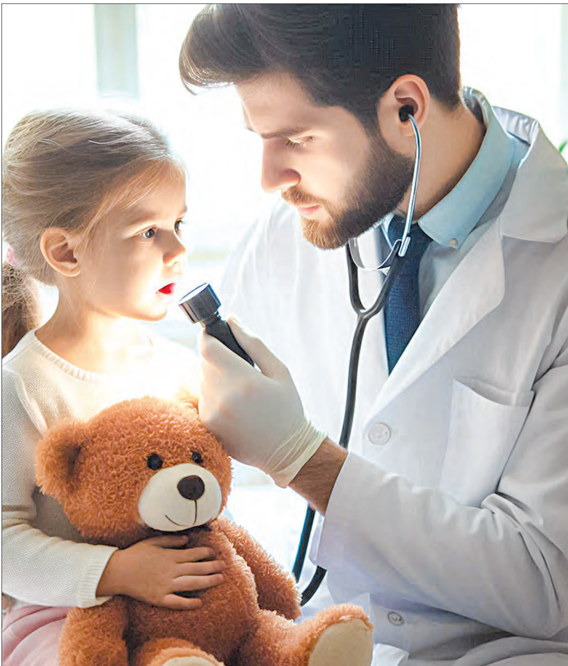
▲ Un estudio de la Universidad Complutense de Madrid demostró que el dolor se percibe más intenso si un médico advierte a su paciente.

Este estudio pone en valor la utilización de la medición de la dilatación pupilar como herramienta objetiva para evaluar la percepción de la molestia y sus conclusiones pueden ser aplicables en terapia psicológica, donde se pueden ajustar las expectativas de los pacientes para mejorar su experiencia del dolor y su bienestar general, así como en el manejo del dolor en tratamientos de rehabilitación, odontológicos o paliativos, entre otros.