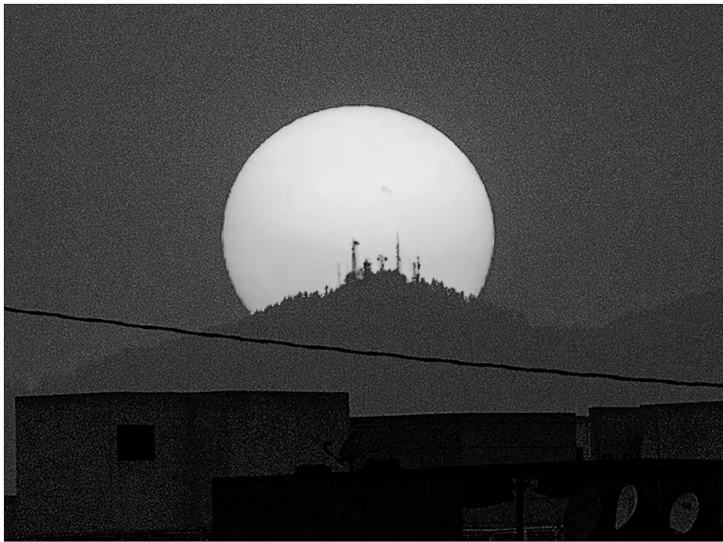
▲ Estampa en la Ciudad de México.