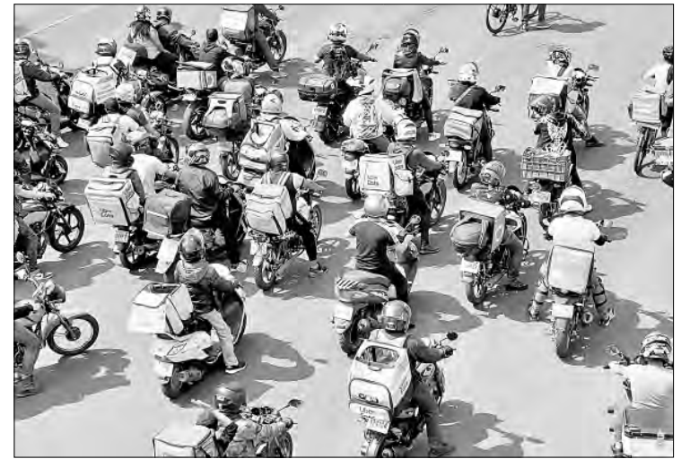
▲ Avalan en comisiones derechos para repartidores por aplicación.

En entrevista, enfatizó que será fundamental la coordinación entre la STPS, el IMSS, el Infonavit y el SAT, ya que después de su publicación en el Diario Oficial , estas instancias tendrán 180 días para