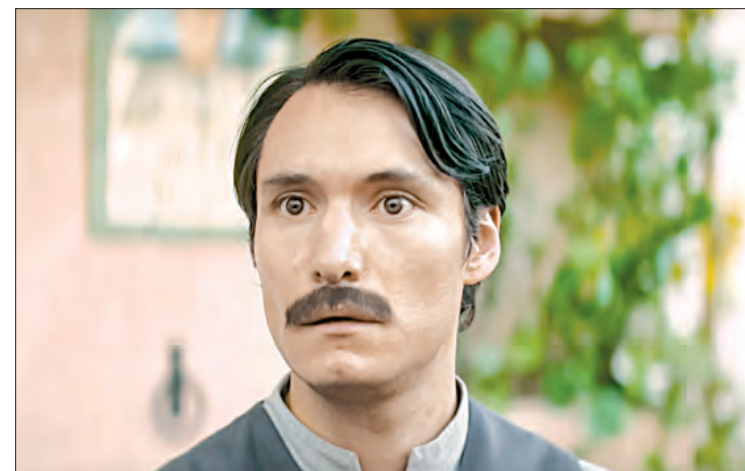
▲◀ Fotogramas de la serie que conforman la primera parte de la adaptación de esta sobresaliente novela

“Creo que ellos (los hijos de García Márquez) han cumplido