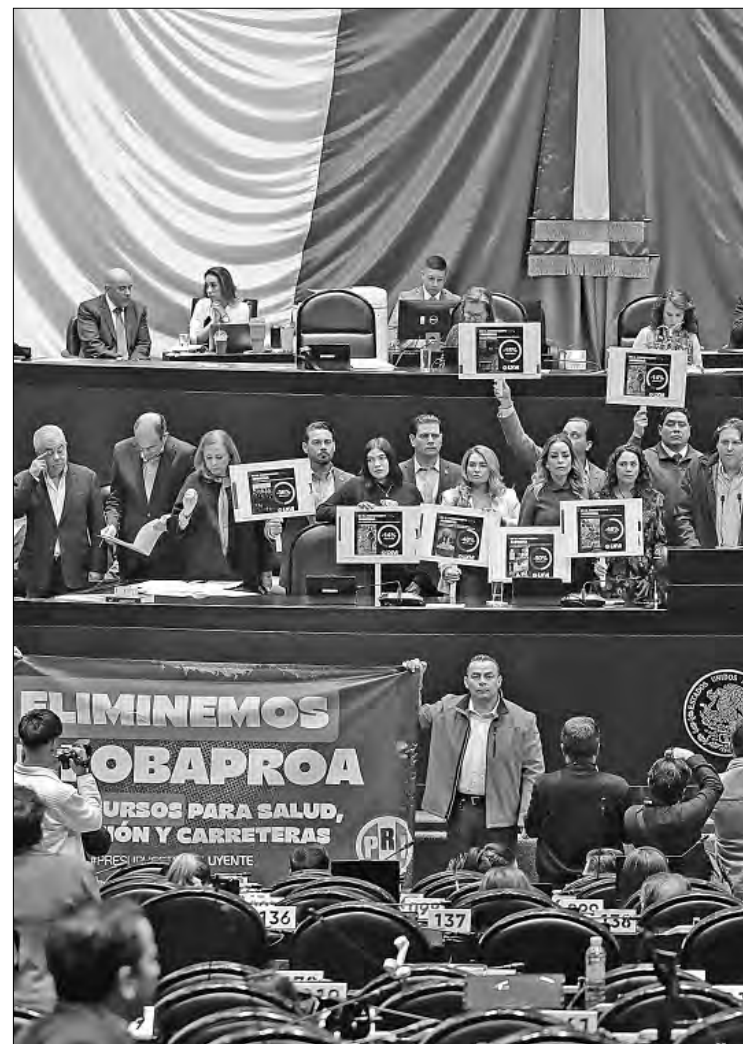
▲ En la sesión, los panistas insistieron en defender su “presupuesto alterno”. El PRI, que en el pasado aprobó el IPAB-Fobaproa, ayer pidió extinguirlo.

Después de la escena, Haces lo paseó por todo el salón para presumir el advenio presupuestal.