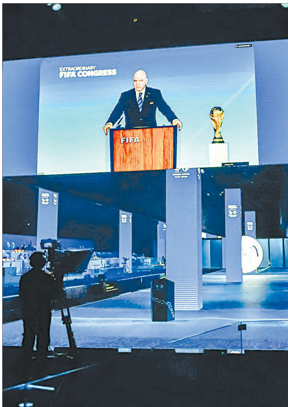
▲ Gianni Infantino, titular de la FIFA, durante el Congreso en línea del organismo para la votación.

Sin embargo, no hubo nada de la sorpresa de 2010, porque esto se vio venir con más de un año de antelación. Cada paso dado durante 14 meses aseguró que sólo hubiera una candidatura posible para 2030 y 2034. Esto ha ocurrido al mismo tiempo que en casi todas las elecciones presidenciales de las confederaciones de fútbol, desde la reforma de la FIFA en 2015, en las que ha