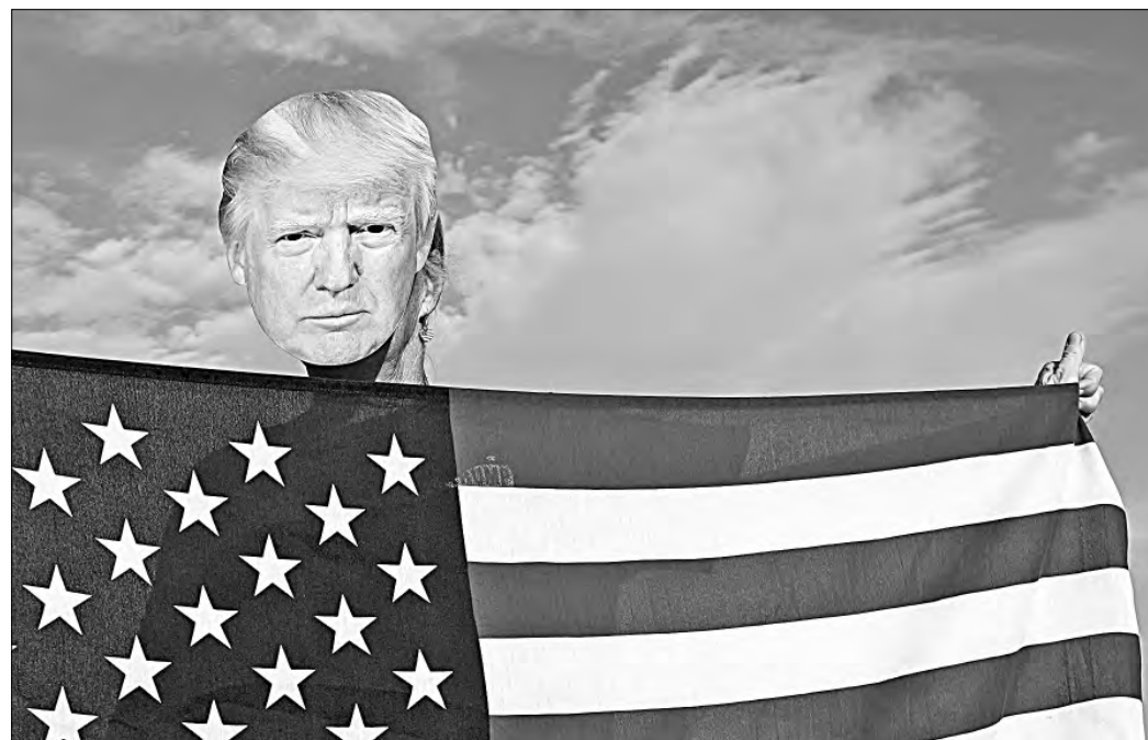
▲ En Palm Beach, Florida, un partidario de Donald Trump con una máscara de éste sostiene una bandera de Estados Unidos al

paso de los automóviles que circulan cerca de Mar-a-Lago, la residencia del empresario.