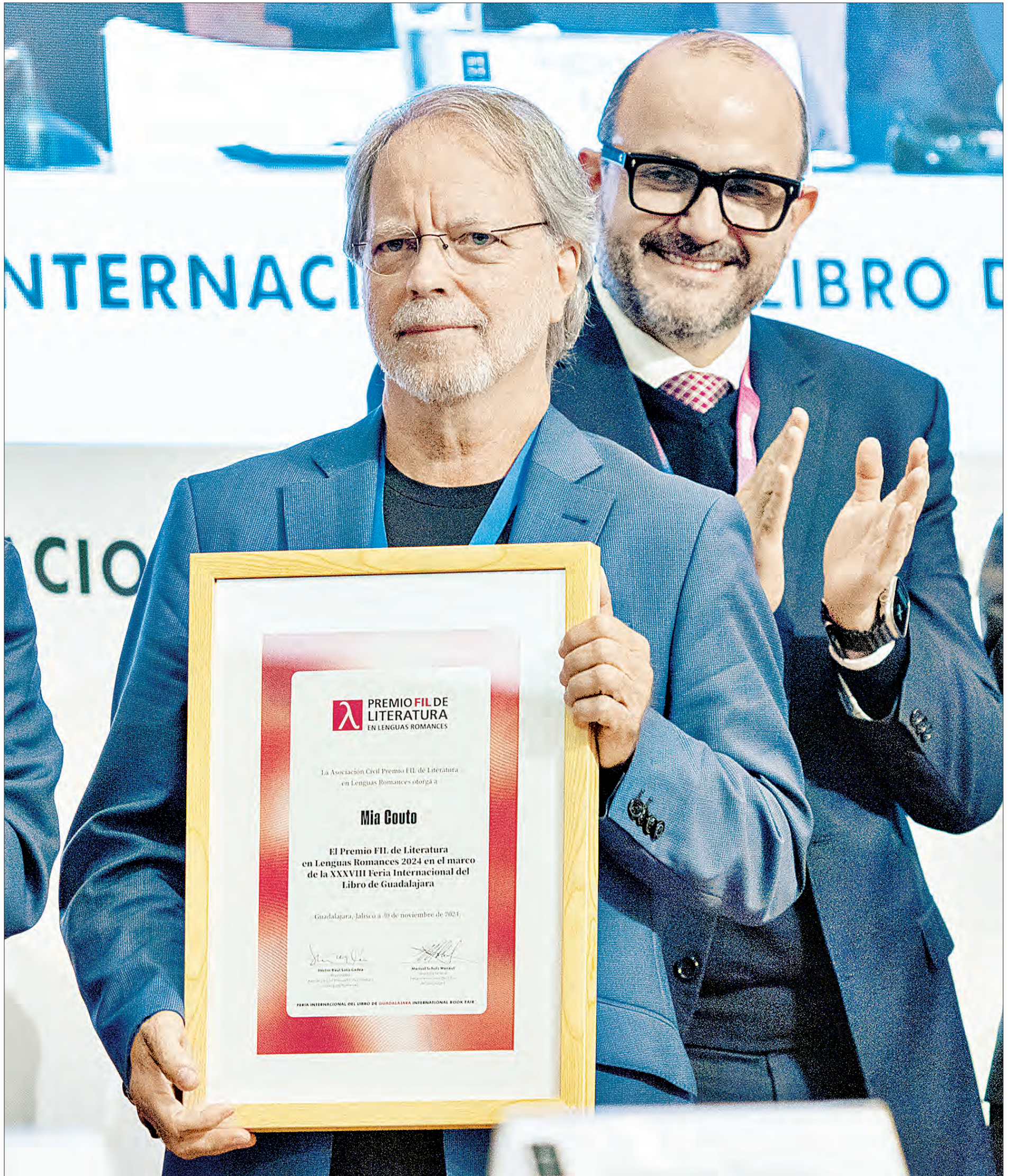
“COMO MUCHOS DE mi generación, soy originario de ese México que me llegó a través de sus libros, sus canciones y su pintura”, dijo el autor mozambiqueño Mia Couto (en la imagen), al recibir el Premio FIL Literatura en Lenguas Romances, durante la