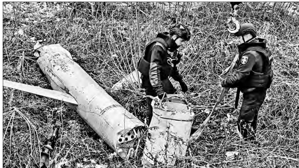
▲ Soldados ucranianos recogen los restos de un misil crucero ruso X-55.

¿EFECTO ORESHNIKO efecto Sarmat/Satán II: En el mismo tenor, The Economist , revista globalista de los banqueros Rothschild, conjetura sobre “el menor mal acuerdo para Ucrania: cómo hacer un éxito de las charlas de paz (¡mega-sic!) con Vladimir Putin” ( https://bit.ly/4fODmoX ).