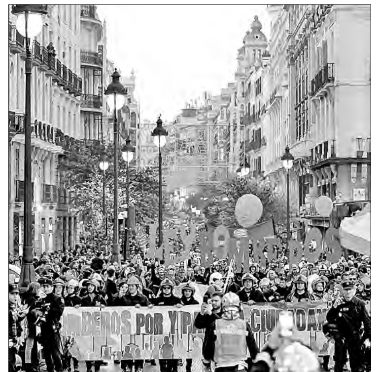
▲ Entre millares de manifestantes en las calles de Valencia, destacó el contingente de bomberos, que denunció los errores de gobierno durante el desastre natural que trajo la DANA.

En este contexto, advirtieron que “la solución, para estos colectivos, no es la inaceptable militarización basada en argumentos técnicos. Mazón no puede encabezar la reconstrucción de lo que se ha destruido por su irresponsabilidad y desidia criminal. Por no haber presionado de manera contundente e inmediata a los responsables del Consell ante su inacción para intervenir con todos los efectivos disponibles”.