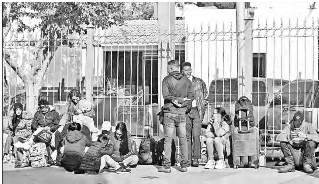
◀ Migrantes que buscan cita para pedir asilo en EU hacen fila cerca del puente internacional Paso del Norte, en Ciudad Juárez, Chihuahua.

En la Ciudad de México hay cuatro campamentos irregulares de migrantes, con al menos 4 mil personas, según estimaciones del gobierno capitalino. La mayoría espera que se les programe una cita CBP One para solicitar asilo en Estados Unidos.