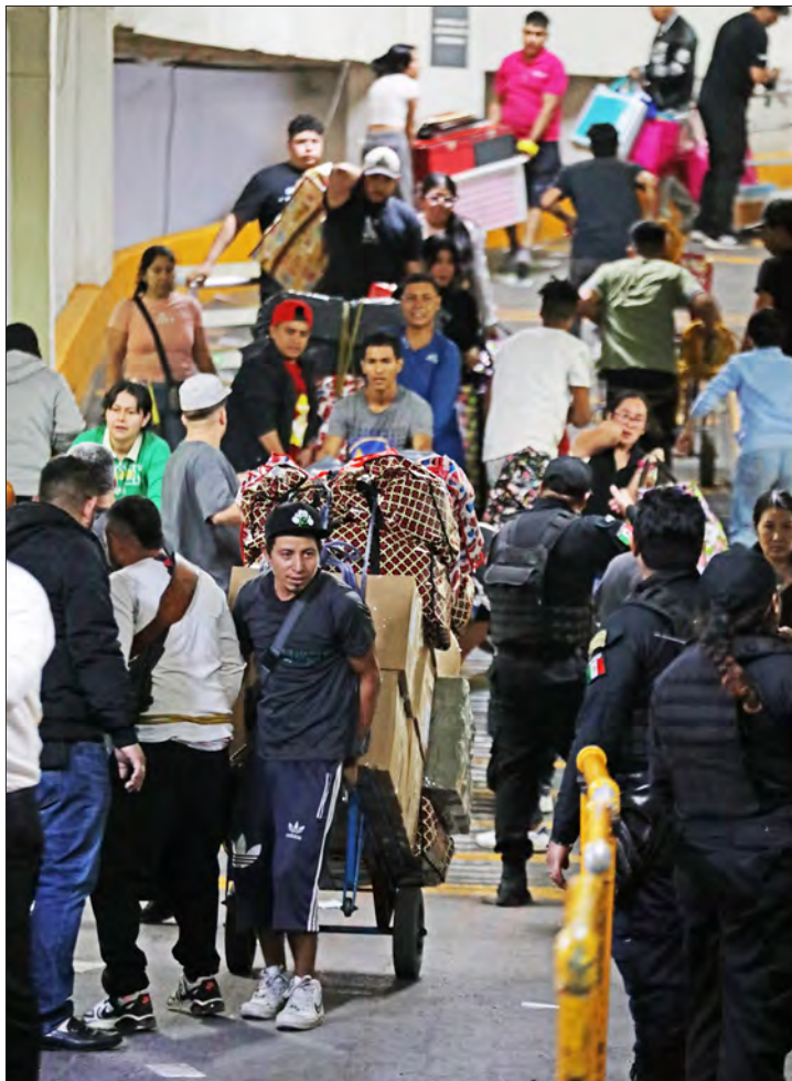
▲ Anoche, a las 12:05 horas, personal del Invea de la Ciudad de México colocó sellos de "suspensión de actividades" en cortinas y accesorias de la plaza México Mart, ubicada