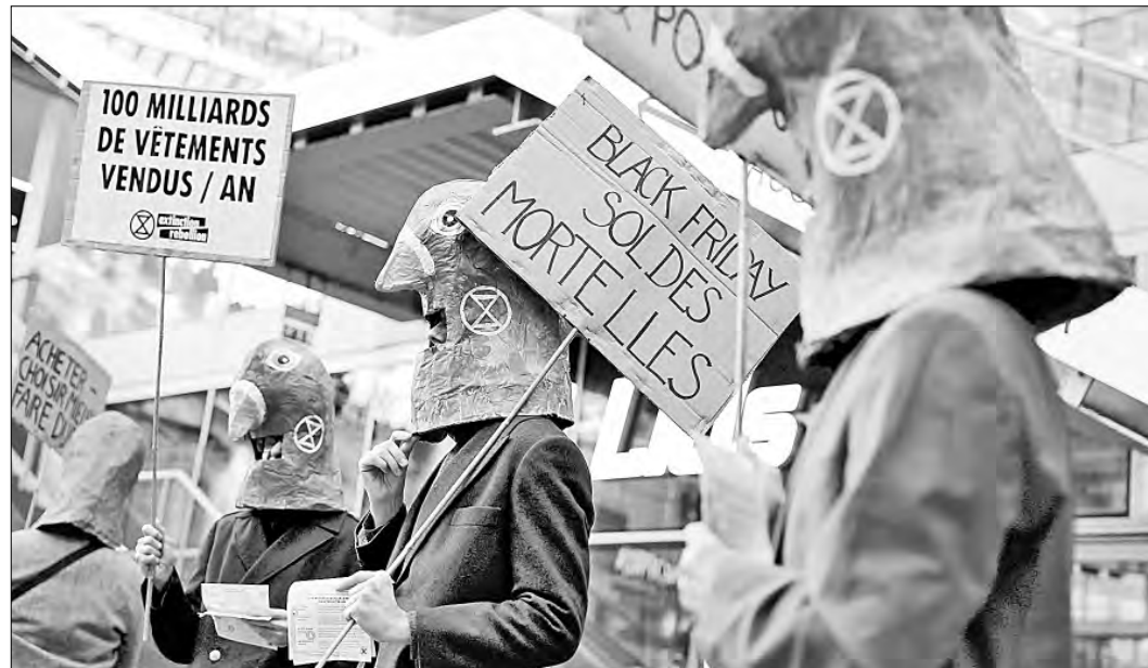
▲ Activistas medioambientales de Extinction Rebellion (XR), disfrazados de palomas, sostienen carteles que dicen "Ventas de muerte del Viernes Negro" y "100 mil millones de

De la Torre de Stéfano resaltó que esta campaña permitió a los pequeños negocios tener una campaña publicitaria para aumentar sus ventas, aunque también buscarán que se incremente el número de negocios que participen en el sorteo que realiza el Servicio de Administración Tributaria.