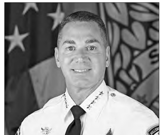
de la derecha, el sheriff Chad Chronister, futuro administrador de la DEA.