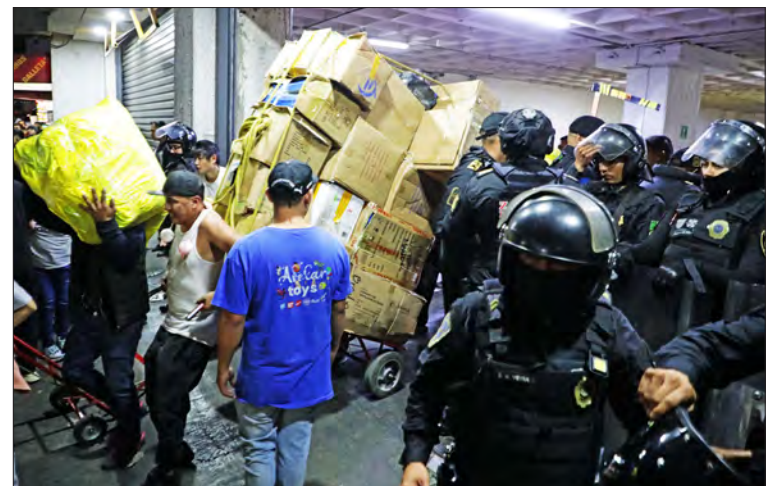
en José María Izazaga 89, por presuntas irregularidades. Entre gritos en chino, español y tsotsil, cientos de personas se apresuraron durante el día a retirar mercancías de origen