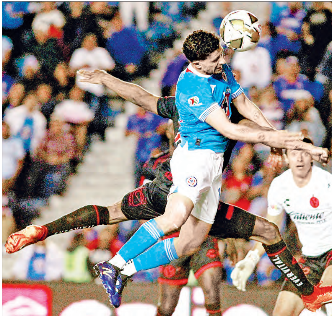
▲ Tras un partido sufrido e intenso, La Máquina ahora se enfrentará a las Águilas.