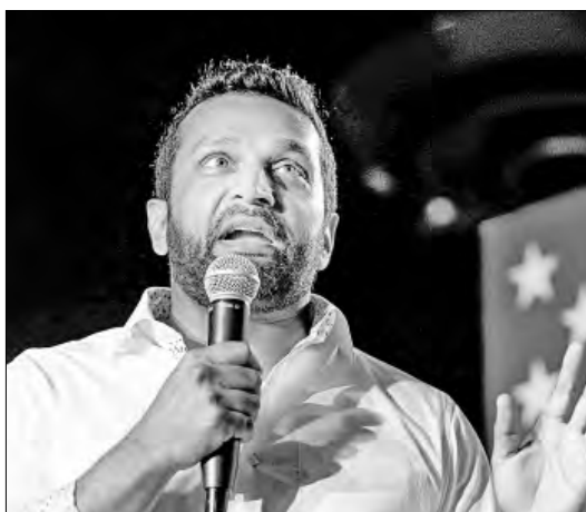
▲ Kash Patel, ex jefe de gabinete de la Secretaría de Defensa, será el director de la FBI. En la imagen

La Ley Libertador Simón Bolívar responde al proyecto de ley aprobado por la Cámara de Representantes de Estados Unidos denominado Prohibición de Operaciones y Arrendamientos con el Régimen Autoritario Venezolano Ilegítimo, cuya sigla en inglés es Bolivar (Banning Operations and Leases with the Illegitimate Venezuelan Authoritarian Regime) y establece vetos a contratos con personas que tengan negocios con el gobierno de Maduro.