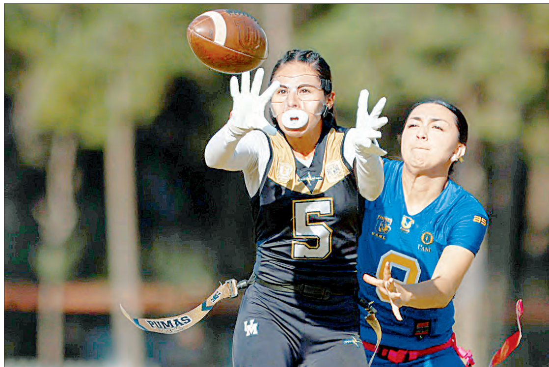
▲ Tras un apretado cierre, el equipo de tochito de la UNAM derrotó 56-41 a las Tigres de la UANL.

El certamen fomenta la formación de estudiantes deportistas para elevar el nivel de la especialidad de cara al arranque del ciclo en los Juegos Centroamericanos y del Caribe 2026, en República Dominicana.