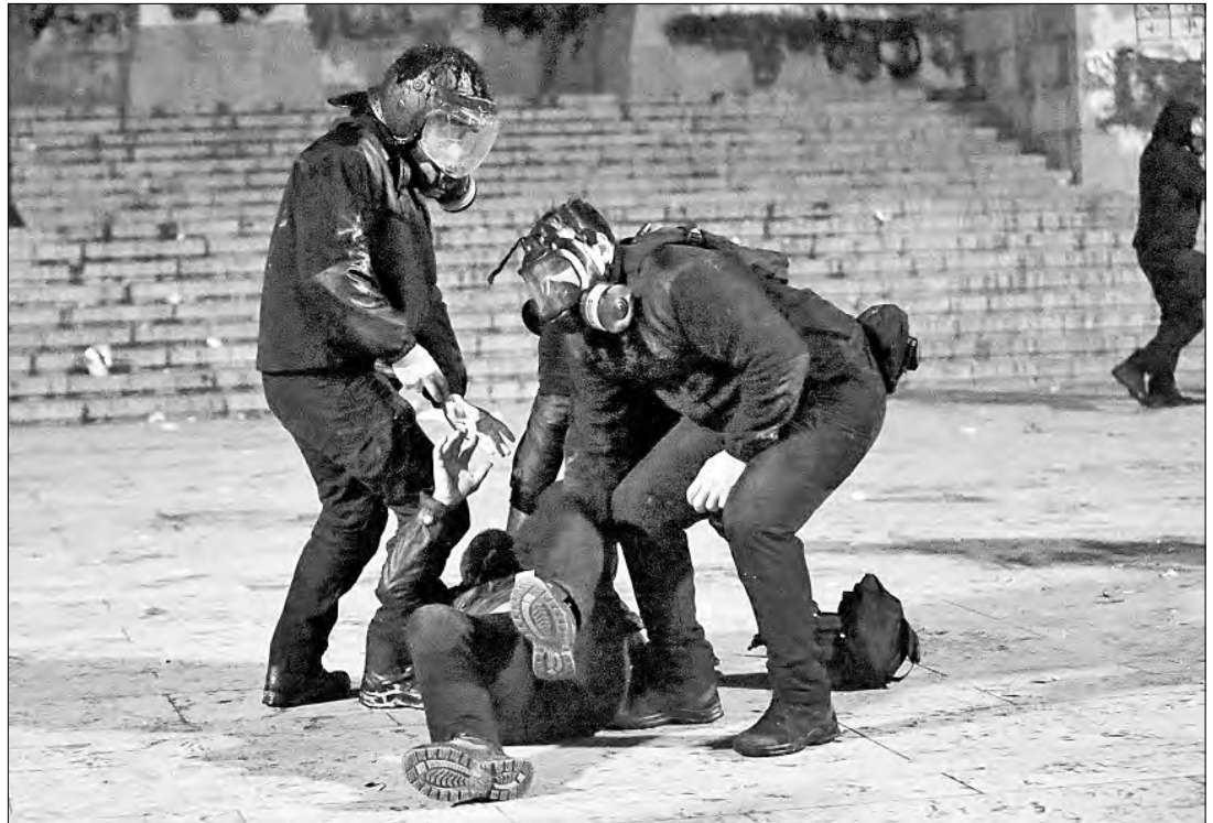
▲ En Tiflis, capital de Georgia, la noche del sábado continuaron los enfrentamientos entre ciudadanos y la policía debido a las protestas contra la decisión del gobierno de aplazar a 2028