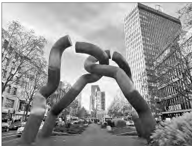
▲ La monumental escultura que representa la conexión entre Berlín del Este y Oeste como una cadena rota. Al fondo, los restos de la Iglesia de la Memoria.