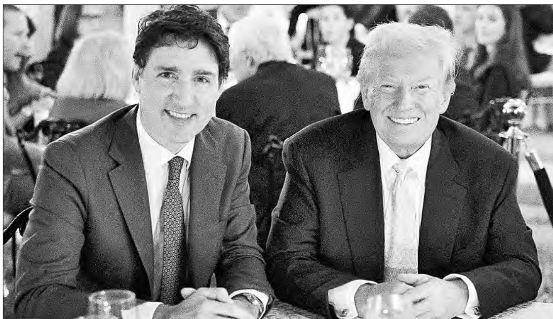
▲ Tras los amagos de Donald Trump de que elevará impuestos a todos los productos de sus socios del

generado un retroceso en su promesa de que, según Canadá, los agrupa injustamente con México en la entrada de drogas y migrantes a la Unión Americana. Los agentes estadounidenses de aduanas incautaron 19 kilogramos de fentanilo en la frontera canadiense el último año fiscal, en comparación con 9 mil 525 kilogramos en la de México. En cuanto a inmigración, la Patrulla Fronteriza realizó 56 mil 530 arrestos en su zona limítrofe del sur sólo en octubre de este año, y 23 mil 721 en la norte entre octubre de