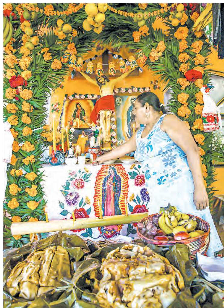
▲ Ofrenda de muertos en la Huasteca, región del país conformada por municipios de San Luis Potosí, Veracruz, Hidalgo, Tamaulipas, Puebla y Querétaro.

Maurice Blanchot citado por Alfredo Valencia, dice: "El sentimiento de angustia no está unido más que accidentalmente a un objeto, y hace surgir precisamente la insignificancia de ese objeto por el cual el hombre se pierde en una muerte sin término y se siente torturado. Se puede morir al imaginar perdido cualquier objeto al que se esté unido y, en ese escalofrío mortal que se experimenta, darse cuenta también de que ese objeto no es nada, no es más que una cosa interminable, una ocasión vacía. Cualquier cosa puede alimentar la angustia, que es ante todo la indiferencia hacia lo que la ha creado, aunque parezca, al mismo tiempo, atar al hombre a la causa por ella elegida".