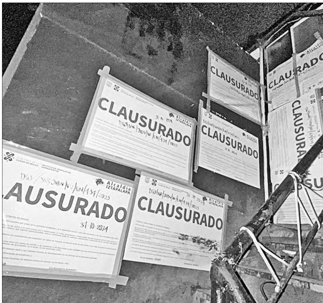
◀ La alcaldía Iztapalapa impuso sellos de clausura en un bar ubicado dentro del Bazar Ermita, ubicado en la calzada Ermita Iztapalapa, donde vendían bebidas alcohólicas adulteradas.

Siete fueron trasladados a un hospital // El antro, ubicado en Iztapalapa, quebrantó sellos de clausura en tres ocasiones