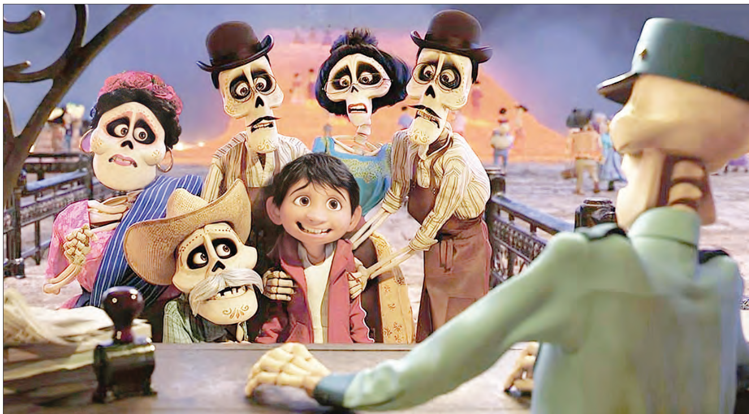
▲ Fotograma de la película Coco de Disney y Pixar

Mictlán se presentará los días primero, 2, 3, 8 y 9 de noviembre en el Foro Cultural Coyoacanense Hugo Argüelles, ubicado en Allende 36, colonia Del Carmen.