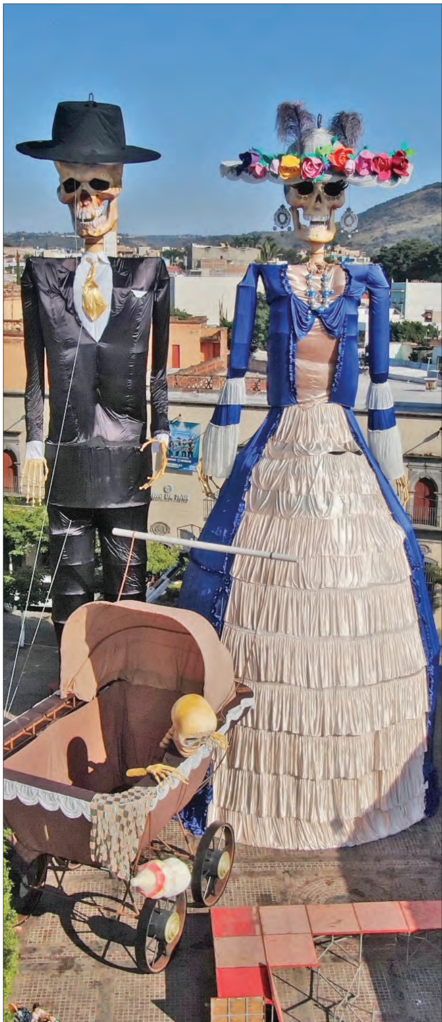
▲ La conmemoración, en todo el país este fin de semana. En la imagen, esculturas monumentales en Zapotlanejo, Jalisco. Foto Arturo Campos C. REDACCIÓN/CULTURA