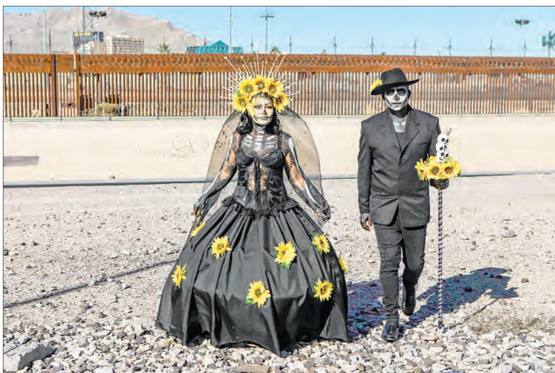
▲ En la imagen superior izquierda, una catrina de 28.15 metros que adorna el malecón de Puerto Vallarta; a la derecha una mujer limpia los restos de su familiar, una tradición de los habitantes de Pomuch, Campeche. Abajo a la izquierda, catrinas monumentales en Zapotlanejo, Jalisco; a la derecha, migrantes en Ciudad Juárez se unen a la celebración.