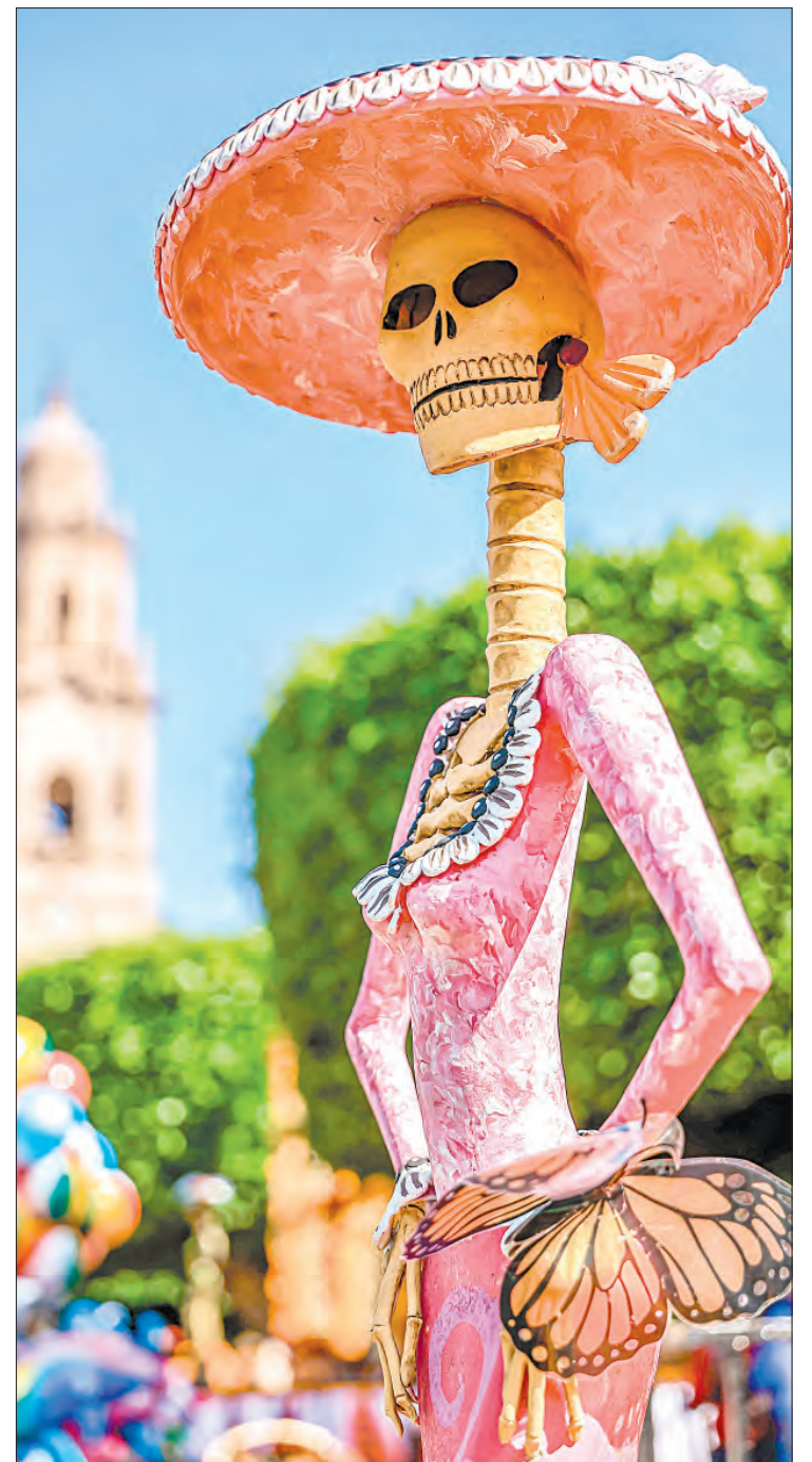
▲ En la imagen superior, una barcaza adornada con flores de cempasúchil en Xochimilco; abajo a la izquierda, un grupo de niños en Tlapa, Guerrero; abajo, un hombre transporta las tradicionales flores en un vocho. A la derecha una catrina gigante en Morelia.