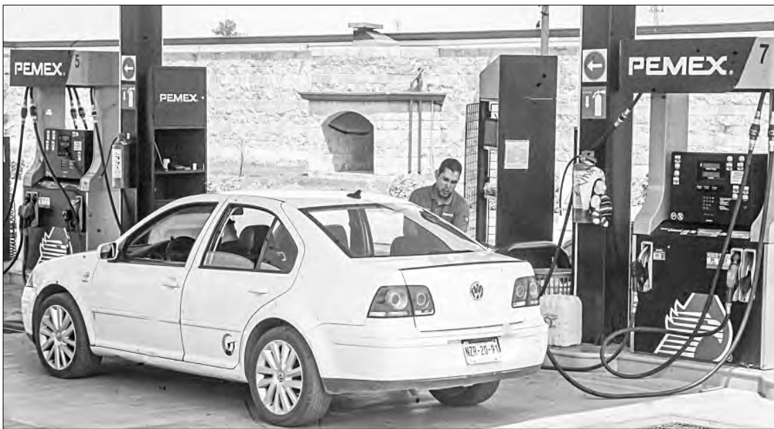
HACIENDA DISMINUYÓ APOYO A GASOLINAS Y DIÉSEL