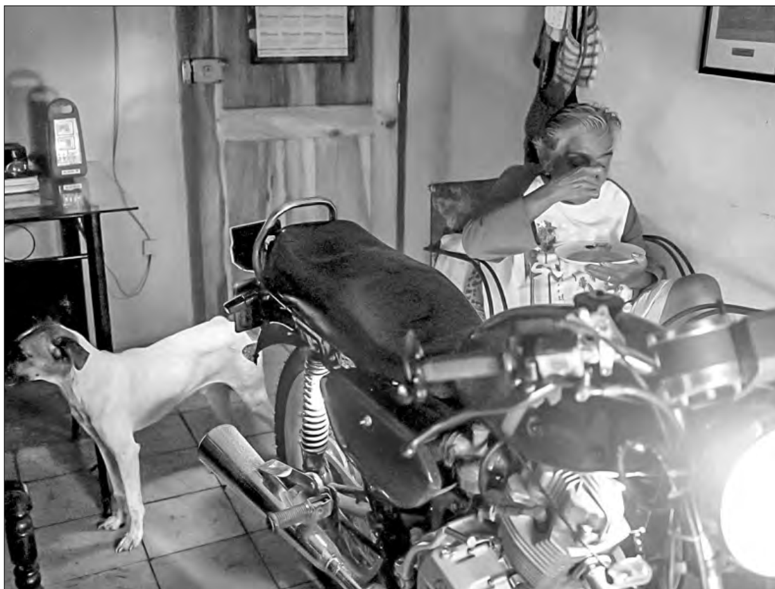
▲ Una mujer come alumbrada por el faro de una moto en su casa en Matanzas, Cuba.

“Tras la salida imprevista de la CTE (Central Termoeléctrica) Antonio Guiterras (...) a las 11 de la