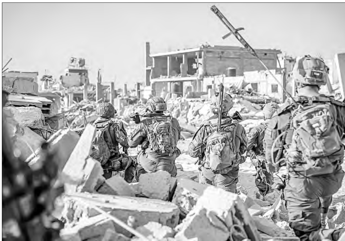
►► El ejército de Israel desplegó ayer más tropas en Gaza. La imagen, en Rafah. A la derecha de estas líneas, parte del video que difundió Tel Aviv con los últimos momentos de vida del líder de Hamas asesinado el jueves.

Hamas calificó a Sinwar de héroe por "no retroceder, blandir su arma, participar y confrontar al ejército de ocupación al frente de sus tropas", mensaje que parecía referirse a un video que hizo circular el ejército israelí sobre los aparentes últimos momentos de Sinwar, en el que se ve a un hombre sentado en un sillón en un edificio, gravemente herido y cubierto de polvo, señaló la agencia informativa Ap; en las imágenes se aprecia que el hombre levanta la mano con un palo contra un dron israelí que lo videograba. "Intentó escapar y nuestras fuerzas lo eliminaron", fue la versión del vocero militar israelí, el contralmirante Daniel Hagari.