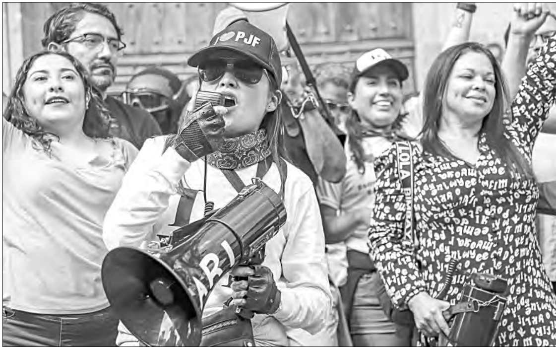
▲ Juzgadores decidieron ayer en votación mantener la suspensión parcial de labores en apoyo a los trabajadores jurisdiccionales. La imagen, afuera de Palacio Nacional.