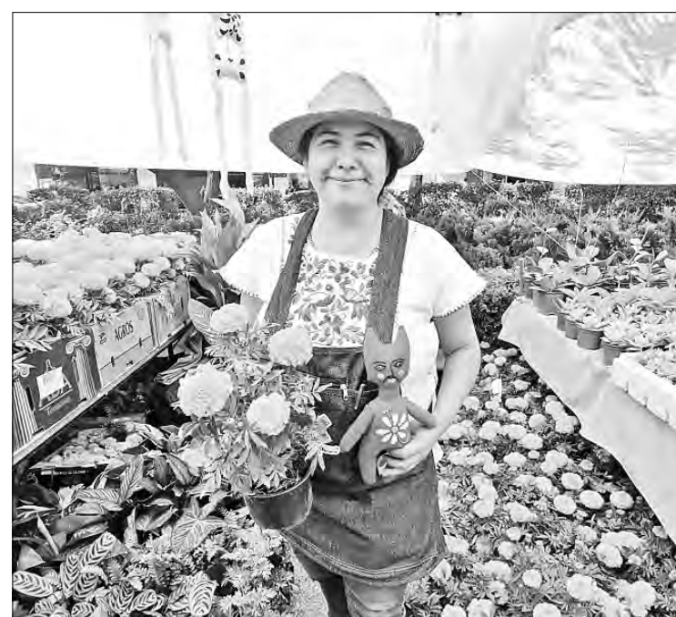
▲ El festival servirá para apoyar a los floricultores que perdieron parte de sus cultivos por la inundación del 16 de septiembre en las zonas de Caltongo y San Gregorio, en Xochimilco.

El Festival de Flores de Cempasúchil en Paseo de la Reforma fue instalado en el tramo de la columna de la Independencia y la glorieta del Ahuehute, en ambas aceras, donde participan 140 productores, y la Secretaría de Turismo espera que más de 250 mil turistas visiten la ciudad con motivo de la celebración del Día de Muertos.