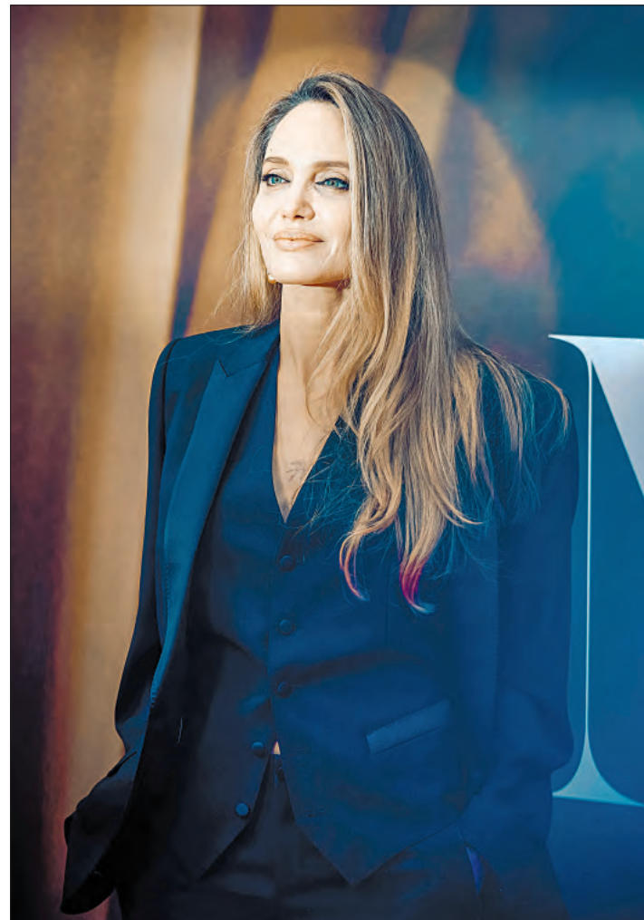
▲ La actriz estadounidense Angelina Jolie asistió este viernes al Festival de Cine de Londres para la proyección de su nueva película María , en el Royal Festival Hall. La cinta narra la vida de una de las mejores cantantes de ópera de la historia, María Callas.