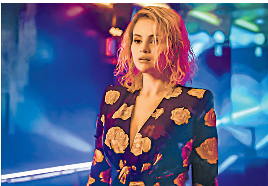
▲ Fotogramas de la película Emilia Pérez , del realizador francés Jacques Audiard.