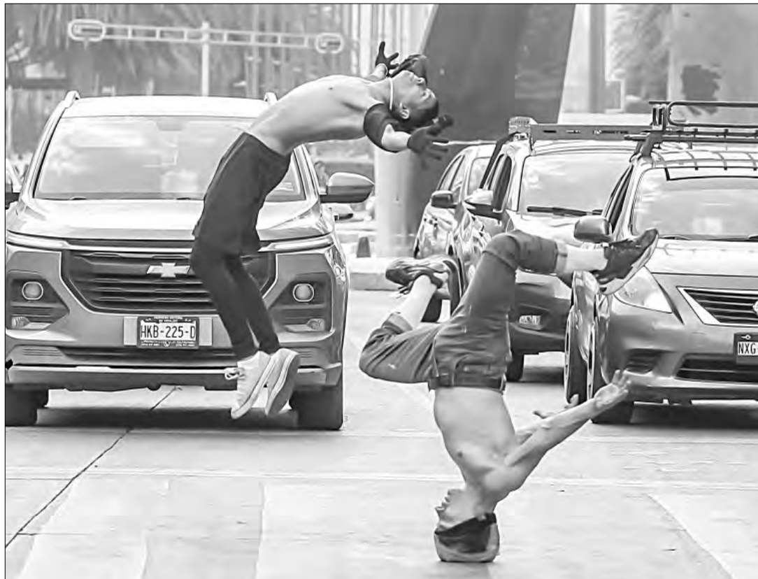
▲ Jóvenes de la Ciudad de México, Venezuela y Londres realizan acrobacias para recolectar