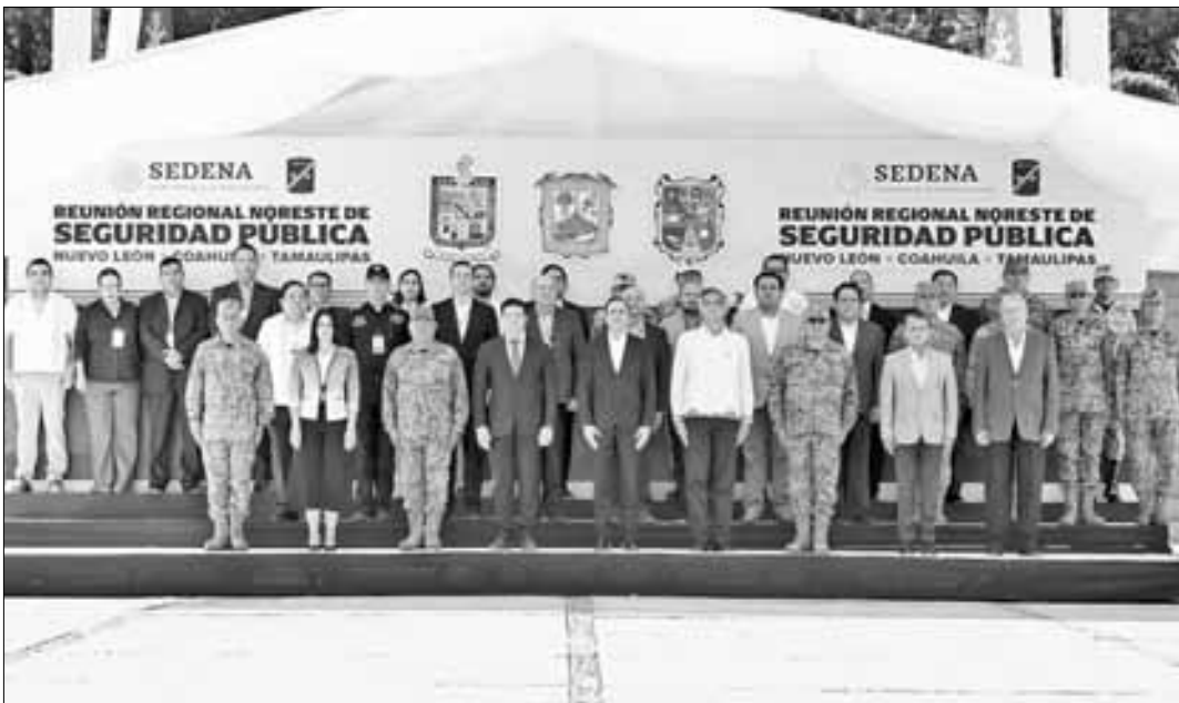
▲ El gobernador de Tamaulipas, Américo Villarreal Anaya, durante su participación en la Reunión Regional Noreste de Seguridad