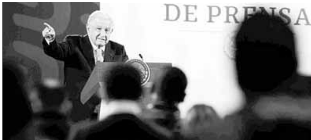
▲ El presidente López Obrador hizo un balance del rescate de la banca, que en 29 años ha costado alrededor de un billón y

Twitter: @cafevega cfvmexico_sa@hotmail.com