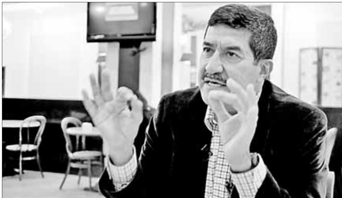
▲ Javier Corral, durante una entrevista con La Jornada , el 9 de diciembre de 2022.

“Las conductas advertidas se relacionan con sus declaraciones patrimoniales de modificación y conclusión en su encargo como gobernador constitucional del estado de Chihuahua; es decir, no declaró un inmueble”, subrayó la dependencia.