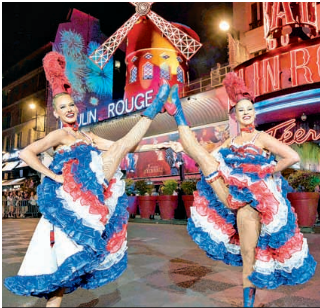
▲ En vísperas del inicio de los Juegos Olímpicos de París 2024, un par de bailarinas actúan frente al icónico cabaret Moulin Rouge durante la