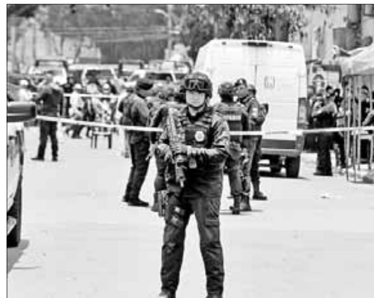
▲ Tras la notificación, decenas de efectivos acudieron a resguardar esa zona.

También se destacó que otro hombre que se encontraba dentro de la vivienda, así como el conductor del mototaxi—a quien al parecer se contrató para hacer el traslado—, fueron presentados ante las autoridades ministeriales con el fin de que rindan su declaración.