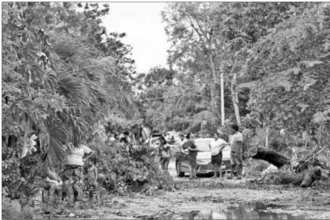
▲ Efectivos del Ejército instalaron ayer dos comedores comunitarios en Tulum, Quintana Roo, tras el paso de Beryl . Asimismo, las lluvias y las