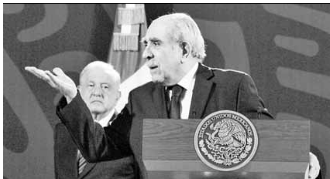
▲ Pablo Gómez Álvarez, titular de la Unidad de Inteligencia Financiera (UIF) de la Secretaría de Hacienda y Crédito Público, señaló que se investiga a los socios accionistas de Latinus, en particular a quien aparece como dueño del

Señaló que la UIF ha detectado que hay 16 empresas que son receptoras de dinero defraudado en México por la red de desfalco de García Luna y que fue enviado al extranjero a paraísos fiscales para luego ser retornado al México, “ocho de las 16 están listadas por el SAT en el artículo 69-b del código fiscal, que son los factureros , que se dedican a hacer contabilidades falsas”.