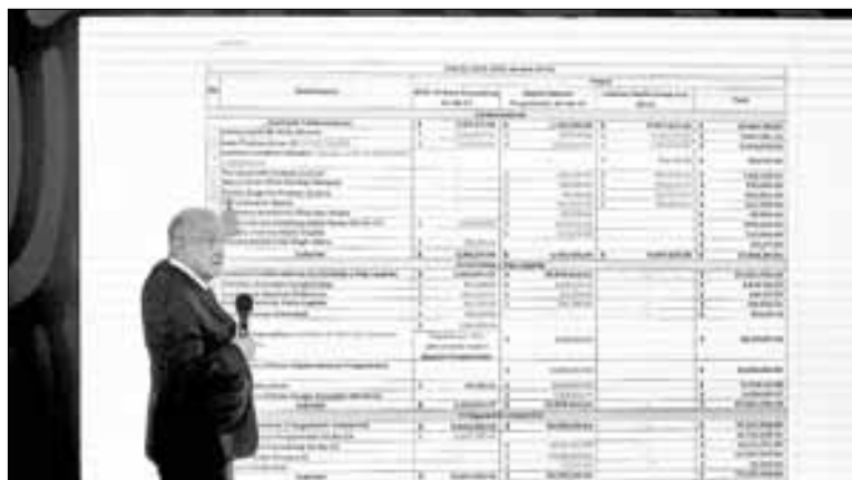
▲ En la conferencia matutina del presidente Andrés Manuel López Obrador, la UIF también dio a conocer una nómina de Latinus. Se aseguró que una de las empresas que conforman el grupo tiene sede en Delaware, Estados Unidos.

Gómez Álvarez, quien también dio a conocer una nómina de Latinus, expuso que una de las empresas que conforman el grupo empresarial tiene sede en Delaware, Estados Unidos, estado al que se refirió como un “paraíso fiscal”. Esto, agregó, ha complicado las investigaciones y se ignora quién es el dueño de dicha firma y de dónde proceden los recursos con los que opera.