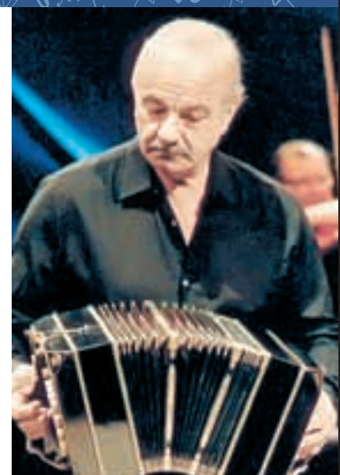
Tango maestro. La vida y música de Astor Piazzolla

De Ethan y Joel Coen (Estados Unidos, 2004)