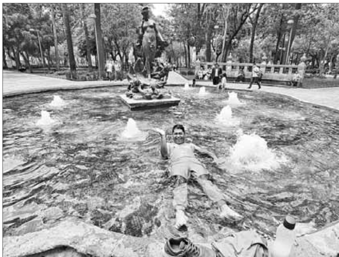
▲ Con todo y que refrescó el clima, hay quien se atreve a chapotear.