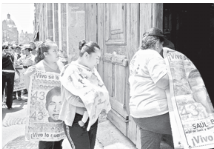
▲ Familiares de los normalistas de Ayotzinapa desaparecidos en 2014, a su llegada a Palacio Nacional.

EMIR OLIVARES, JESSICA XANTOMILA, JARED LAURELES Y ARTURO SÁNCHEZ