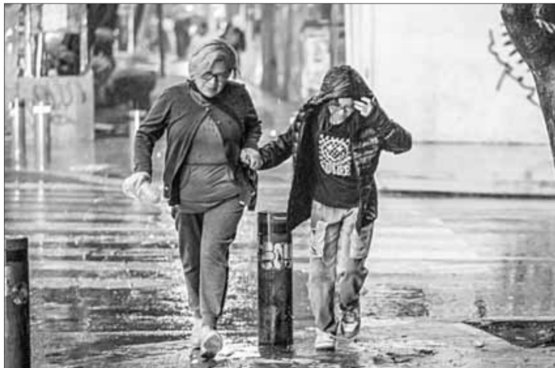
▲ Las lluvias persistieron ayer en gran parte de la ciudad, aunque con menor intensidad, mientras este sábado la Conagua pronosticó fuertes

precipitaciones acompañadas de actividad eléctrica, granizo y rachas de viento hasta de 50 kilómetros por hora.