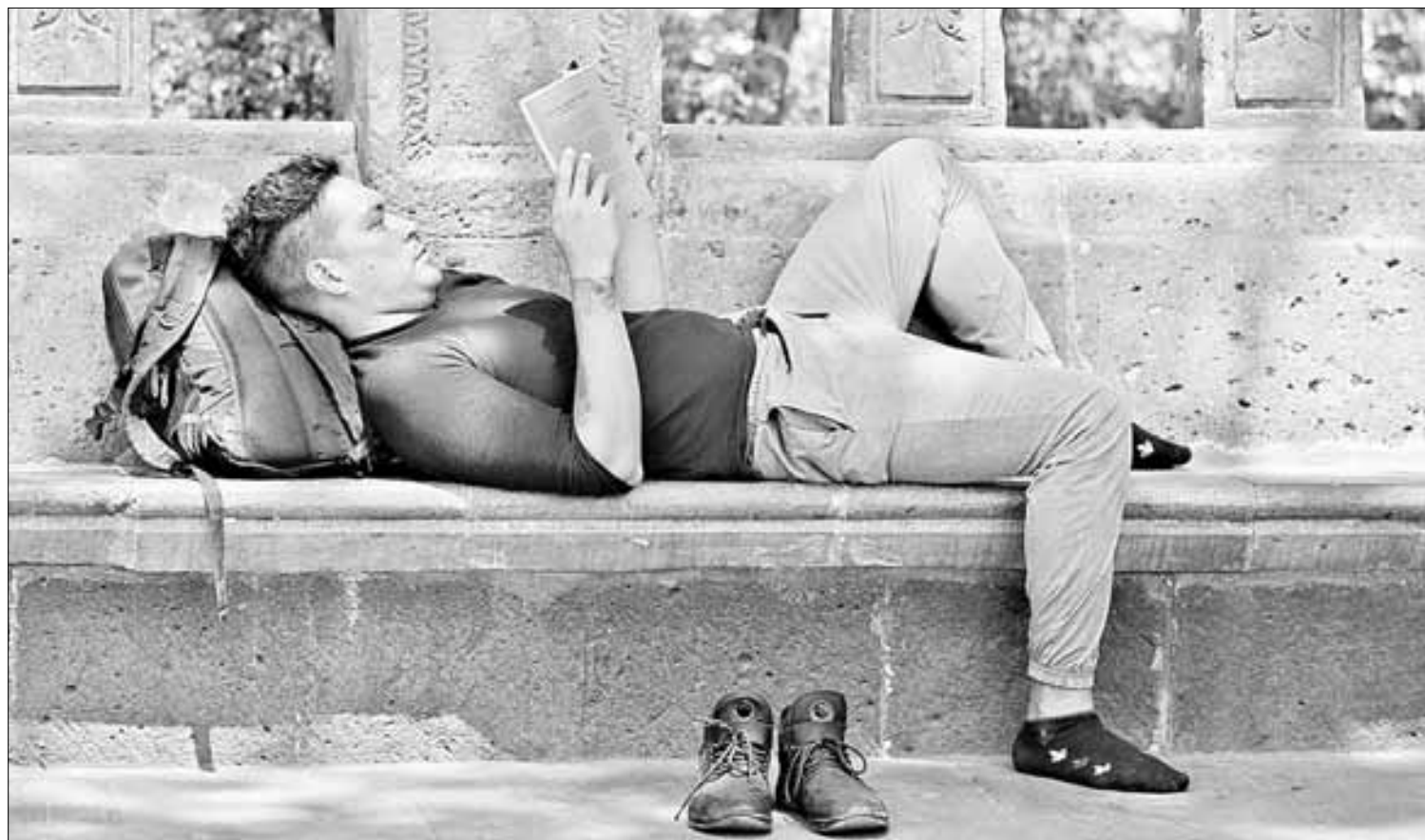
▲ Una excelente actividad en la postura más cómoda.