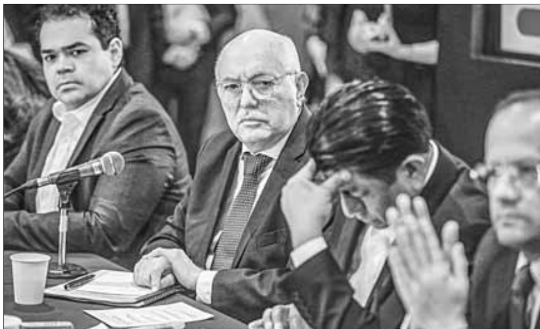
▲ El titular de la Auditoría Superior (centro) durante una reunión con diputados en mayo pasado.