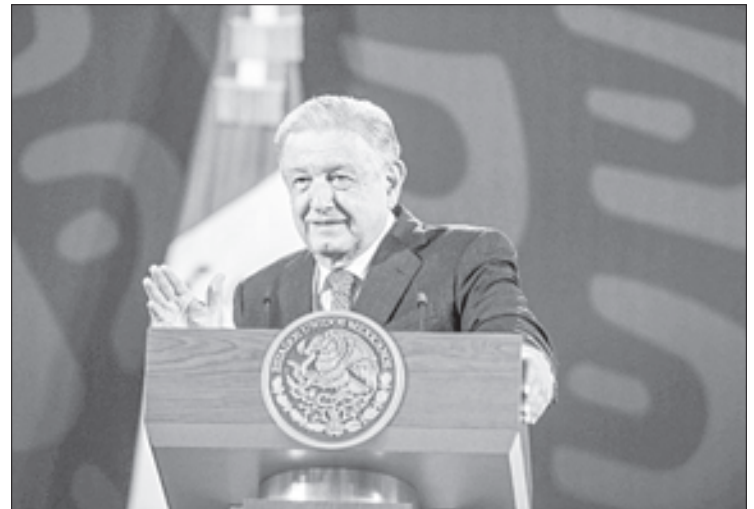
▲ Andrés Manuel López Obrador dijo que en otros sexenios se culpó a los maestros del retraso educativo.

demás y sacando adelante a nuestro querido México. Y muchas gracias, muchas, muchas, muchas gracias por lo que ustedes hacen, por la contribución al desarrollo de nuestro país; un abrazo”.