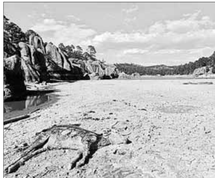
▲ El lago Arareko, cerca del poblado de Creel, municipio de Bocoyna, Chihuahua, fue otrora un santuario para la vida silvestre, y a la fecha ha perdido más de la mitad de su nivel ante la ausencia de lluvias.

“Para frenar la autodestrucción, necesitamos amistad, unión, solidaridad, tener la confianza de pedir apoyo y ayudar si está a nuestro alcance, así como educar a las nuevas generaciones”, expuso el documentalista rarámuri.