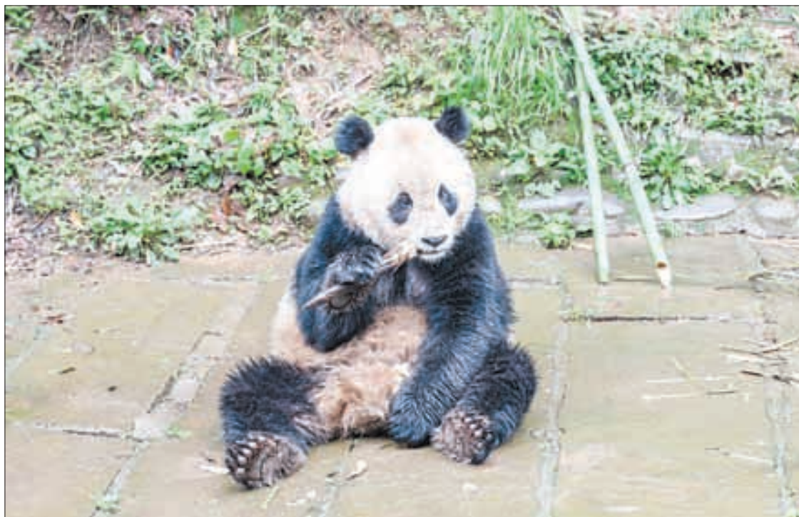
▲ Yun Chuan , el ejemplar macho que será acogido en San Diego, como parte del programa de conservación bilateral.

Yun Chuan es hijo de Zhen Zhen , quien nació en ese zoológico, y nieto de Bai Yun , quien vivió ahí más de 20 años.