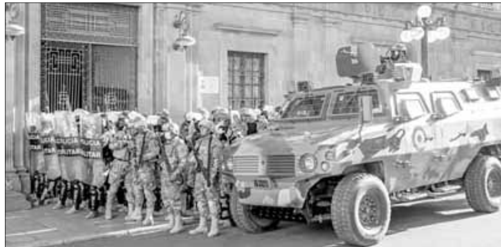
▲ Un vehículo blindado y policías militares afuera del palacio de gobierno en la Plaza

X, antes Twitter: @cafevega cfvmexico_sa@hotmail.com