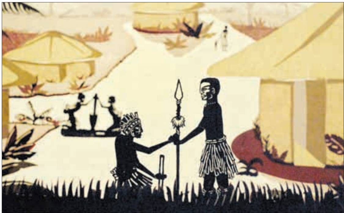
◀ Fotograma de la película Nyanga.

Con este estímulo se han apoyado los procesos de producción o posproducción de 68 películas (cortometrajes y largometrajes de ficción, documental y animación), realizados por 31 mujeres y 35 hombres de pueblos originarios y afrodescendientes de México y Centroamérica, así como dos mujeres mexicanas no indígenas. De las 68 películas se han terminado 12, de las cuales 11 ya han sido estrenadas en festivales de cine nacionales e internacionales.