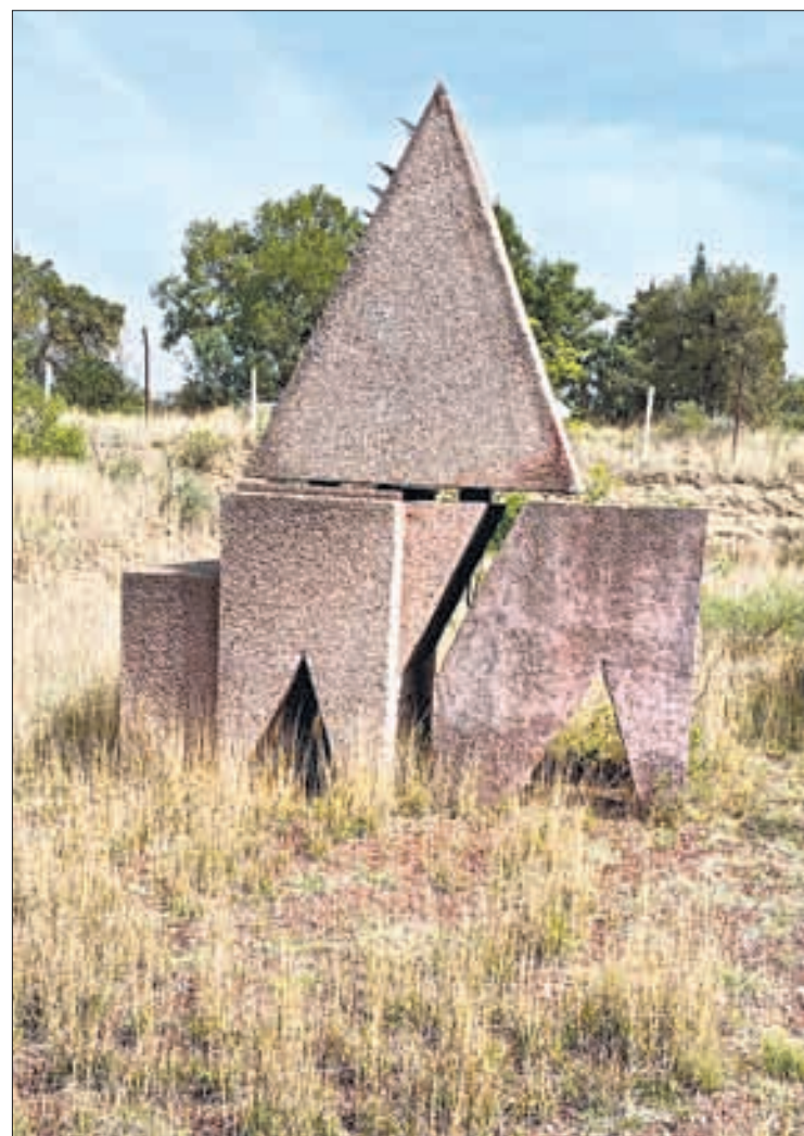
▲ La escultura Milenio en las inmediaciones del taller de Federico Silva, en Tlalmimilolpan, Tlaxcala.

El próximo 15 de julio la escultura monumental Ave , de 21 metros de altura, será inaugurada en el centro de Guadalajara. Es un proyecto que nació hace 15 años, de acuerdo con González Tovar.