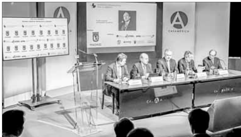
▲ El ex presidente Felipe Calderón participó ayer en un foro en Madrid donde habló de las

en que le tienen un gran afecto a Gerardo Fernández Noroña, es muy valioso y un notable legislador. Sin embargo, no quedó incluido en el acuerdo por el cual serían compensadas las corcholatas que perdieron en la encuesta con cargos en el gabinete y el Congreso de la Unión. Como ganadora del proceso, Claudia está fuera de discusión, Marcelo Ebrard fue designado por ella como secretario de Economía, Adán Augusto López Hernández se perfila como futuro coordinador del grupo guinda del Senado y Ricardo Monreal de la Cámara de Diputados. Pero los dos aspirantes de los partidos aliados, Fernández Noroña, del PT, y Manuel Velasco, del Verde, no son morenistas purasangre –valga la expresión– y no entraron en el acuerdo original.