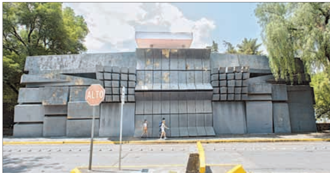
▲ Fachada de la escultura monumental en la Facultad de Ingeniería de la UNAM.

“Las figuraciones, la abstracción, marchan juntas, lo mismo en la pintura, mucho más en la escultura. La escultura reclama formas muy precisas, muy concretas. La figuración