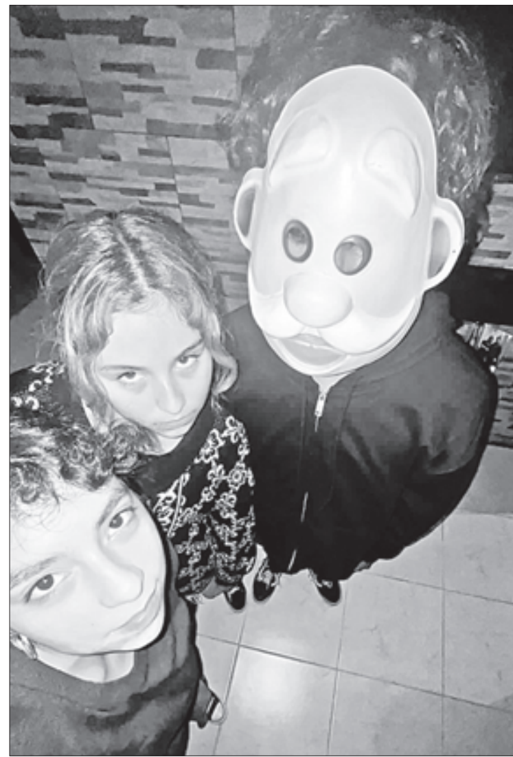
▲ Los integrantes de Delirio en una selfi.

“Otra canción llamada ., o sea el puntito, trata sobre reconocer a Dios en cada uno de nosotros: la deidad que está en el laberinto del inconsciente, tenemos que buscarlo, encontrarlos, conocernos a nosotros mismos para volverlo consciente. Es una canción muy corta, pero intenté mostrar un poco de esta parte que no conocemos por