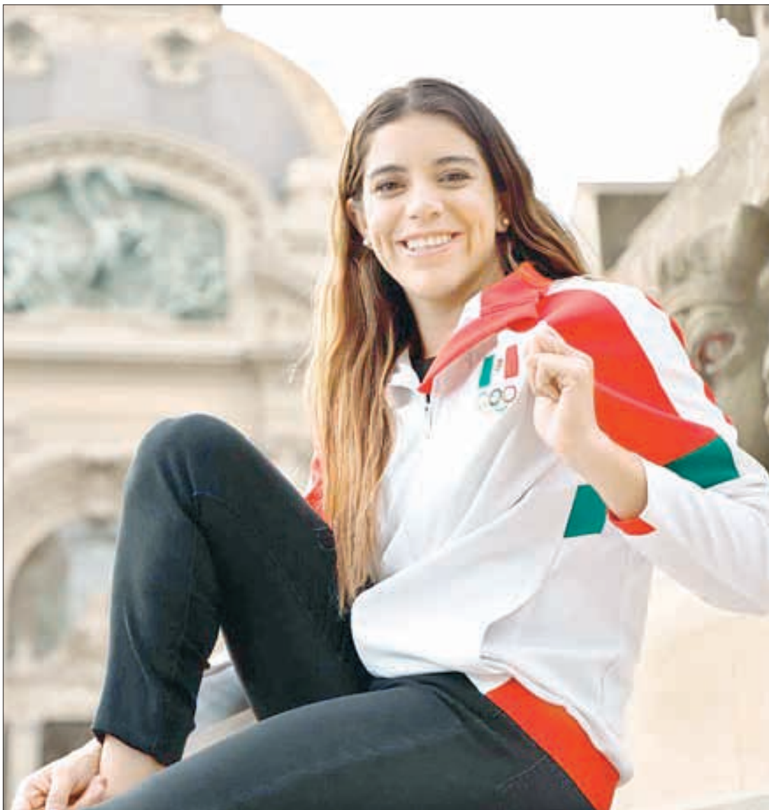
▲ La clavadista desfilará en la apertura de los Juegos de París con la seguridad de que a su

En total, la Conade suma ocho descalabros en tribunales hasta el momento.