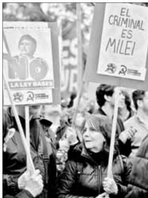
▲ Aspecto de la manifestación realizada el pasado 18 de junio en la Plaza de Mayo, en Buenos Aires, Argentina, para demandar la liberación de las personas detenidas una semana antes durante una protesta fuera del Congreso nacional. La política económica aplicada por el mandatario ha recibido elogios del Fondo Monetario Internacional, pese a sus altos costos sociales.

X: @cafevega Correo: cfvmexico_sa@hotmail.com