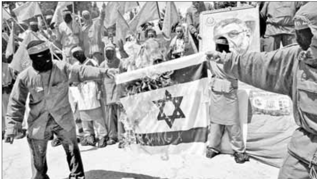
▲ Militantes de Hamas queman una bandera israelí frente a la Universidad de Hebrón, el 3 de mayo de 2004, mientras fuerzas de Tel Aviv continuaron ayer sus ataques en la franja de Gaza.

COMENTA QUE “ISRAEL no se percata de que la carnicería y devastación que ha librado en Gaza sólo ha hecho más fuerte a su enemigo”.