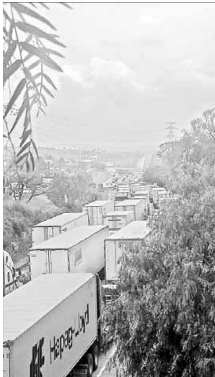
▲ Una fila de vehículos hasta de 30 kilómetros, según autoridades, se reportó en la autopista México-Querétaro, con dirección norte, a consecuencia de dos accidentes vehiculares en la vialidad, lo que afectó a cientos de conductores.

En redes sociales, usuarios externaron su impotencia sobre la situación que se vive en la zona, donde se registran frecuentes congestiones en la circulación.