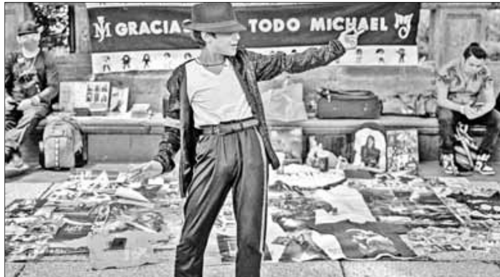
▲ Un admirador del cantante, compositor y bailarín estadounidense ejecuta una rutina de su ídolo frente a un altar instalado por sus