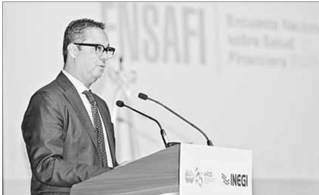
► El subsecretario de Hacienda, Gabriel Yorio, en la presentación de la primera Encuesta Nacional sobre Salud Financiera.

“No tengo conocimiento de que sea un régimen de inversión asociado, es un mecanismo presupuestal para compensar a los trabajadores que tengan una tasa de remplazo muy baja”, detalló Gabriel Yorio.