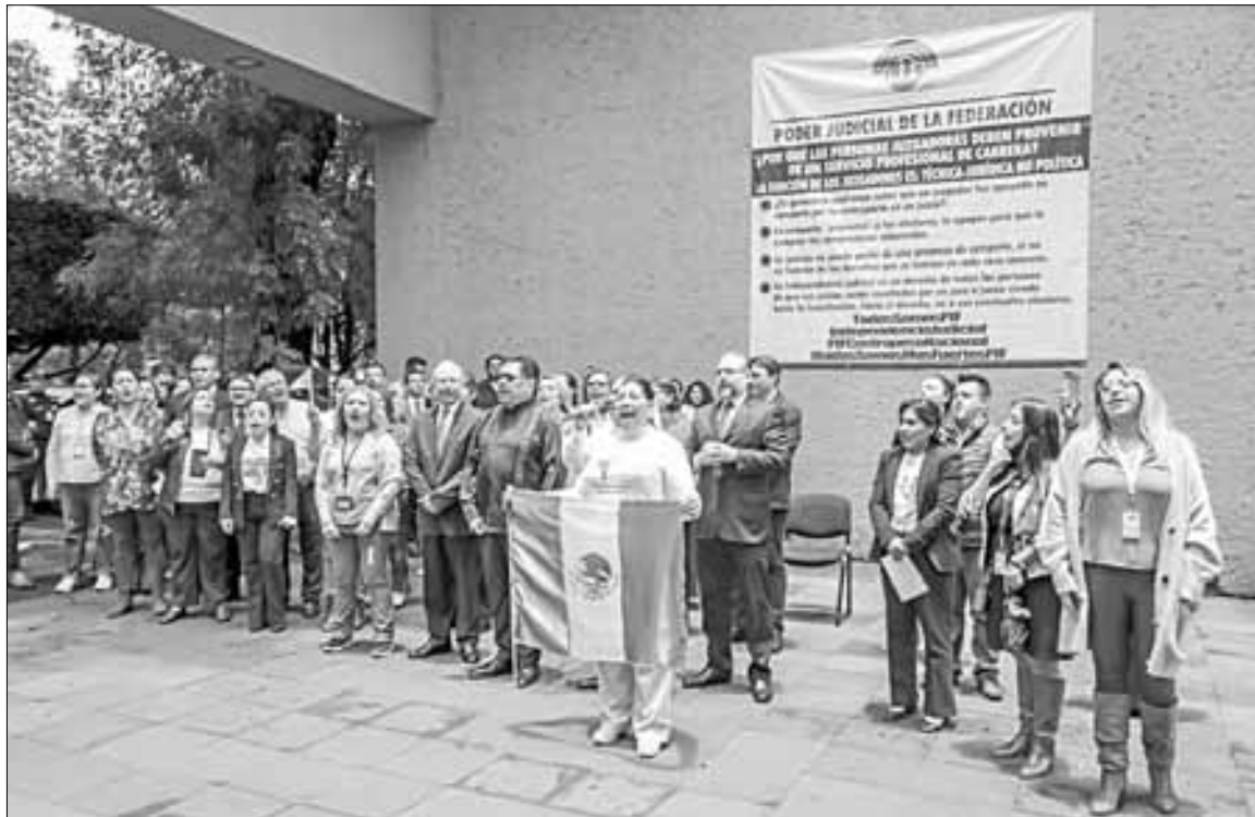
▲ Acompañados de trabajadores del PJJ, magistrados federales señalaron ayer que la

propuesta del Ejecutivo va no sólo contra la cúpula, sino contra toda la carrera judicial.