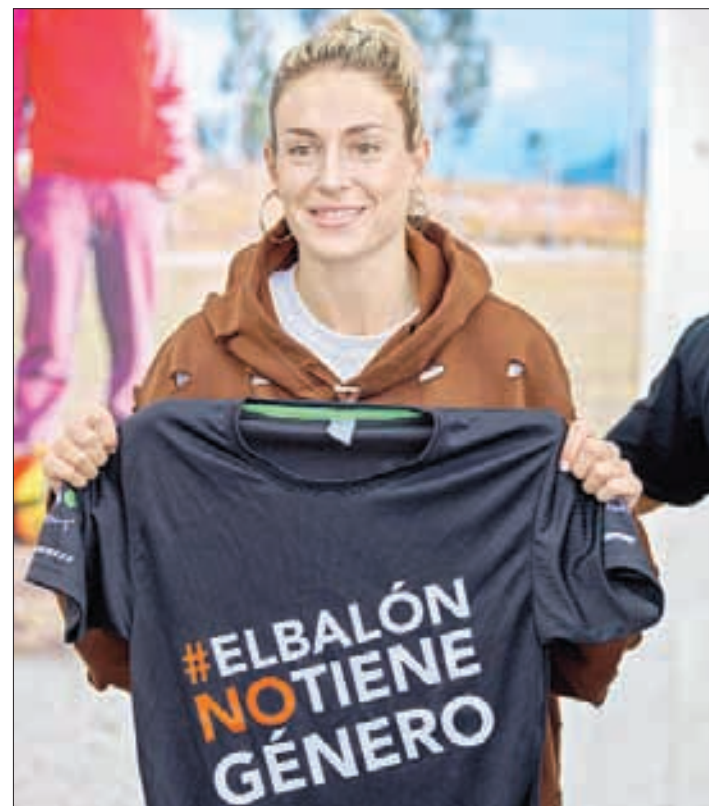
▲ La jugadora del Barcelona, dos veces ganadora del Balón de Oro, convivió con niñas y niños mexicanos, a quienes alentó a seguir con sus sueños.

La campeona del mundo realiza un recorrido por América Latina para apoyar programas sociales después de inaugurar en Colombia su fundación para desarrollar las habilidades futbolísticas y emocionales de jóvenes talentos.