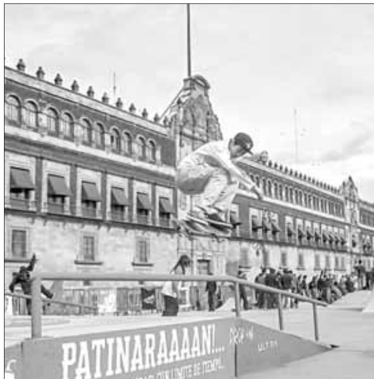
▲ Para conmemorar la fecha, hubo actividades, música y concursos con jóvenes y sus patinetas.