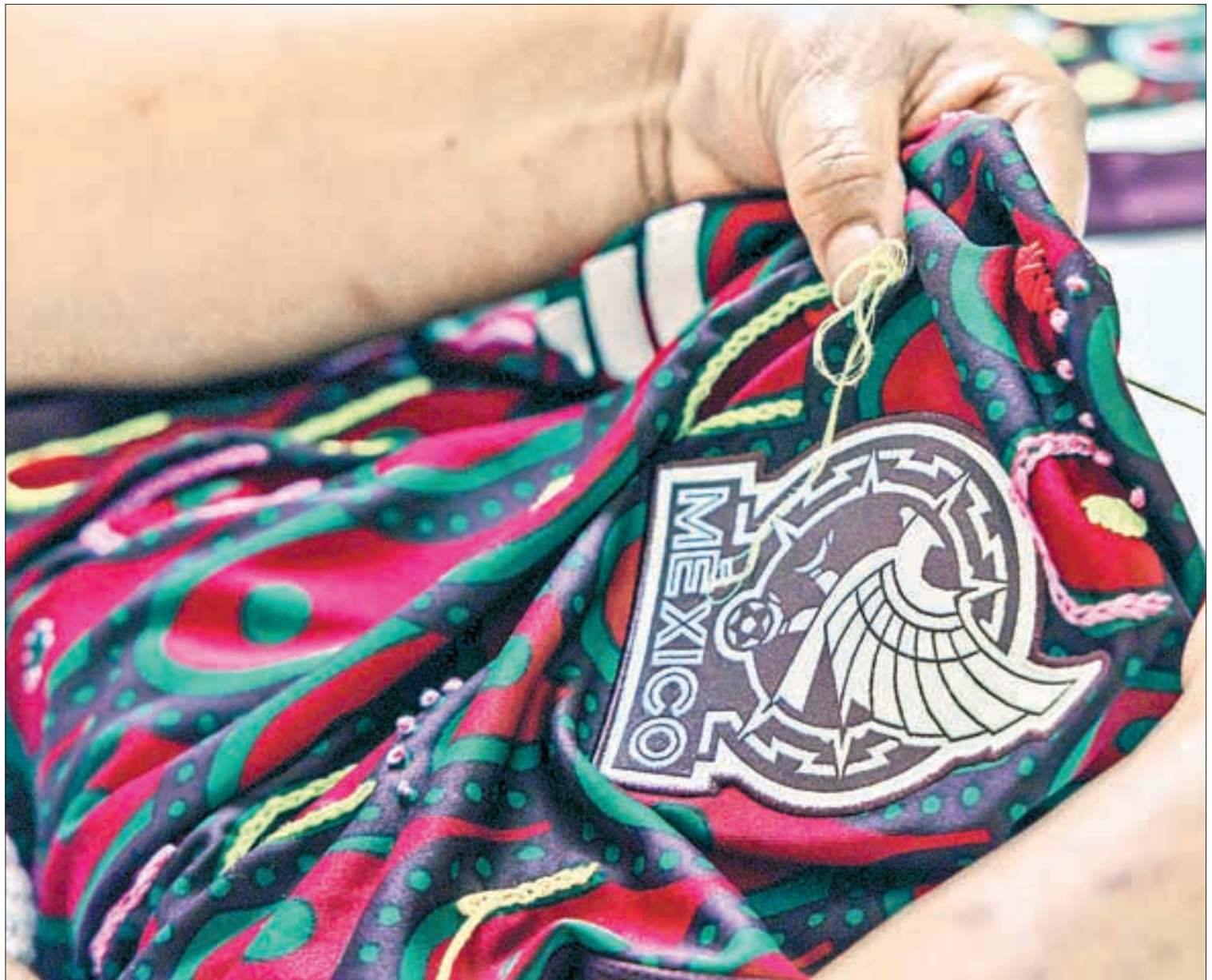
▲ Las playeras, creadas con materiales sustentables, toman forma de triángulos y líneas de colores tejidas. “Nuestra misión es promocionar

Esta iniciativa busca contribuir al bienestar de las mujeres artesanas, muchas de ellas marginadas y en una situación de extrema pobreza. El bordado es una tradición que refleja sus orígenes, el lugar de donde son y los símbolos que les dan valor. De alguna manera, su propio lenguaje. Todo eso da luz a las camisetas de local y visitante intervenidas, enfocadas a preservar la herencia cultural de nuestro país, sus raíces y las semillas que deja para el futuro.