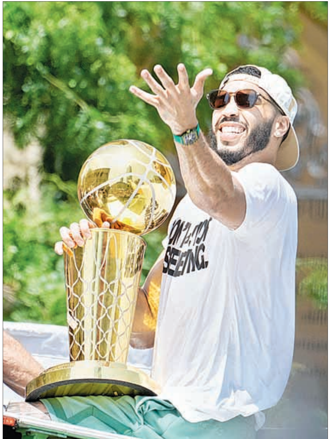
▲ Los Celtics celebraron ayer con miles de aficionados su campeonato número 18 de la NBA en un colorido desfile por las calles de Boston sobre los llamados duck boats (vehículos anfibios para turismo). Tras vencer en las finales a los