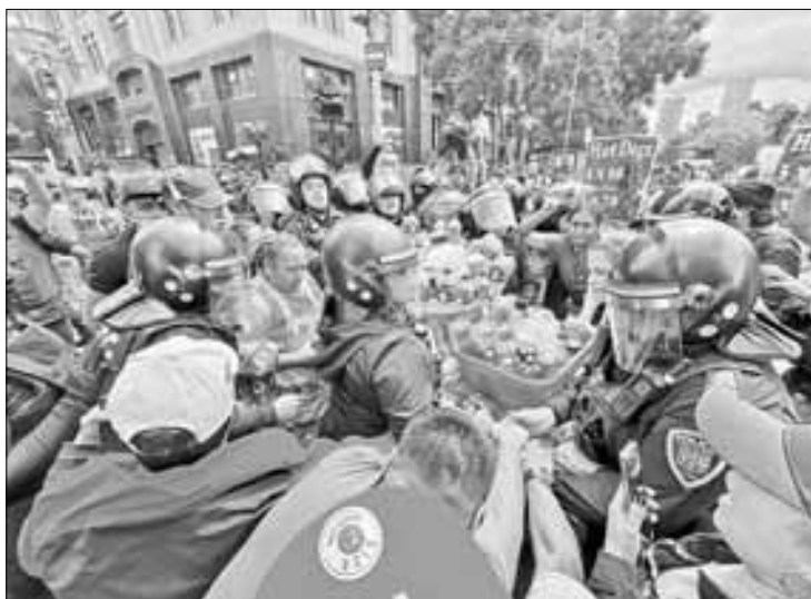
▲ Los comerciantes utilizaron su propia mercancía como proyectiles contra los policías y funcionarios del gobierno que intentaron removerlos cuando bloqueaban por segundo día el cruce de Eje Central Lázaro Cárdenas y avenida Juárez.