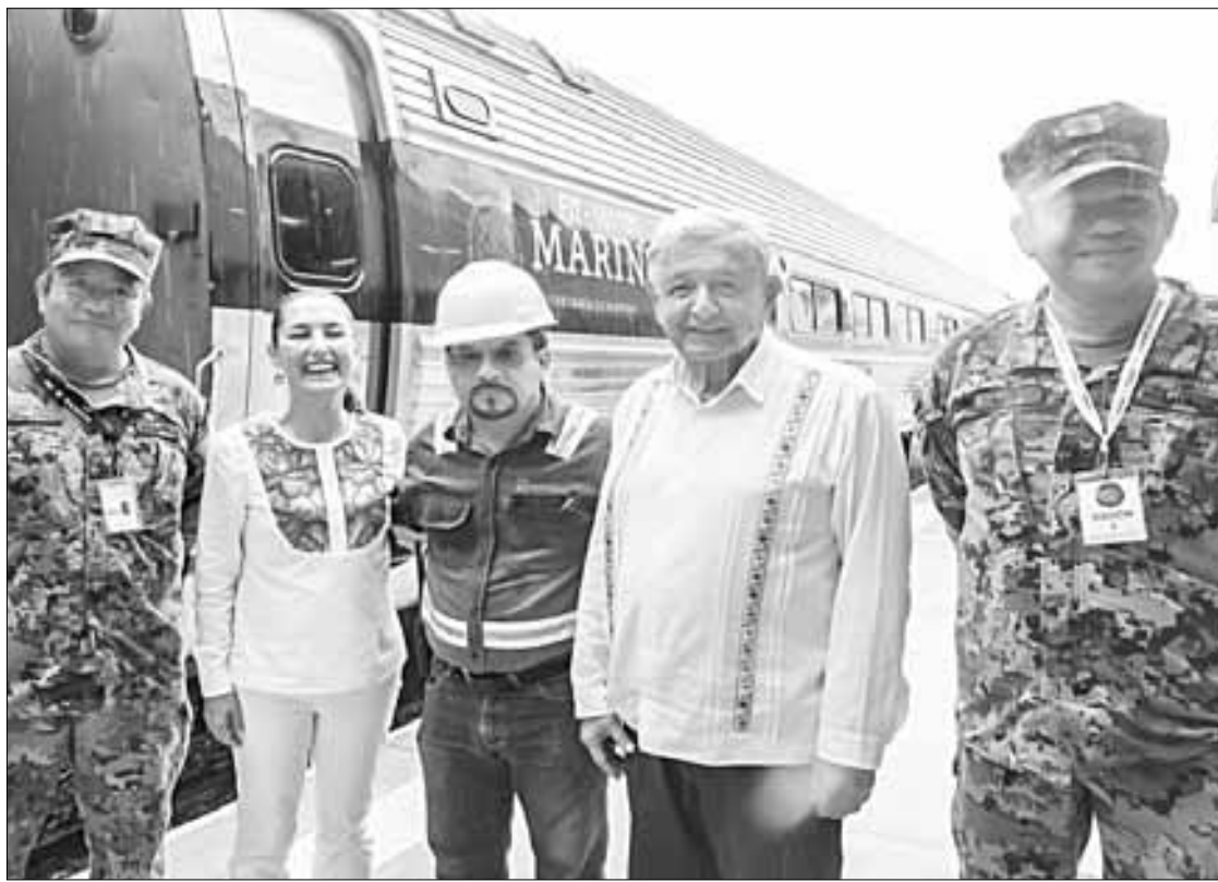
◀ La virtual presidenta electa y López Obrador, en Matías Romero, donde hicieron una escala en su recorrido de Jáltipan, Veracruz, a Salina Cruz, Oaxaca.

En la mañana, el Presidente confirmó que aún tendrá siete giras más junto a Sheinbaum los siguientes fines de semana, que incluirán visitas al Tren Maya, Baja California y Sonora.