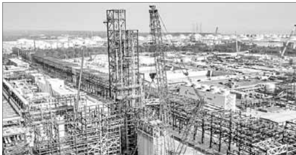
▲ Al finalizar 2024 se tiene proyectado que el procesamiento de crudo llegue a un millón 439 mil barriles diarios gracias al Sistema Nacional

Twitter: @cafevega cfvmexico_sa@hotmail.com