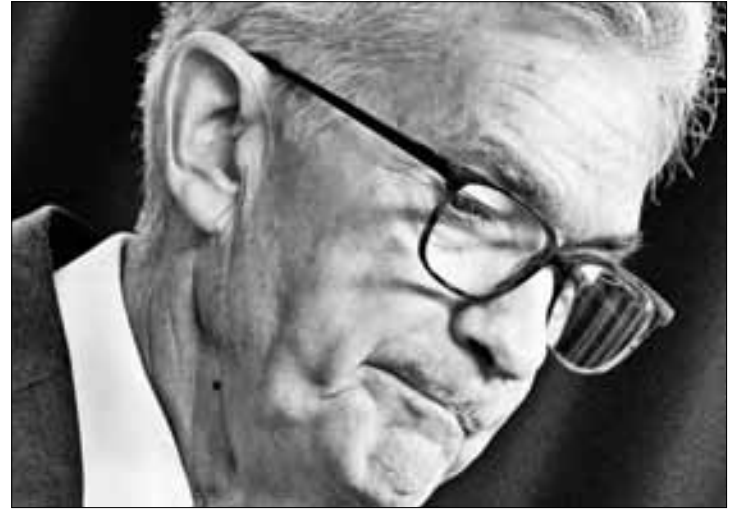
▲ Jerome Powell, presidente de la Fed.

El dato de inflación de mayo se publicó al comenzar el último día