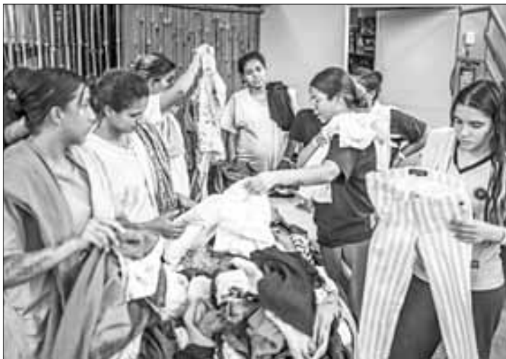
▲ En 2023 la población de refugiados llegó a 43.7 millones, revela el organismo de la ONU. La imagen, en el albergue Oasis de Paz Espiritu Santo, en Villahermosa, Tabasco.

“Una de cada 69 personas en todo el mundo (1.5 por ciento de la población mundial) fue desplazada por la fuerza, casi el doble de hace