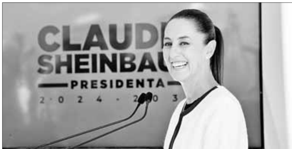
▲ La virtual presidenta electa, Claudia Sheinbaum, ofreció ayer una conferencia de prensa en la que reiteró que “no hay nerviosismo”, pues la economía “está muy