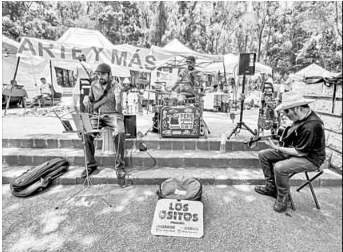
▲ Cuando hay talento lo mejor es exhibirlo.

México, y que hoy continúa Batres, es una de los mejores no sólo del país, sino también a escala internacional.