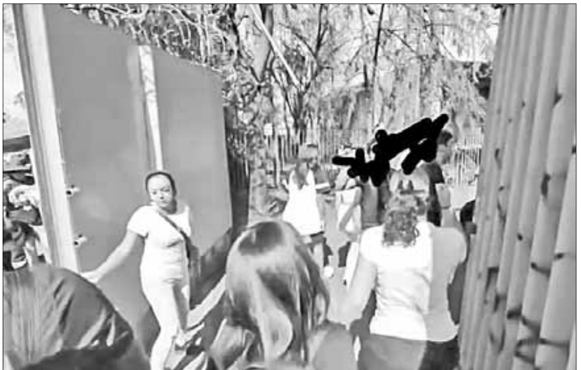
▲ A jaloneos y empujones, padres de familia y alumnos dieron portazo ayer y entraron a las instalaciones del plantel, las cuales fueron

“¡Goya, sí se pudo!”, “No a la violencia, chicos”, externó el grupo de jóvenes y padres de familia, que incluso recibió el apoyo de algunos profesores, que a jaloneos y empujones abrieron una de las puertas secundarias del inmueble e ingresaron al plantel, a la par que estudiantes que mantuvieron la toma del Colegio se replegaron dentro del mismo inmueble.