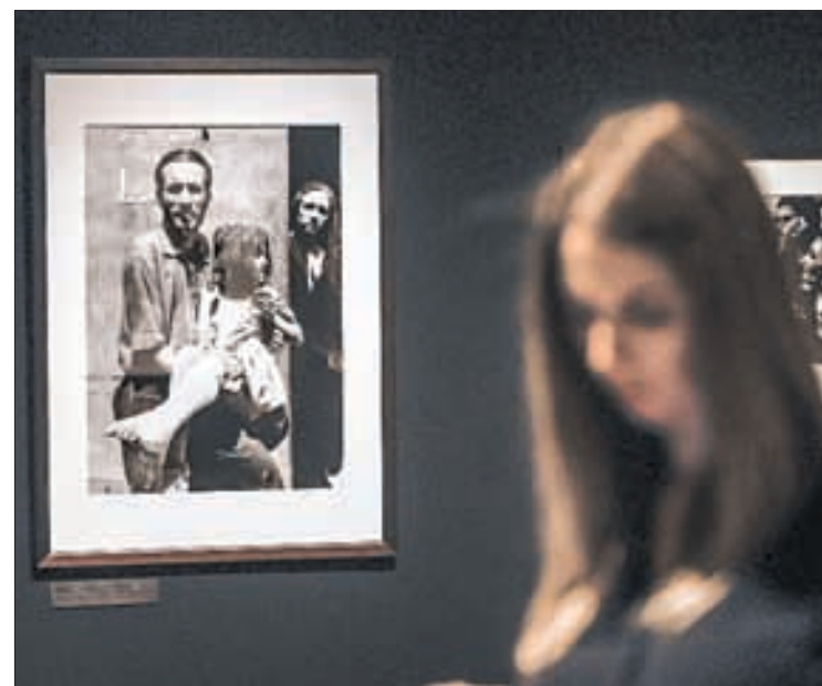
▲ Arriba, imagen de Martin Parr. Abajo, fotografía de Robert Capa en una exposición retrospectiva en el Palacio de las Comunicaciones, en Valencia, España.

En 2010 Magnum vendió su colección de fotografías impresas, “de las que conserva los derechos de autor”, al magnate de las computadoras Michael Dell, quien más tarde legó el archivo al Centro Harry Ransom de la Universidad de Texas para su conservación y catalogación. En 2022, año en que cumplió su 75 aniversario, puso el foco en el conflicto armado de Ucrania con iniciativas como el lanzamiento de una venta de fotografías sobre conflictos armados, cuyos beneficios fueron destinados al Comité Internacional de la Cruz Roja para apoyar la protección de la vida y la dignidad humana en Ucrania y otros lugares afectados por guerras.