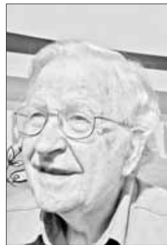
▲ El lingüista, activista y crítico social Noam Chomsky, en imagen de archivo.

Castro subrayó que es importante la pregunta porque sus colegas frecuentemente se limitan a hablar de los peligros reales de los cárteles, pero no abordan el hecho de que "ellos son empoderados con armas estadounidenses" y que se requiere hacer más para frenar el tráfico ilegal de armas a manos criminales.