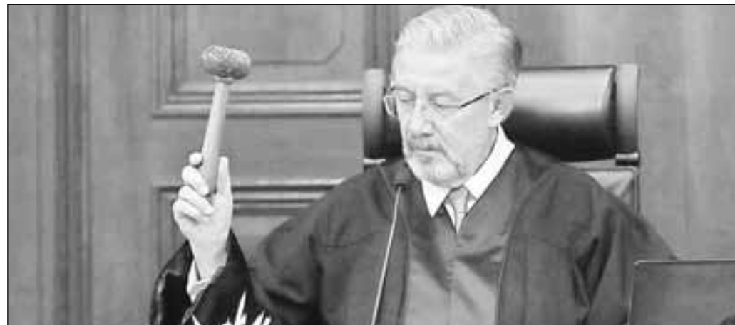
▲ Durante 10 meses, el ministro Luis María Aguilar Morales “guardó” en su escritorio el expediente fiscal de Tv Azteca para proteger

Twitter: @cafevega cfvmexico_sa@hotmail.com