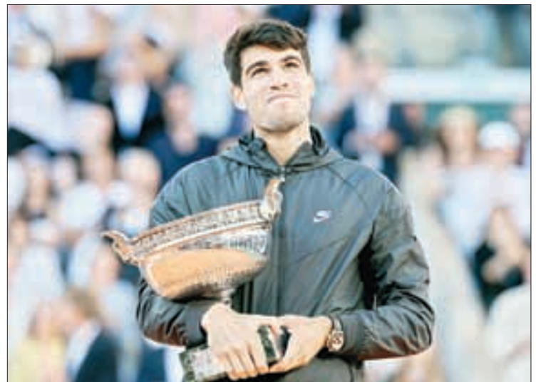
▲ En la cita veraniega de Pekín 2008, Nadal (arriba) ganó su primera medalla dorada y ahora compartirá su experiencia con el juvenil Alcaraz (sobre estas líneas), quien en días recientes alzó su primer título de Roland Garros en la capital francesa, misma cancha de arcilla donde se jugará el tenis olímpico.