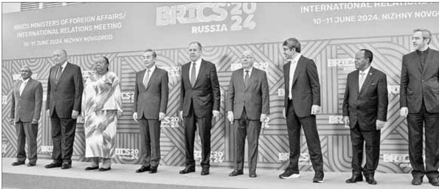
◀ Cancilleres del grupo de los BRICS (agrupación de países emergentes), ayer en la cumbre que se celebró en la ciudad rusa de Nizhny Novgorod.

LA HEGEMONÍA DE OCCIDENTE ESTÁ CONDENADA AL FRACASO: LAVROV