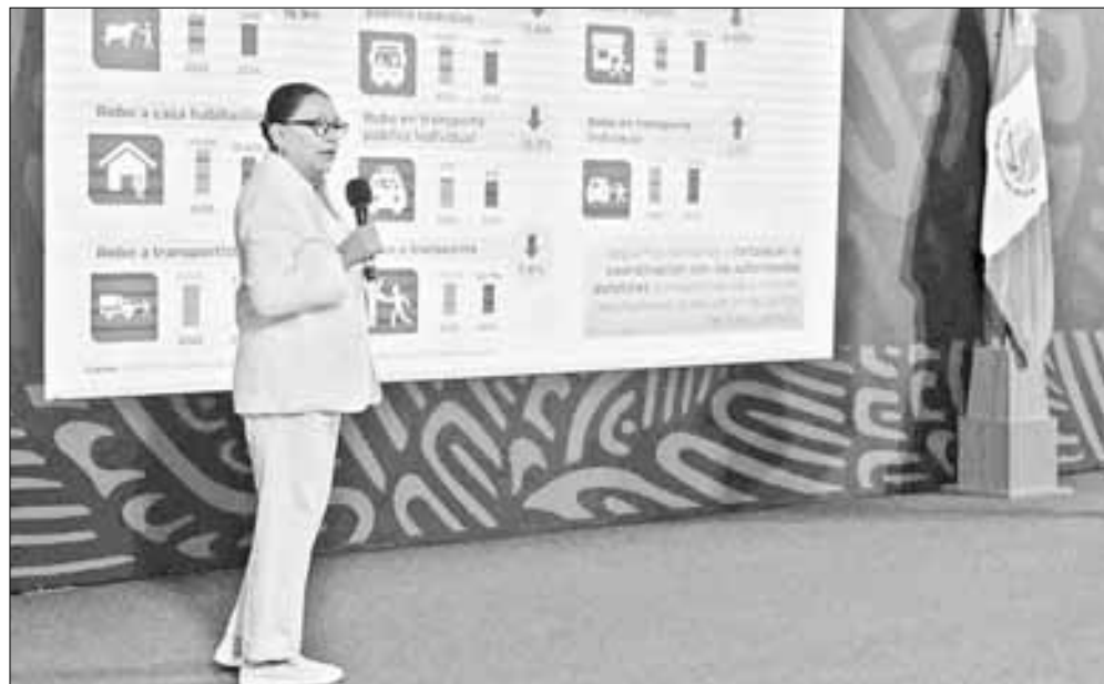
▲ La secretaria de Seguridad, Rosa Icela Rodríguez, reportó ayer en la mañanera del