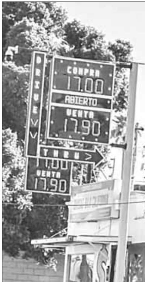
▲ Una casa de cambio de Mexicali, Baja California, desafía la turbulencia financiera internacional y vende dólares por debajo de 18 pesos.

INESPERADAMENTE REAPARECIÓ EN la escena Francisco Gil Díaz, ex subsecretario de Hacienda en el sexenio foxista, también fue subgobernador del Banco de México. Ha estado residiendo en España en los últimos tiempos. Comentó en X: “¿El tipo de cambio no importa? Quizá, pero la posible escalada de precios sí que debe preocupar”. @Paco