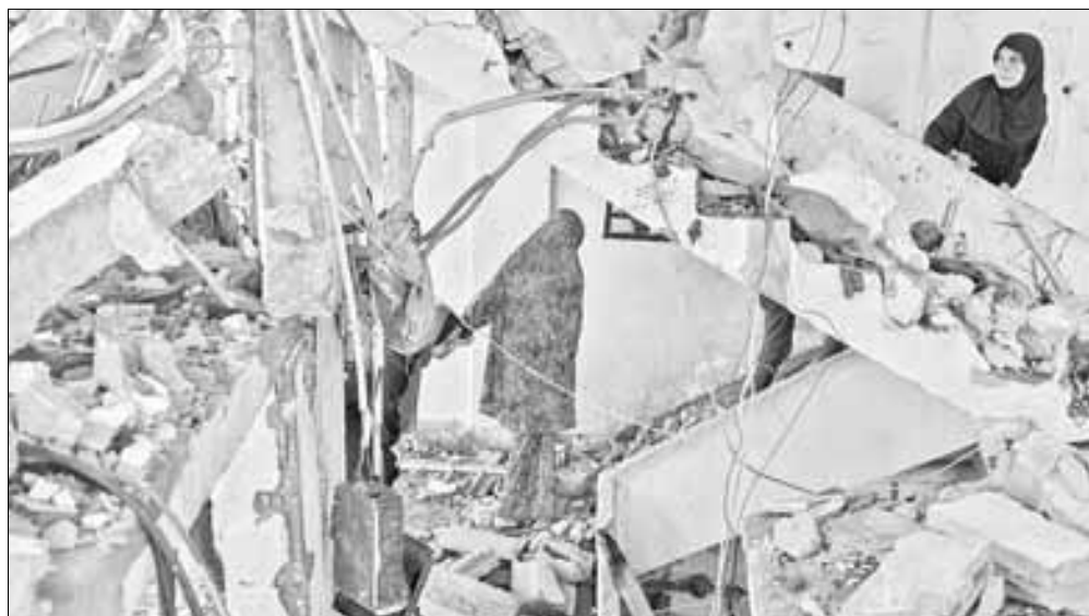
▲ Palestinos inspeccionan los escombros de sus viviendas en el barrio de Daraj, luego de

http://alfredojalife.com https://www.facebook.com/AlfredoJalife https://vk.com/alfredojalifeoficial https://t.me/AJalife https://www.youtube.com/channel/UCIfxfOThZDPL_c0Ld7psDsw?view_as=subscriber https://vm.tiktok.com/ZM8KnkKQn/ https://twitter.com/AlfredoJalife Instagram: @alfredojalifer