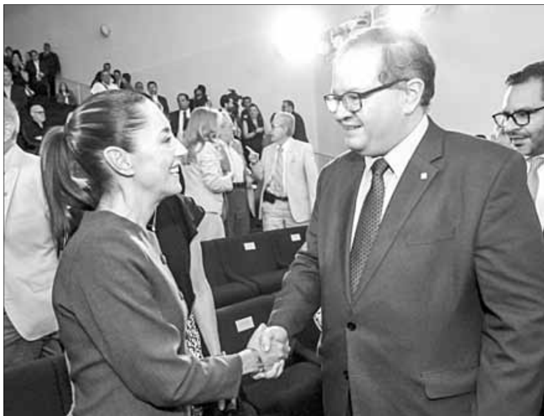
▲ La virtual presidenta electa, Claudia Sheinbaum, y el rector de la Universidad Nacional Autónoma de México, Leonardo Lomelí, conversan durante la entrega de los Premios en Salud 2024.