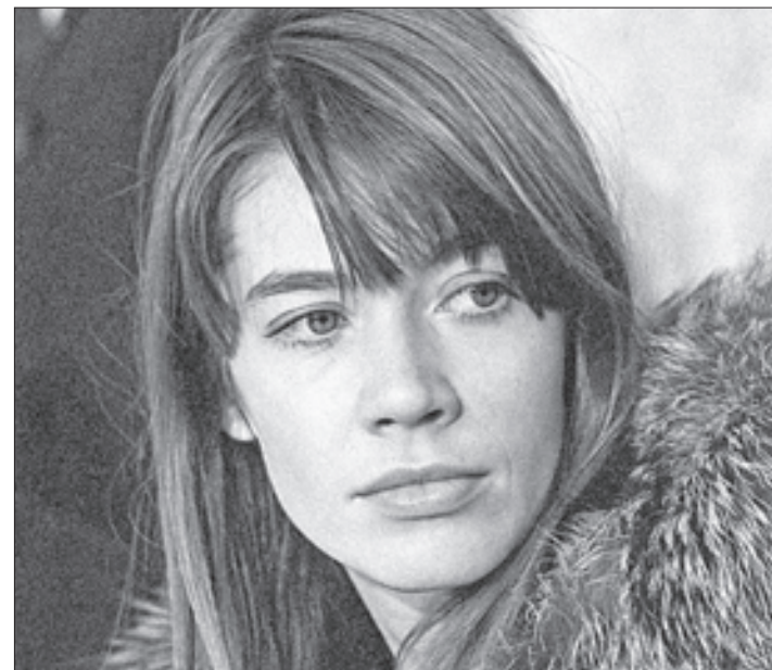
▲ La artista también fue un símbolo de la moda, un presagio de la esbeltez que inunda las pasarelas del mundo.

“La muerte sólo afecta al cuerpo. Al morir, éste libera el alma. Pero de todas formas la muerte del cuerpo es una prueba considerable, y le tengo miedo, como todo el mundo”, confesaba a Afp en 2018.