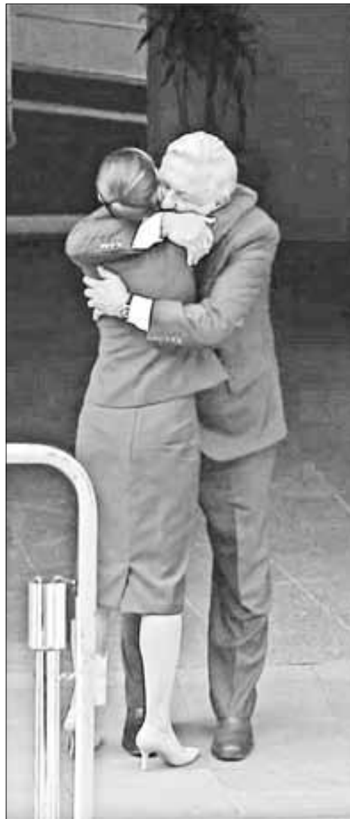
▲ La derecha intenta meter ruido con un “conflicto” inexistente entre Claudia Sheinbaum y Andrés Manuel López Obrador.

POR AHORA, LA perdedora derecha autóctona aprovechó el encuentro entre Sheinbaum y López Obrador en Palacio Nacional para meter ruido, intentar escalar un “conflicto” inexistente y desatar una ola de rumores con el fin de enfrentar a estos personajes, siempre con la idea de detener la urgente reforma constitucional al Poder Judicial, cuando en realidad entre ellos no hay desencuentro por el tema, sino, en todo caso, por los tiempos políticos en los que tal modificación debe evaluarse en el Congreso.