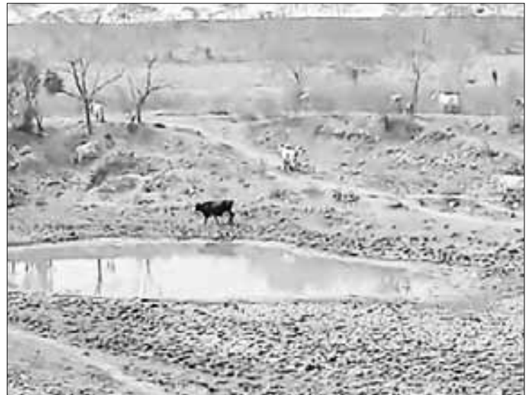
▲ Represa en el ejido Ojo de Agua, municipio de Ciudad Valles, San Luis Potosí, que se encuentra a 10 por ciento de su capacidad. Captura de video cortesía de Asociación Ganadera de Valles

haber un planteamiento a corto, mediano y largo plazos, con respaldos inmediatos, los cuales no remediarán los perjuicios, pero ayudarán a paliar el problema del agua.”