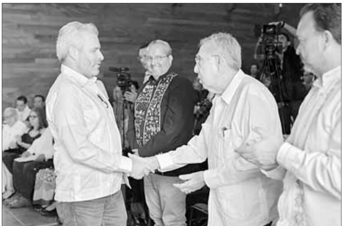
▲ El gobernador de Michoacán, Alfredo Ramírez Bedolla, ayer durante el homenaje al ingeniero Cuauhtémoc Cárdenas, en la sede del Centro de

Agregó que como pilar en la defensa de la soberanía nacional, la lucha contra la privatización de los recursos energéticos y la oposición a políticas neoliberales, el legado de Cárdenas sigue inspirando a las nuevas generaciones, por lo que enfatizó que “la lucha por México es una tarea continua que requiere esfuerzo, dedicación y amor por la patria y su gente”.