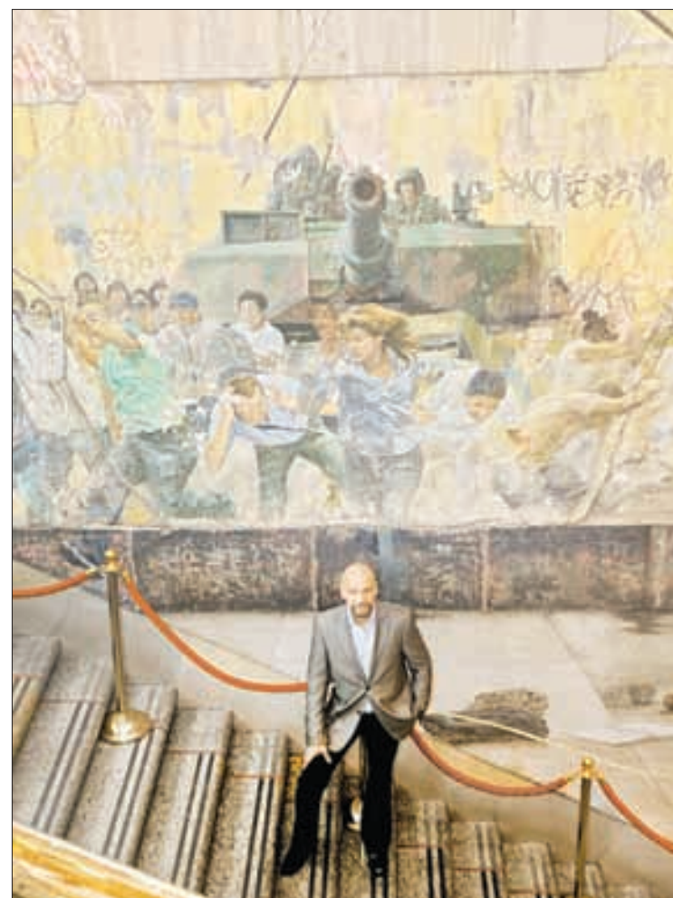
▲ Arriba, detalle del mural Un clamor por la justicia , que forma parte de Siete crímenes mayores , de Rafael Cauduro. Abajo, el artista durante la inauguración de su obra en julio de 2009.

La muestra Cauduro: la justicia y la pintura en México (Ocultamientos y Develaciones) está disponible en la página del repositorio digital Memórica. México, haz memoria: https://memoricamexico.gob.mx/es/memoria/Rafael_Cauduro