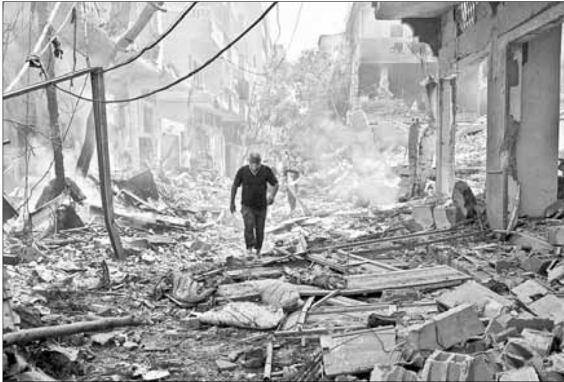
▲ El bombardeo de las fuerzas especiales israelíes en el campamento de Nuseirat dejó la zona reducida a escombros.

Al Aqsa declaró a The Independent : "Respecto a lo que ocurrió aquí, según la ocupación, liberaron a cuatro rehenes y continuaron bombardeando agresiva y violentamente Gaza, hasta el punto en el que el número de mártires esparcidos en las calles llegó a 150 sin que nadie fuera capaz de detenerlos, hasta que terminó su operación militar.