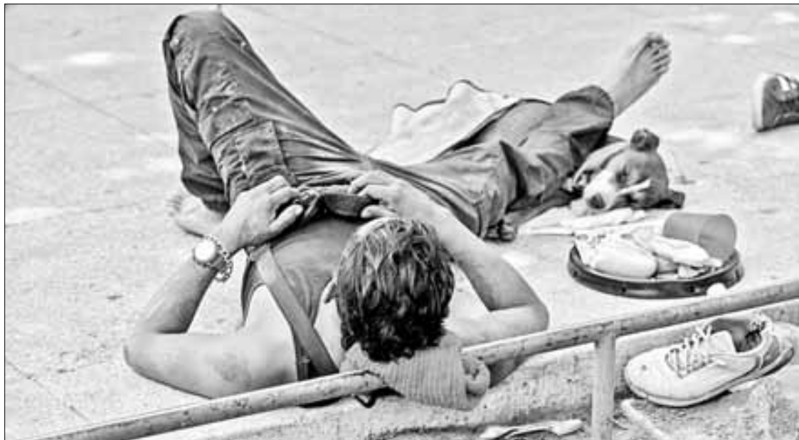
▲ Un indigente y su fiel compañero descansan en la avenida Juárez.