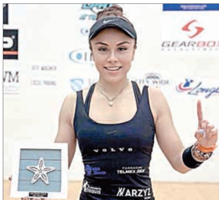
▲ "Estoy muy contenta por haber regresado a la victoria", dijo la potosina de 34 años.

En comparación con los Olímpicos Tokio 2020, para París, México no asistirá con equipo completo, debido a que sólo se consiguieron 10 de 12 plazas disponibles, faltando un boleto en el trampolín femenino individual y en sincronizado.