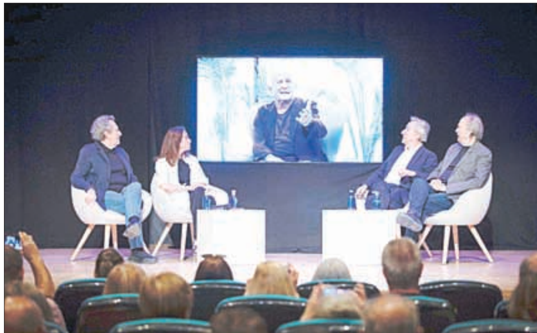
▲ Encuentro entre Ana Belén, Joan Manuel Serrat, Víctor Manuel y Miguel Ríos para conmemorar la gira de El gusto es nuestro, el cual fue moderado por el periodista Iñaki Gabilondo. El Palacio de Congresos de Granada albergó ayer la reunión de las cuatro leyendas de la música española, quienes compartieron anécdotas y experiencias que han marcado sus carreras.

Mezcal, categoría que reconoce lo mejor en largometrajes de ficción y documentales mexicanos.