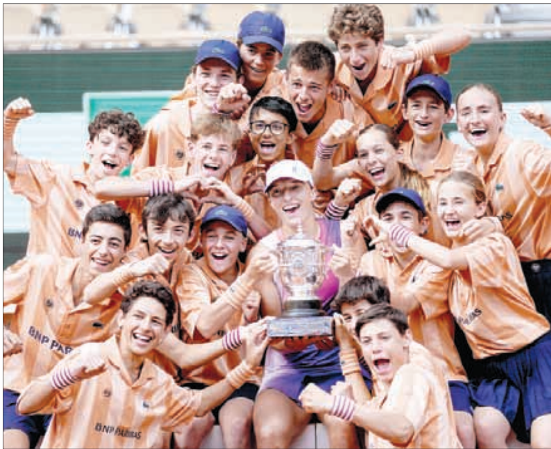
▲ La polaca, en una muestra de sencillez y carisma, celebró su hazaña con los recoge pelotas del torneo.

Lo de Iga es ya un póker en París, cinco grandes, sólo 23 años y un dominio tan abrumador de la superficie que tal vez no sea tan