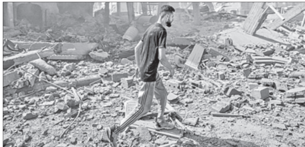
▲ Un palestino inspecciona los escombros de unos edificios tras un ataque de las fuerzas

¡LO LEO Y no lo creo! ¿Es posible que el jázaro JS haya engañado al director de la CIA?