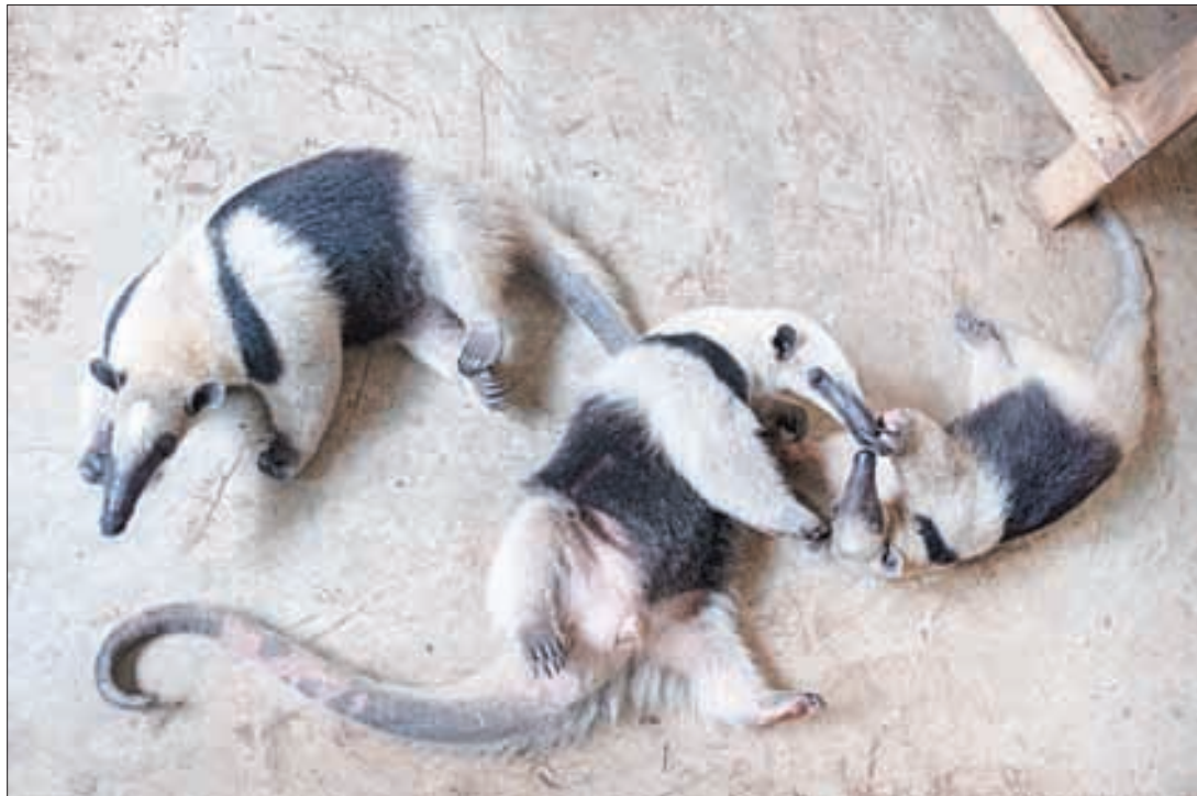
▲ Los animales en cautiverio también sufren los estragos del clima por lo que en el parque ecológico Selva Tenek en San Luis Potosí, osos hormigueros retozan a la sombra.