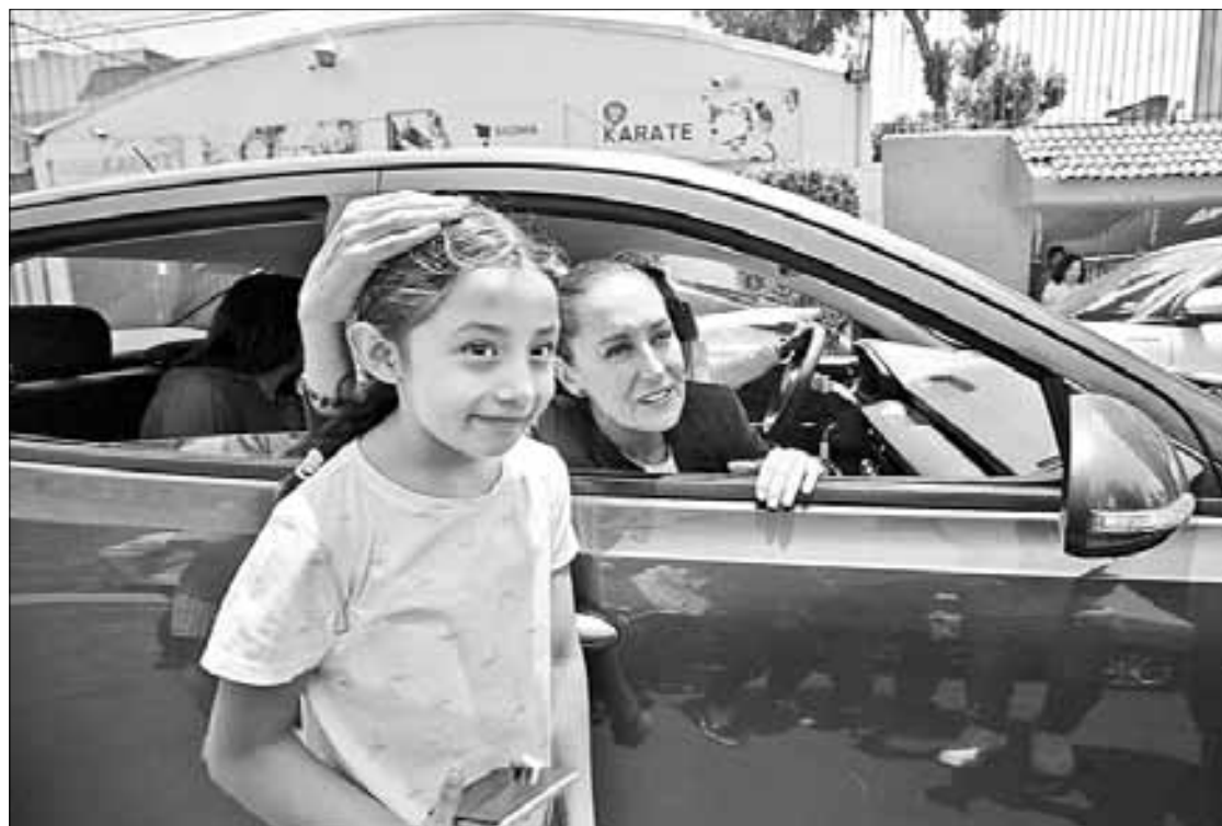
◀ Claudia Sheinbaum, a su salida ayer de la casa de transición en la alcaldía de Iztapalapa.

Y sobre la frase que ha mencionado la futura mandataria, respecto a que no llega sola, sino que llegamos todas, consideró que no es una mención vacía, sino “el compromiso que hace de representarnos a todas”, y que “tiene clarísimo” que este triunfo electoral, que por primera vez en dos siglos de vida republicana pone en la Presidencia a una mujer “es producto de la lucha social y política del sector femenino en México; ella habla de nuestras ancestras, de las forjadoras de la patria”.