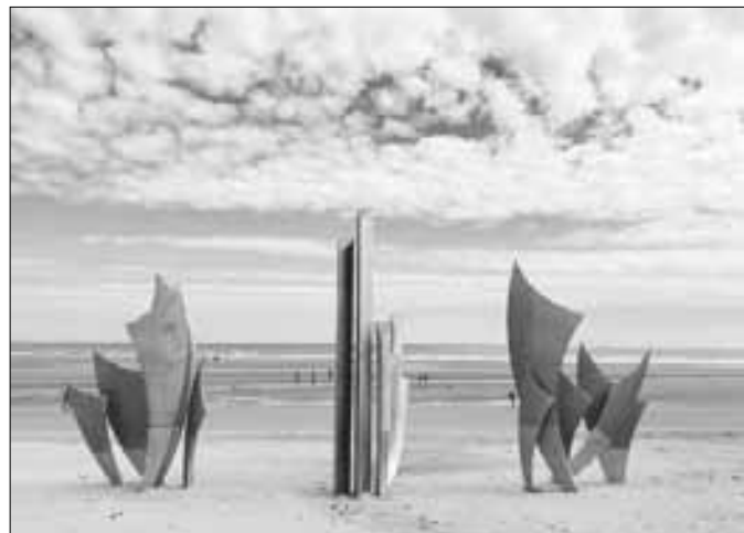
▲ La obra está en la playa Omaha, escenario en 1944 del histórico desembarco de Normandía.