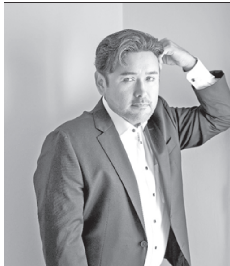
▲ El tenor mexicano conocido como el rey de los Do de pecho.

“Lo más emocionante para mí de esta temporada será cantar Romeo en el Teatro San Carlos de Nápoles y conocer nuevos públicos en tres maravillosos recintos de ópera. Es una emoción extra, porque hasta donde yo tengo entendido, jamás se ha cantado la ópera Romeo y Julieta de Gounod en ese espacio, por lo que será un estreno absoluto de esa obra en Nápoles, a lo que se suma, en lo personal, que también será la primera vez que yo visite esa ciudad y ese teatro”, concluyó.