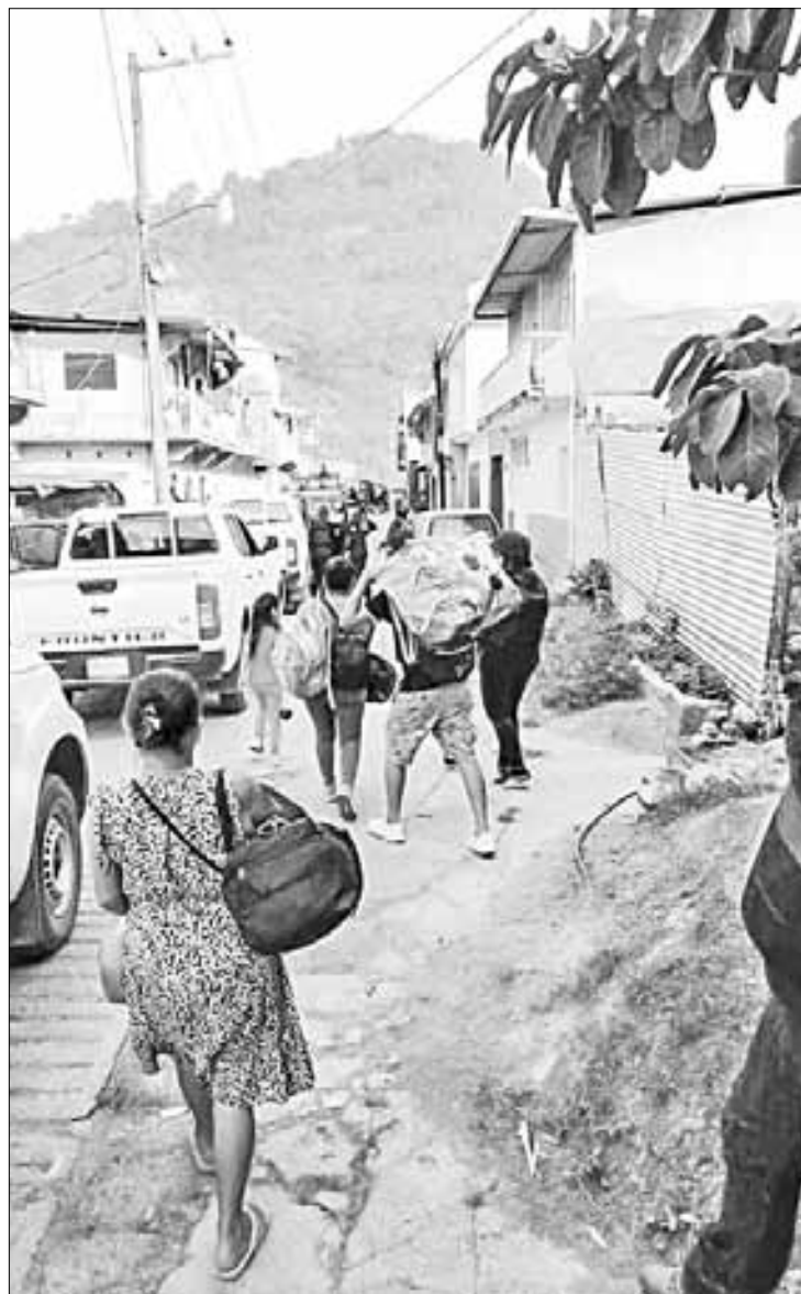
▲ Tras la llegada de fuerzas federales y estatales a Tila, Chiapas, ayer, luego de balaceras entre bandas delictivas, pobladores se dirigieron hacia la comunidad de Petalcingo y al municipio de Yajalón, donde las autoridades instalaron refugios temporales.

Estas personas estaban dando seguridad al pueblo sin perjudicar a nadie, sólo estaban cumpliendo su obligación y deber como ejidatarios. A las 20 horas del mismo