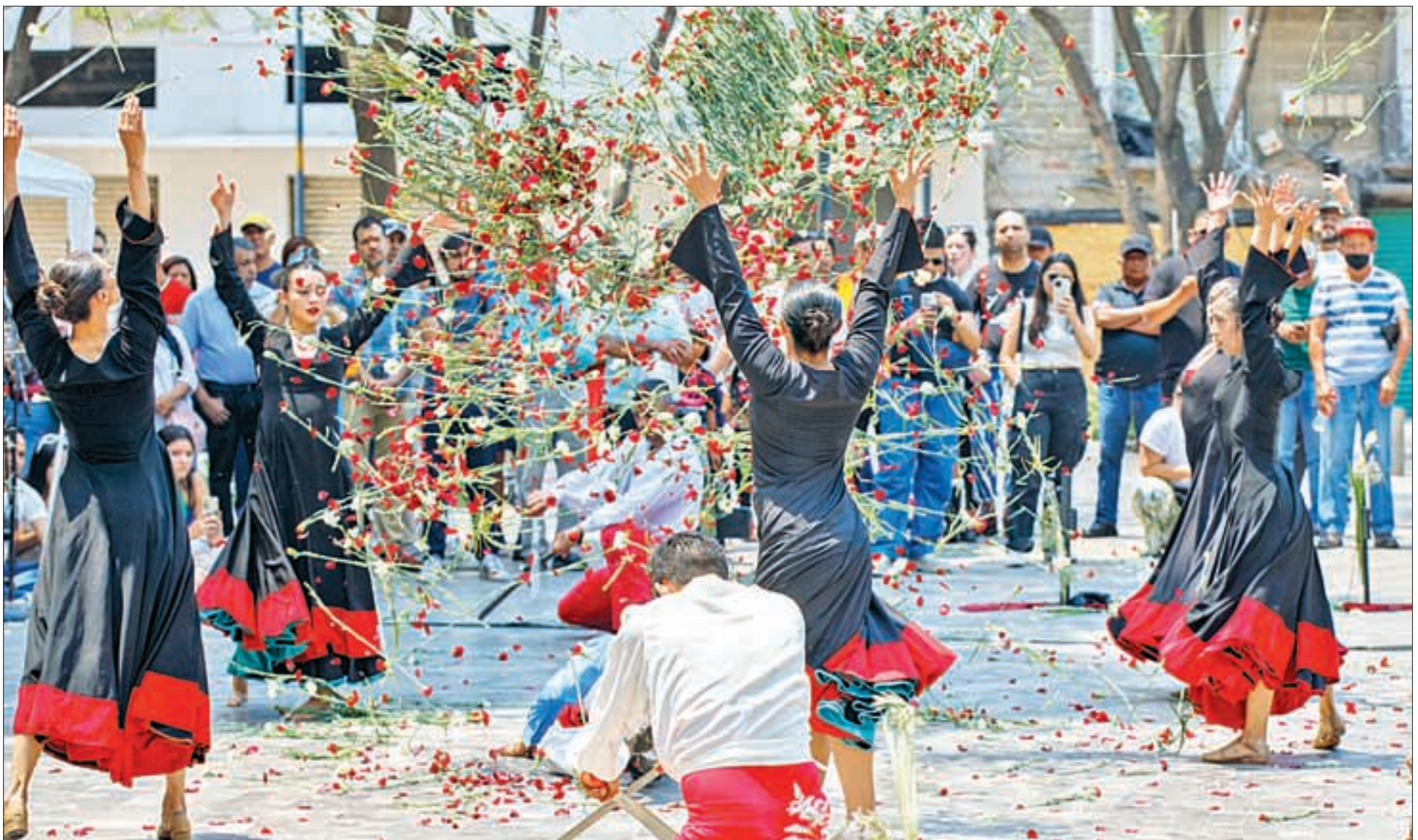
LA PUESTA EN escena Viento de Lorca , propuesta coreográfica que aborda temas recurrentes en la obra del poeta y dramaturgo español Federico García Lorca, como el amor, la muerte, la lucha social y la identidad, a cargo de la compañía Barro Rojo Arte