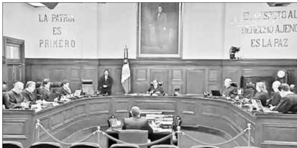
▲ “Es hasta vergonzoso, pero hay ministros que son empleados de las grandes

Twitter: @cafevega cfvmexico_sa@hotmail.com