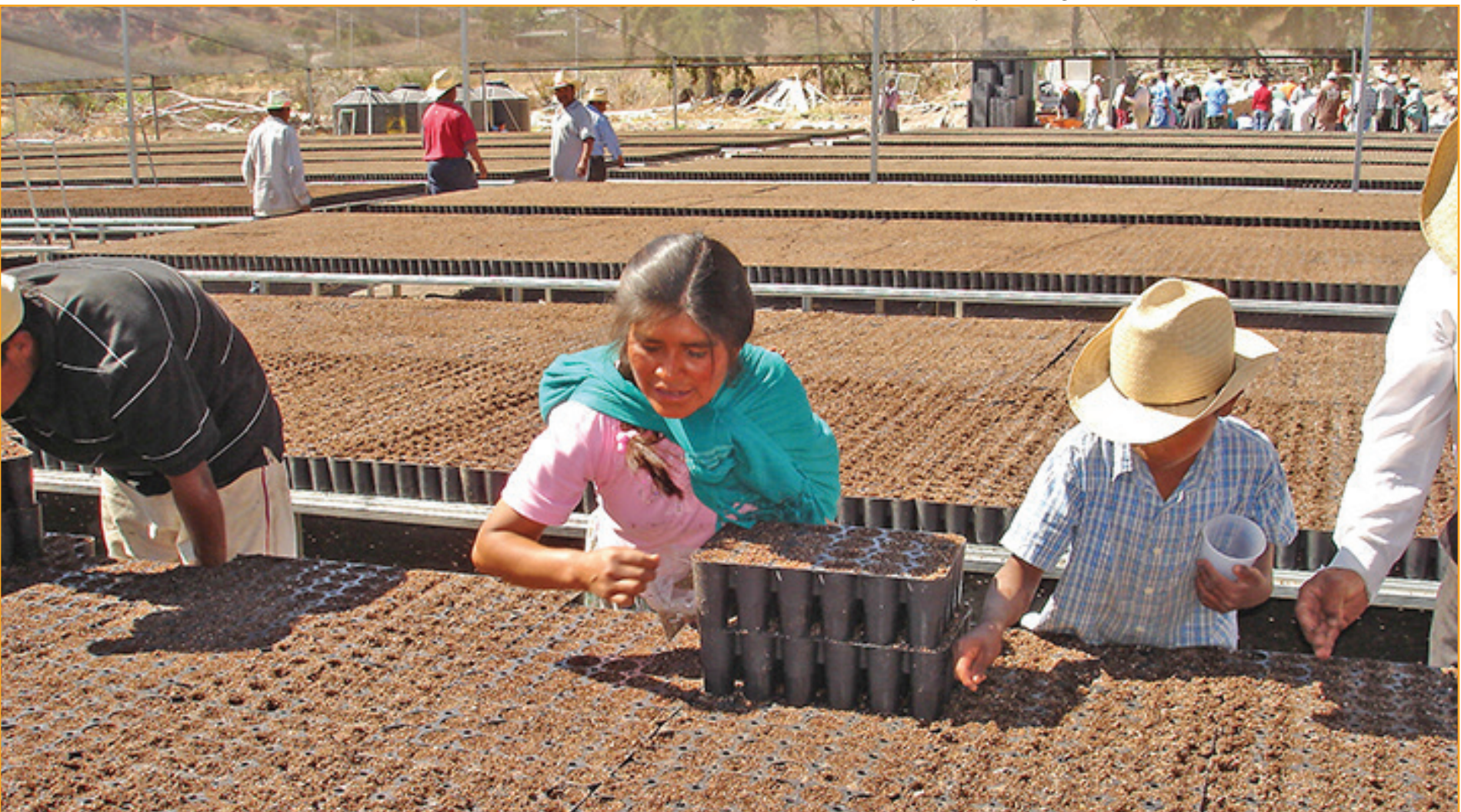
Abajo: campesinos organizados sembrando en vivero tecnificado