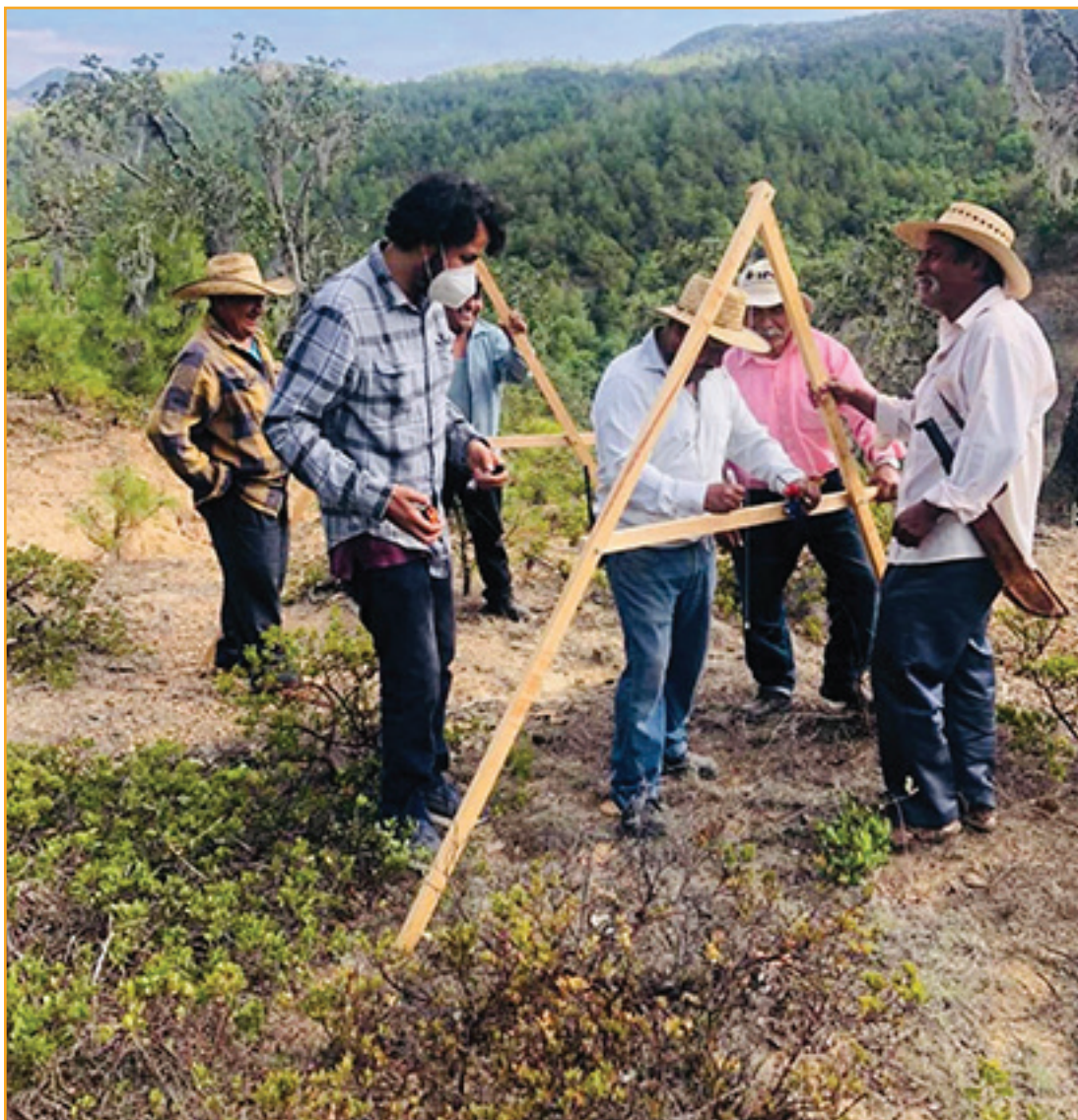
Los señores también participan...

Si bien se permite la participación de algunos hombres, se ha incentivado prioritariamente el involucramiento de las mujeres.