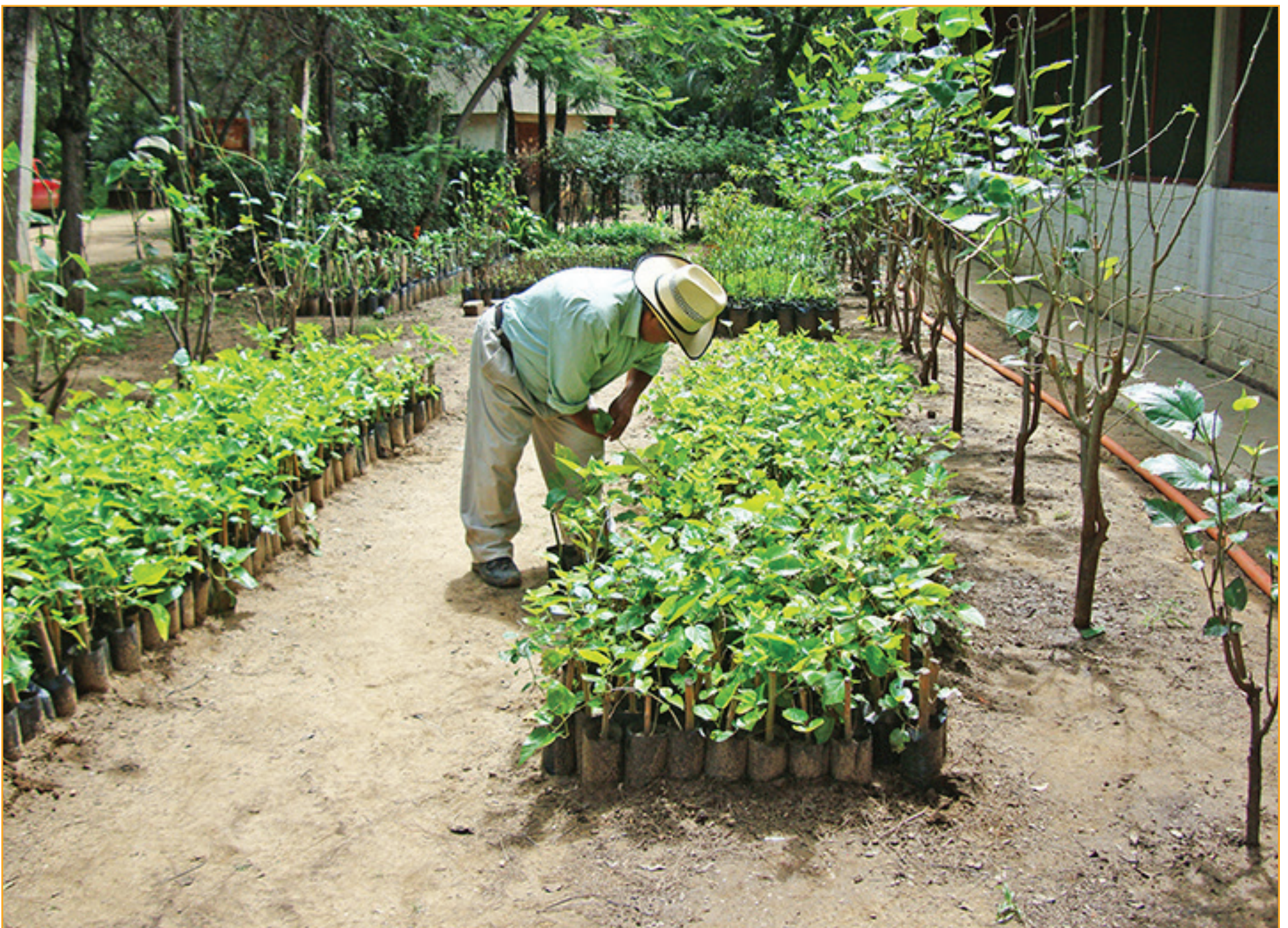
Plantas de mora para la sericicultura

Otro rubro es la obtención de madera de los árboles de jacaranda, yagalán y de naranjo para la elaboración de utensilios.