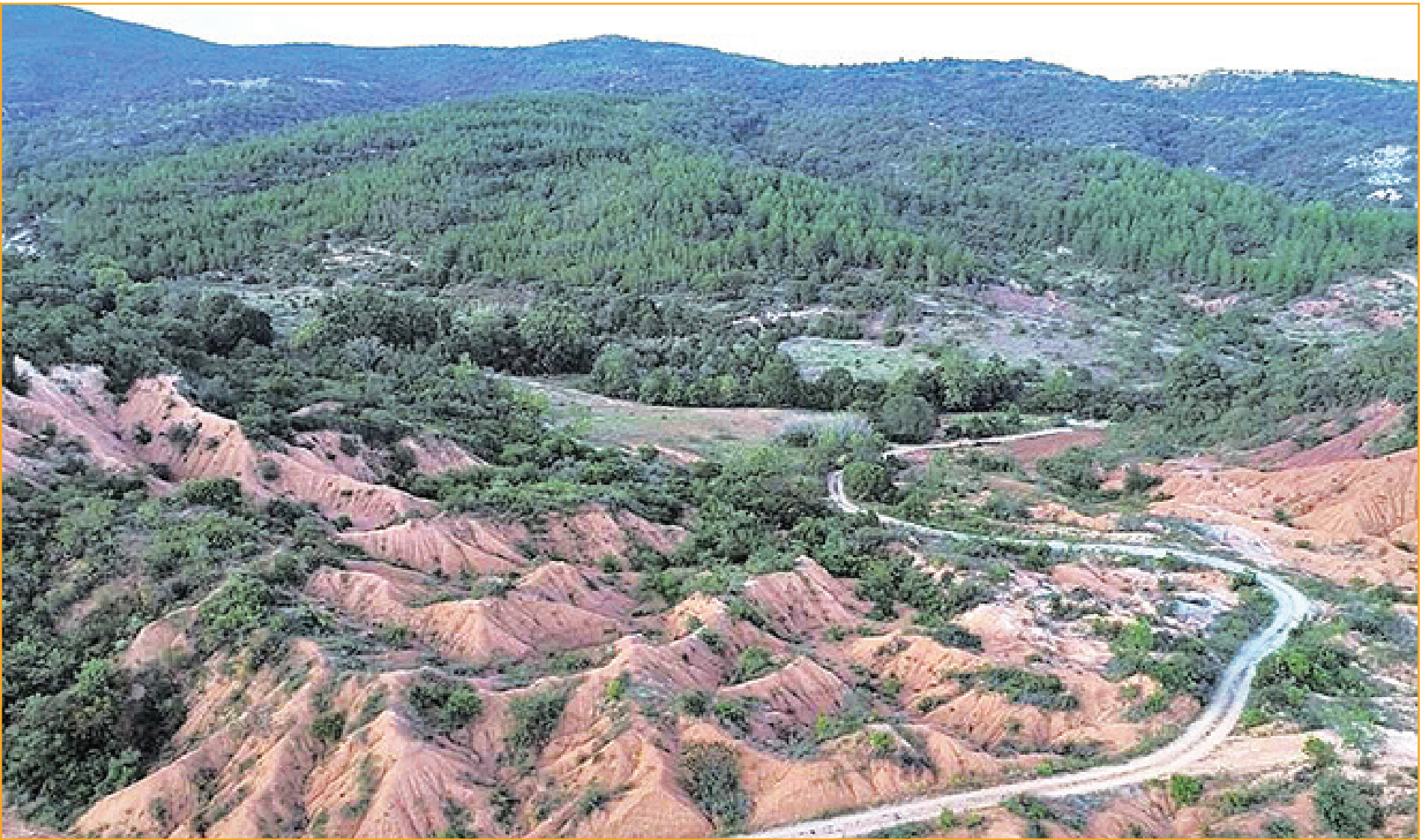
Arriba: recuperación forestal en la Mixteca. Abajo vemos los resultados en áreas recuperadas