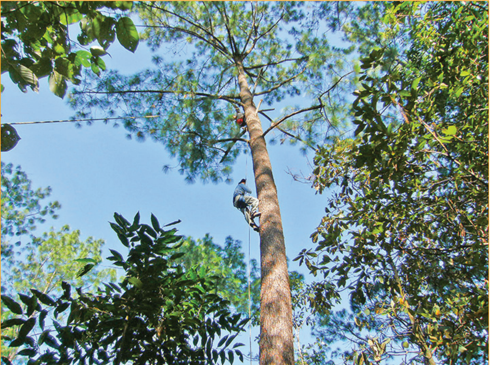
Arriba: recolección de germoplasma. Abajo vemos parte del equipo del banco de germoplasma

características fisiográficas y culturales, así como su organización. Se requirió estratificar los diferentes trabajos de reforestación, de acuerdo con cada una de las regiones de la entidad.