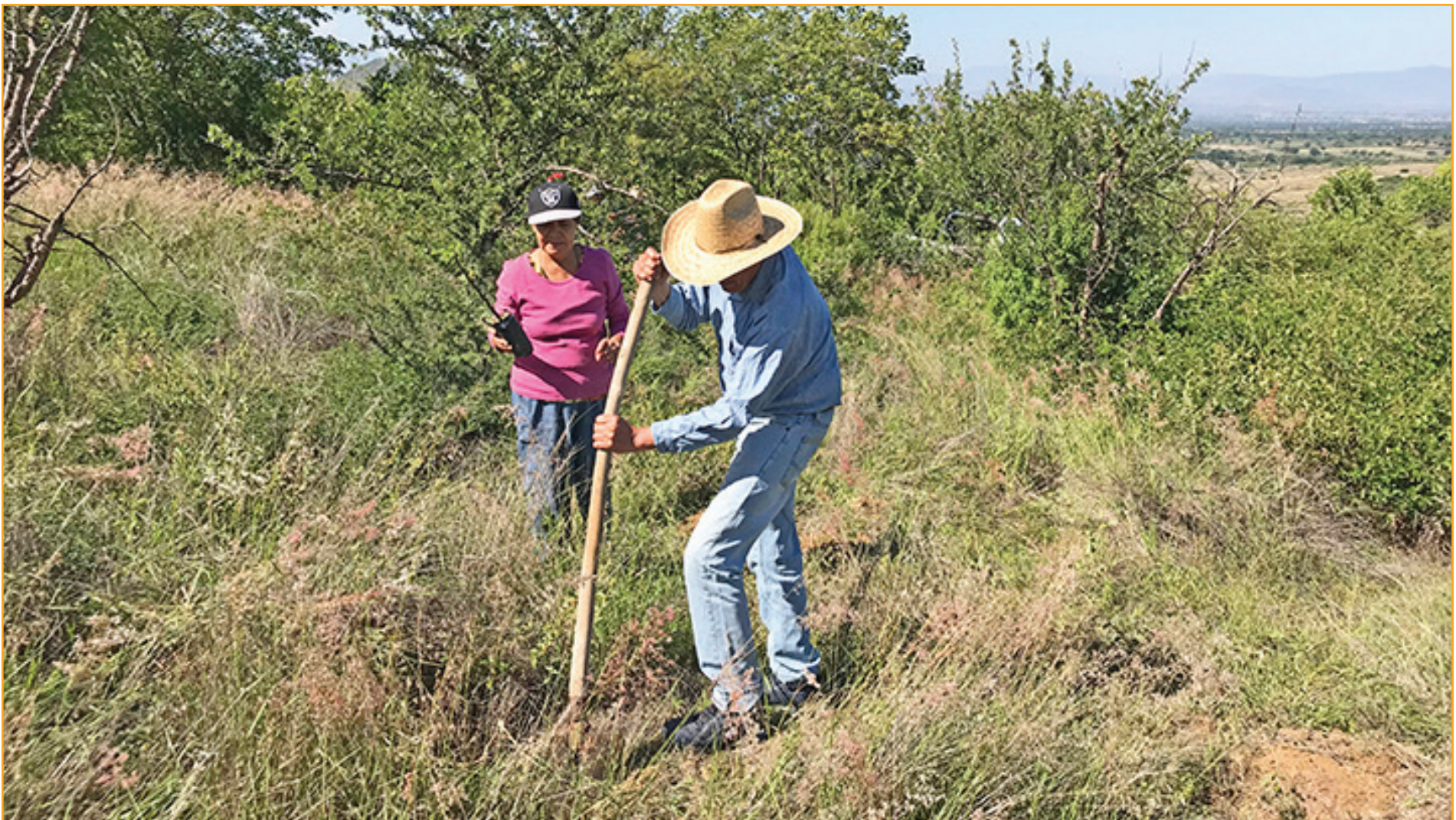
Toda la comunidad colabora para la siembra del copal para los futuros alebrijes de San Martín Tilcajete