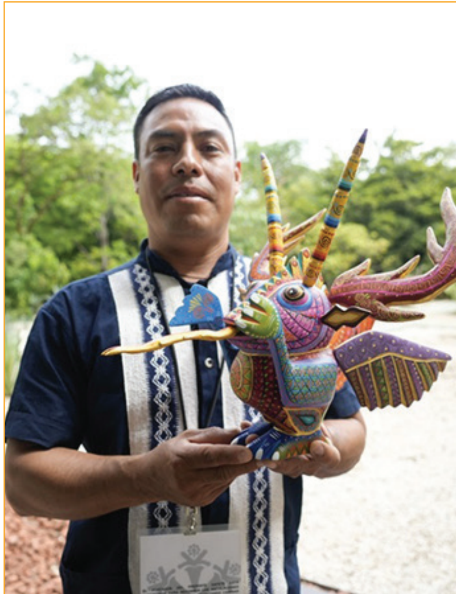
Foto promocional de la Expo Venta de Alebrijes Guelaguetza 2024 del gobierno del estado de Oaxaca