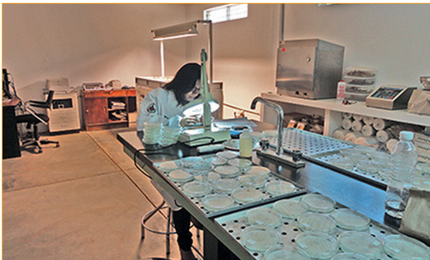
Trabajos en el banco de germoplasma

En la planificación se contaba con los estudios de las 16 Umafores (Unidades de Manejo Forestal) en que está dividido el territorio estatal, lo que nos permitió identificar las diferentes necesidades de reforestación en la entidad, tomando en cuenta sus