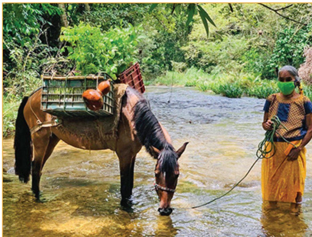
Arriba: reforestación en zonas ribereñas. Abajo: el déficit de plantación es enorme...

El "Proyecto de Reforestación Social en Oaxaca" ha demostrado ser un modelo efectivo de participación comunitaria y conservación de la biodiversidad. Sin embargo, para abordar el reto de la deforestación de manera integral es necesario incorporar innovaciones tecnológicas y fortalecer la gobernanza local.