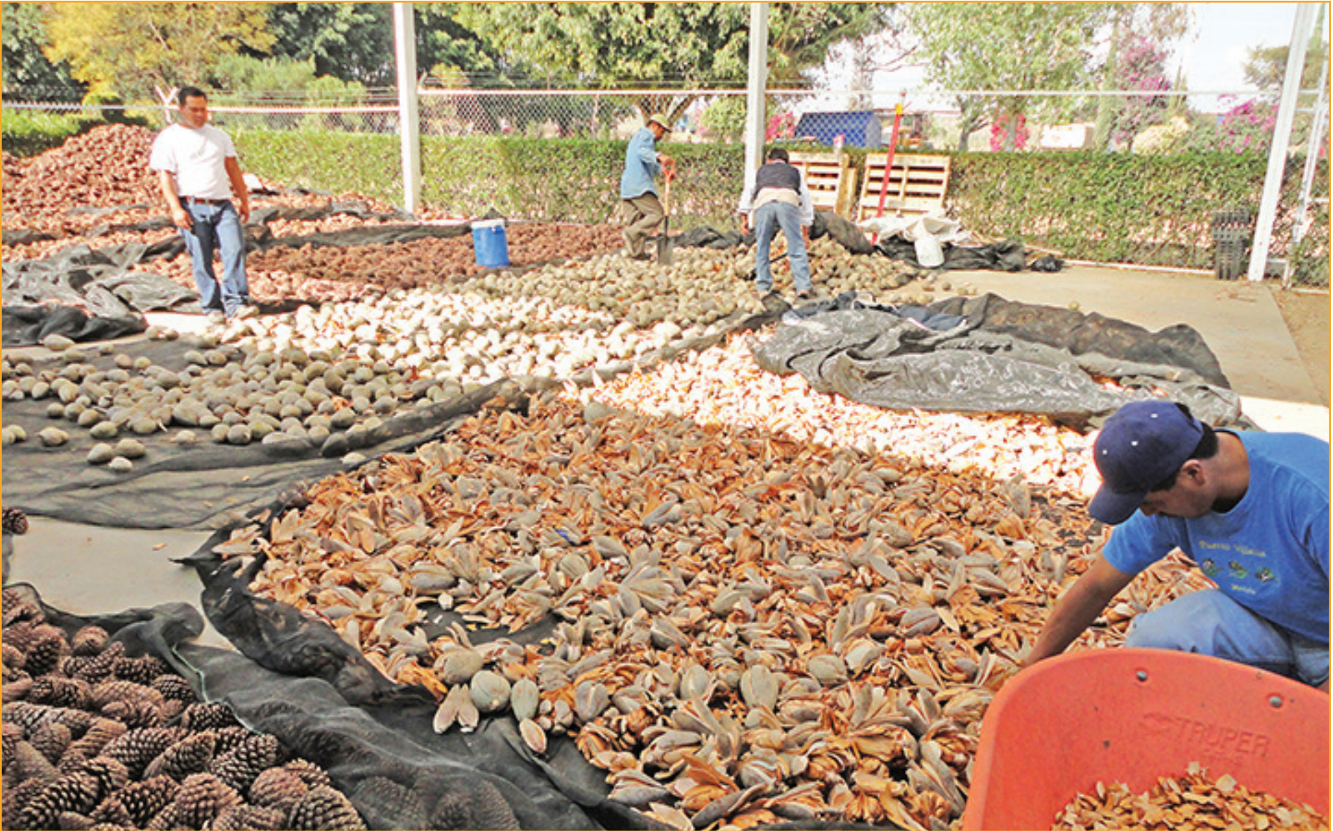
Arriba: selección de semillas.