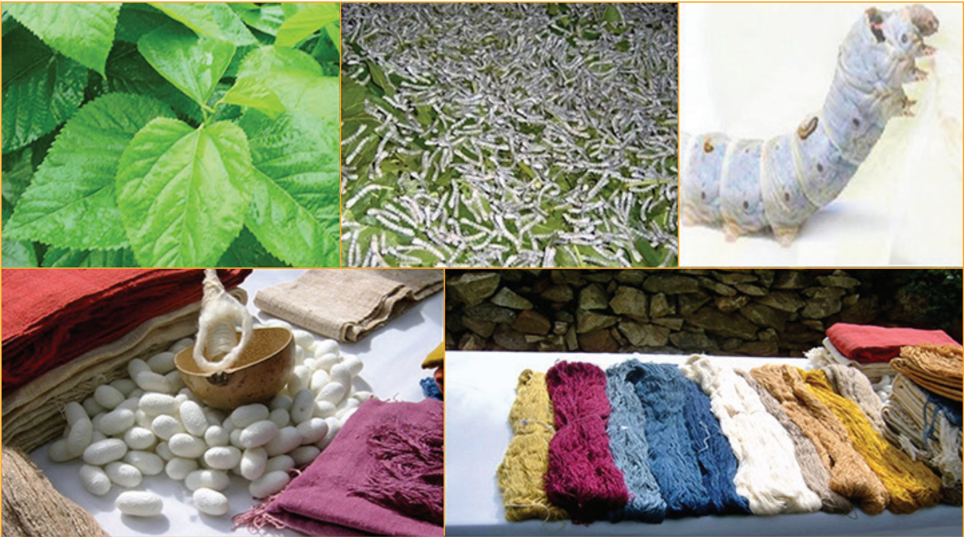
Arriba: los insumos para la producción de seda. Abajo: artesanas recibiendo pies de cría de gusanos de seda