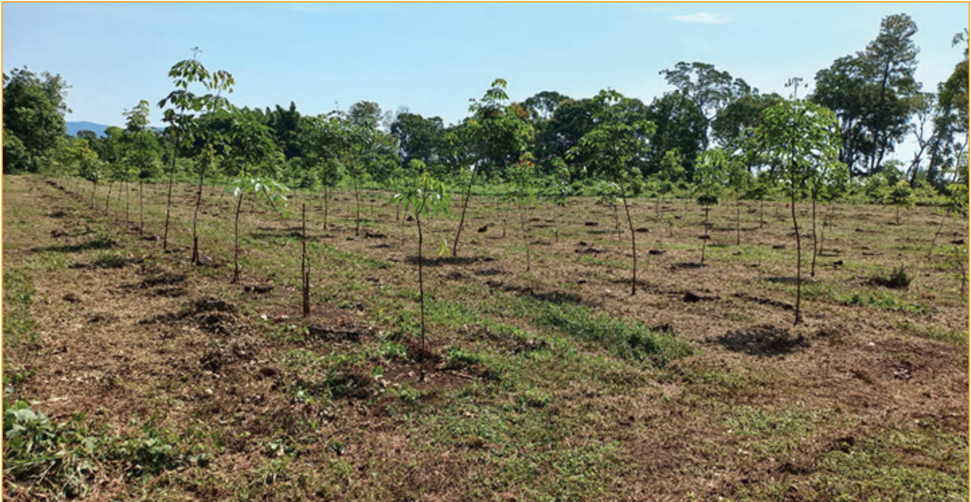
Plantaciones de hule. Y abajo vemos los pasos para procesar el látex

La producción de hule en Oaxaca derivada de este proyecto en su momento contribuyó a fortalecer la industria nacional al reducir la dependencia de importaciones y generar una cadena de suministro más sólida y competitiva.