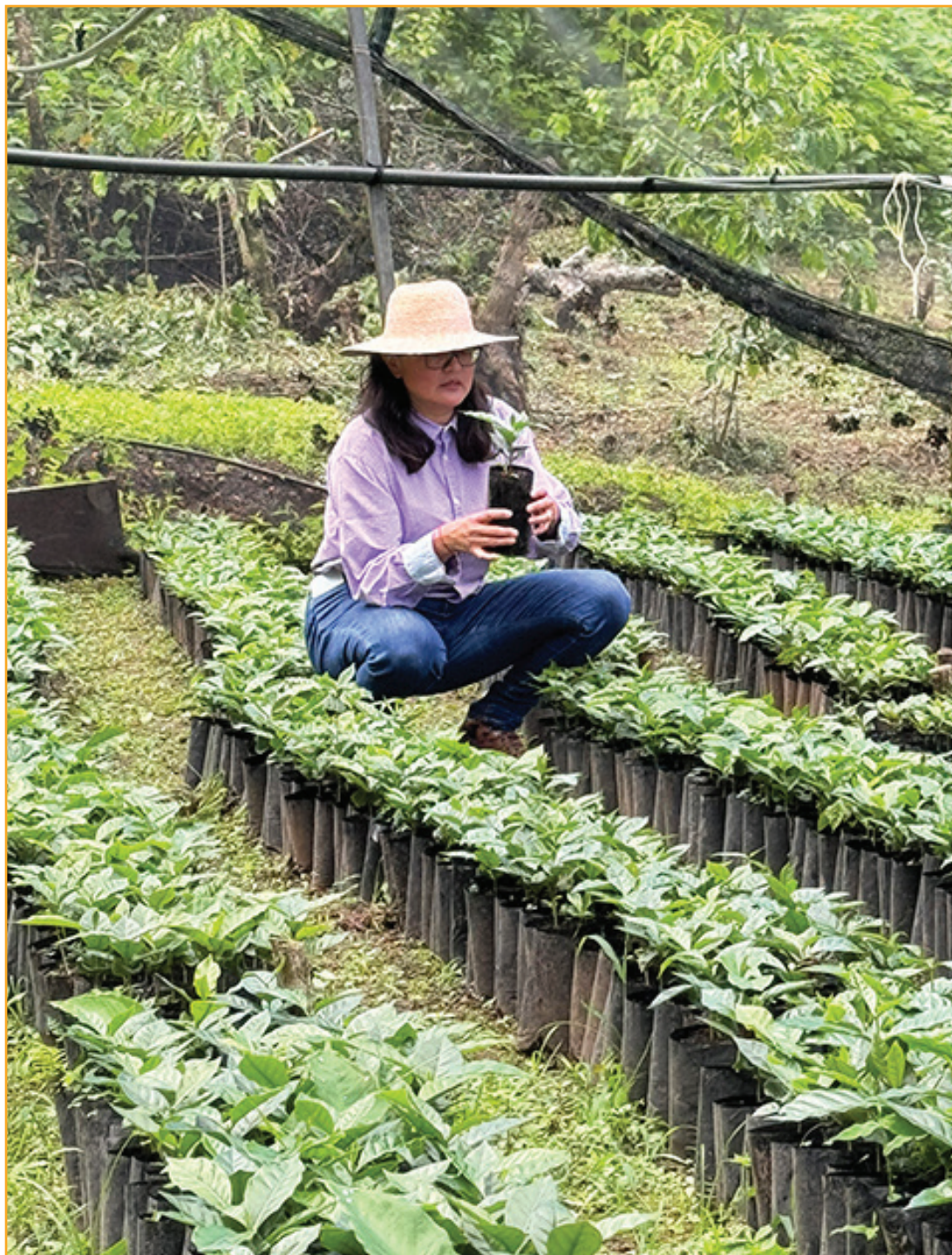
Trabajos en un vivero tradicional

También la diversificación productiva (incluyendo la participación de grupos vulnera-