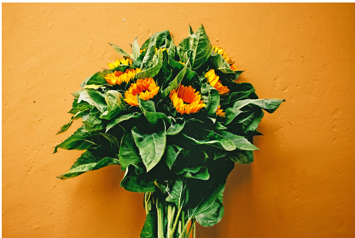
Girasoles. Coscomatepec, Veracruz.