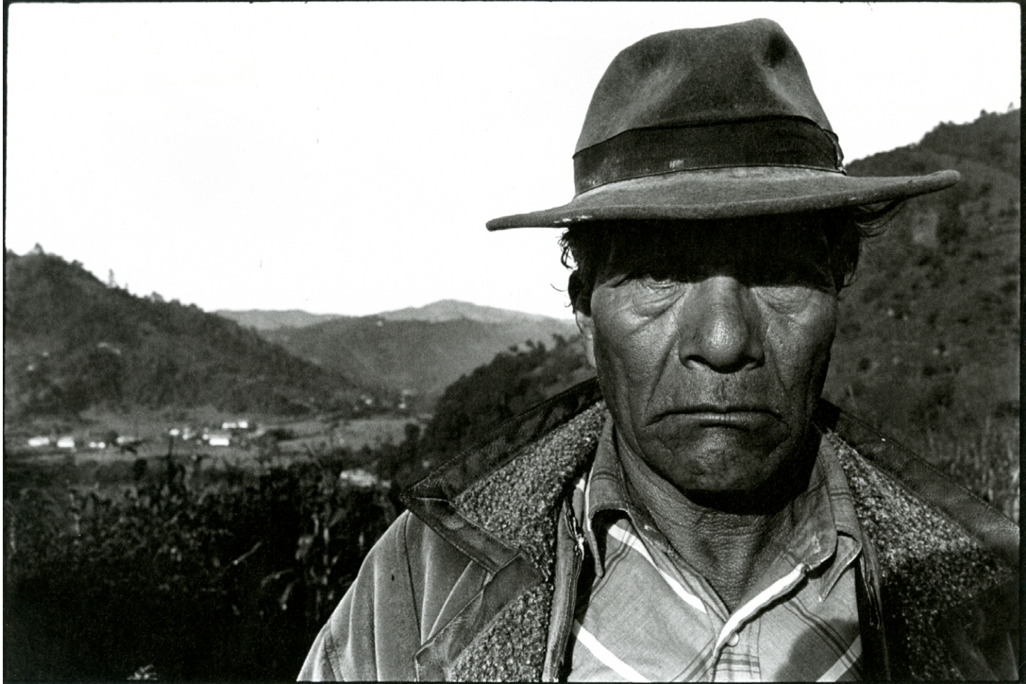
Hombre maya-kanjobal, Paykonob, Guatemala.