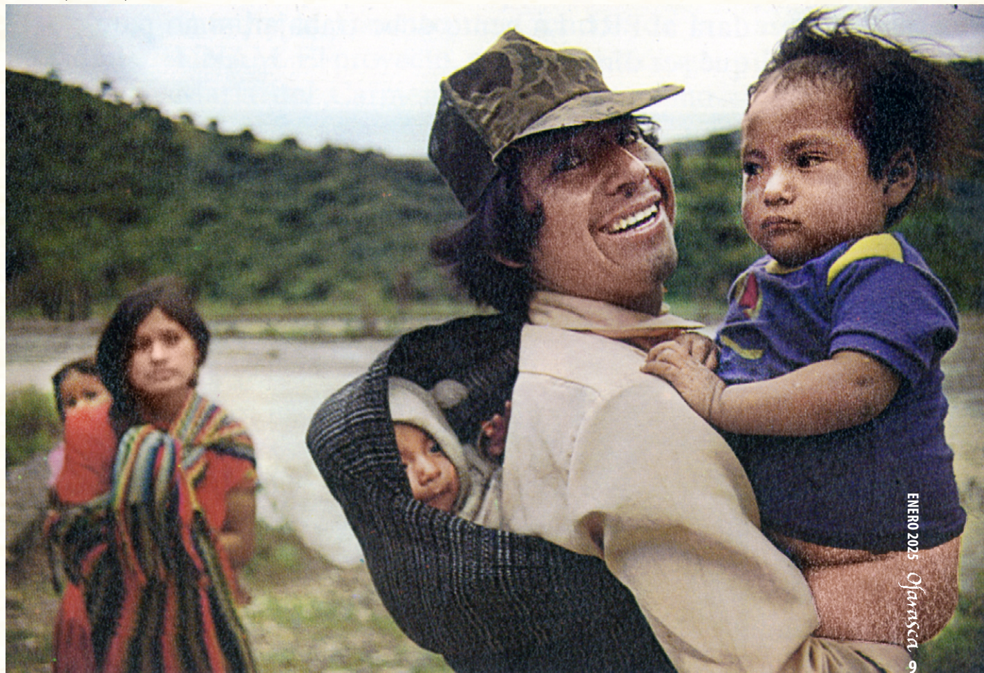
Alcozauca, Guerrero, 1989.

México Indígena, Nueva Época, número 2, noviembre de 1989