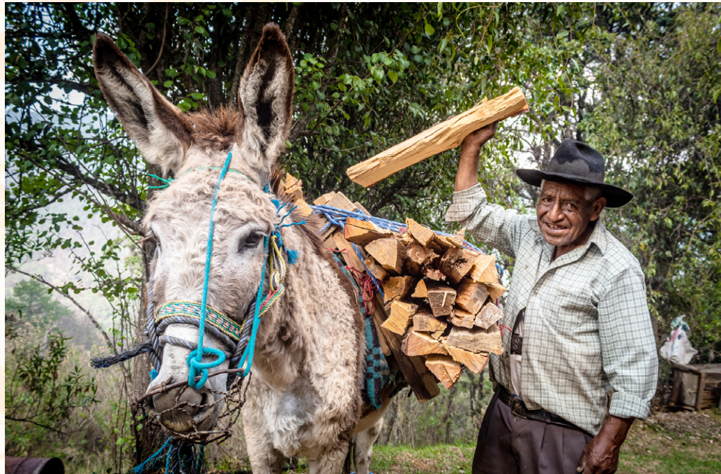
Pueblos Mancomunados, Oaxaca, 2024.