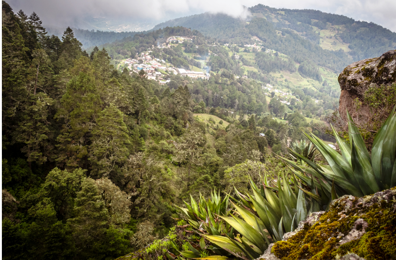
Benito Juárez, Oaxaca.