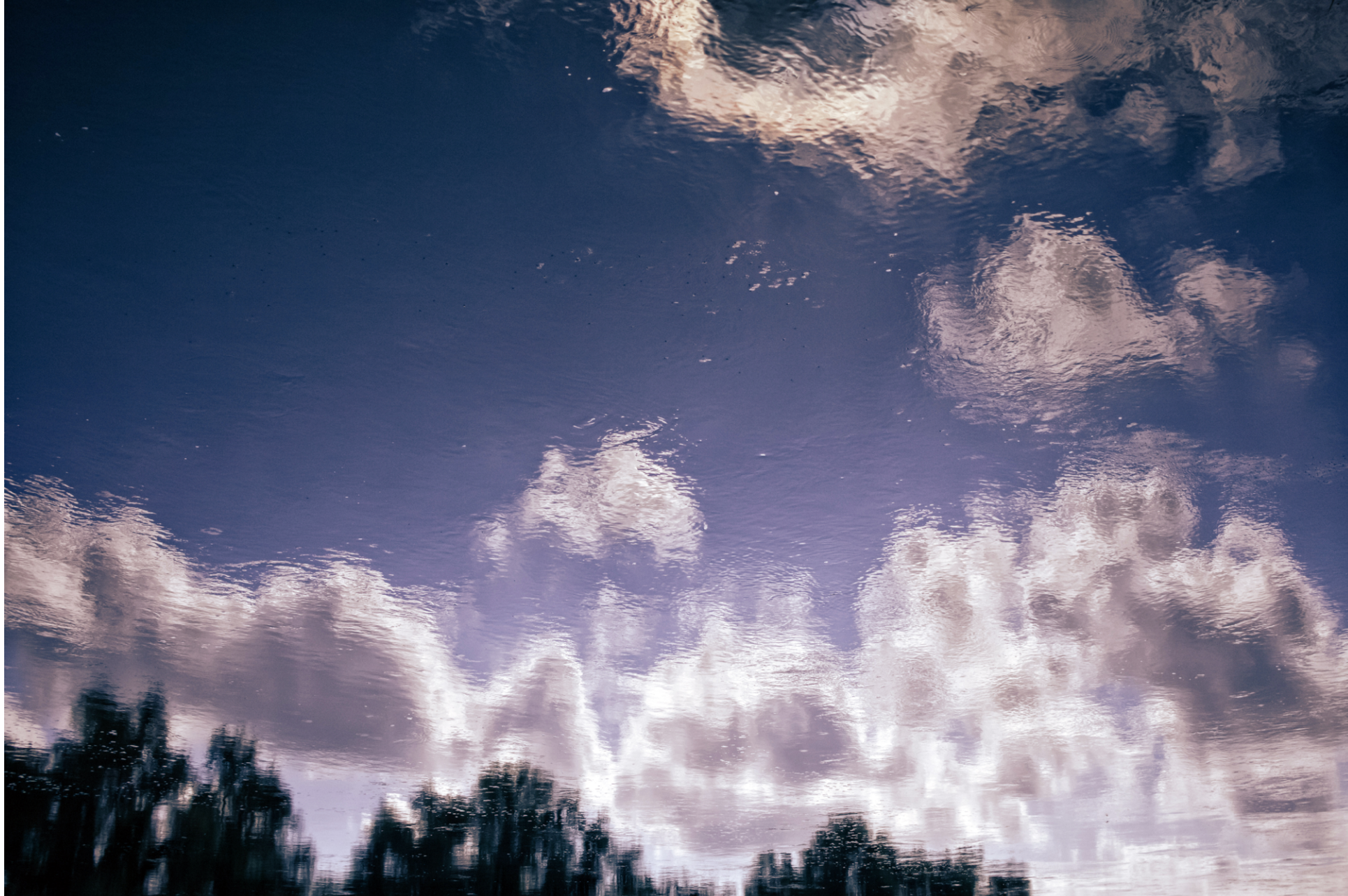
Reflejo. Entabladero, Veracruz, 2024.