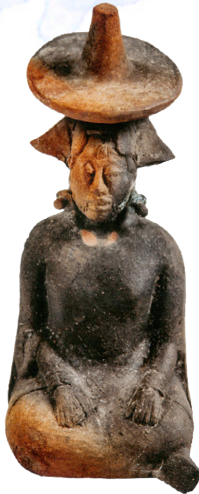
Figura de una mujer con sombrero, cerámica modelada, Isla de Jaina, Campeche

Tu tséel a k'áanche'il nojochchaj in tuukul, ta ts'akaj u k'oja'anil in pixanil yéetel u kili'ichil mokt'aan, sawal t'aanil ta k'exil in muk'yaj tu táan Yuum iik', ta púustaj u yiik'al in luba'an óolal yéetel u muut siipche', nupbil ta beetil in náay tu yóol a yuumtsilil.