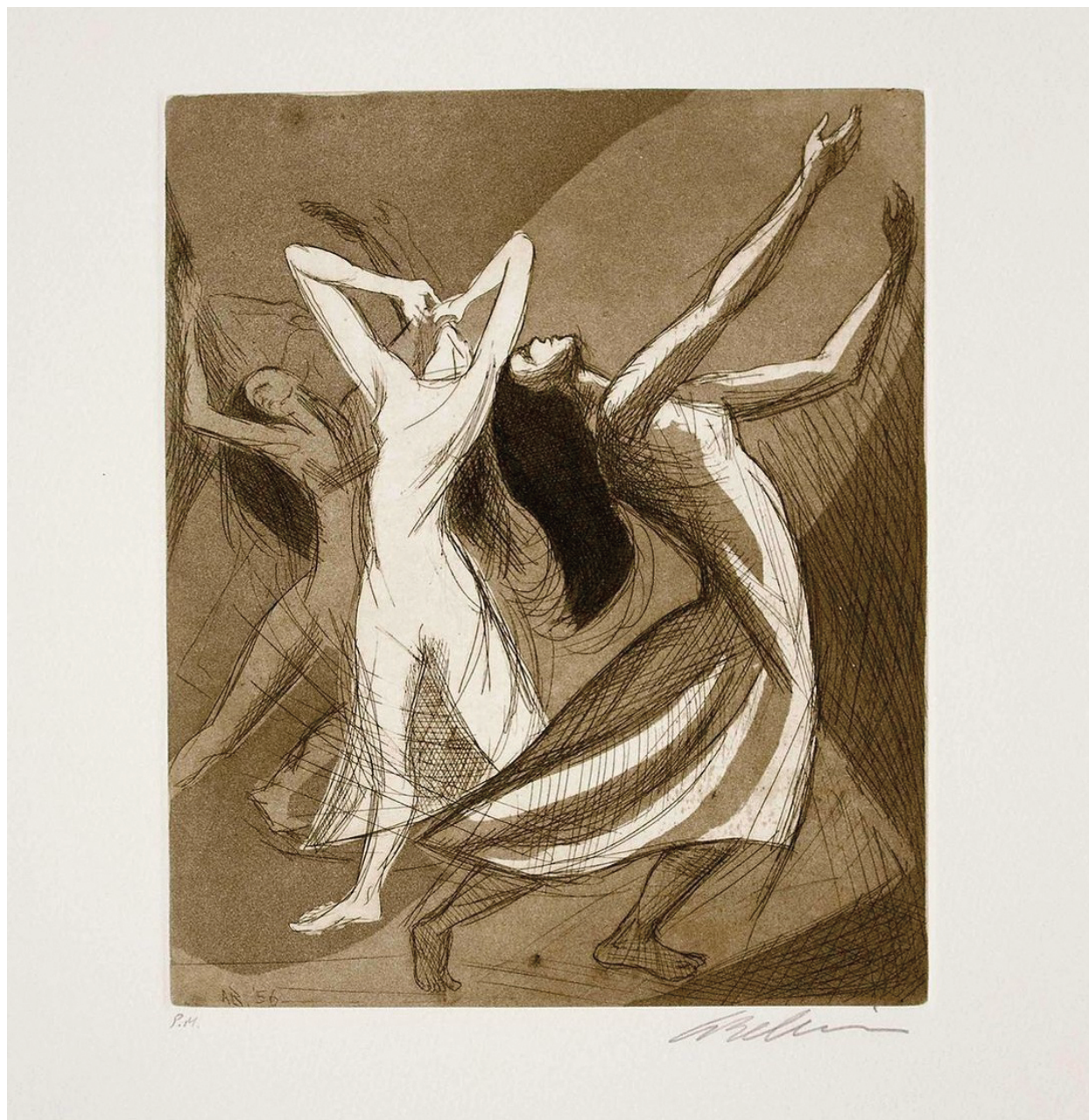
Grabado de Arnold Belkin, Museo Nacional de la Estampa

Está conformada por diez relatos, con numerosos personajes y voces. "Bájate", "Cobarde" y "El silencio" tienen como protagonista a Sergio, primo y objeto de deseo de Pablo. El primero es un relato más anecdótico, acerca del pasado del personaje; el segundo una carta dedicada a Pablo, donde le pide perdón por haberlo traicionado en el pasado; y el último una reconstrucción hecha por Pablo acerca de los últimos momentos de vida de Sergio. "Árboles secos" y "Piel de gallina" son historias que tienen