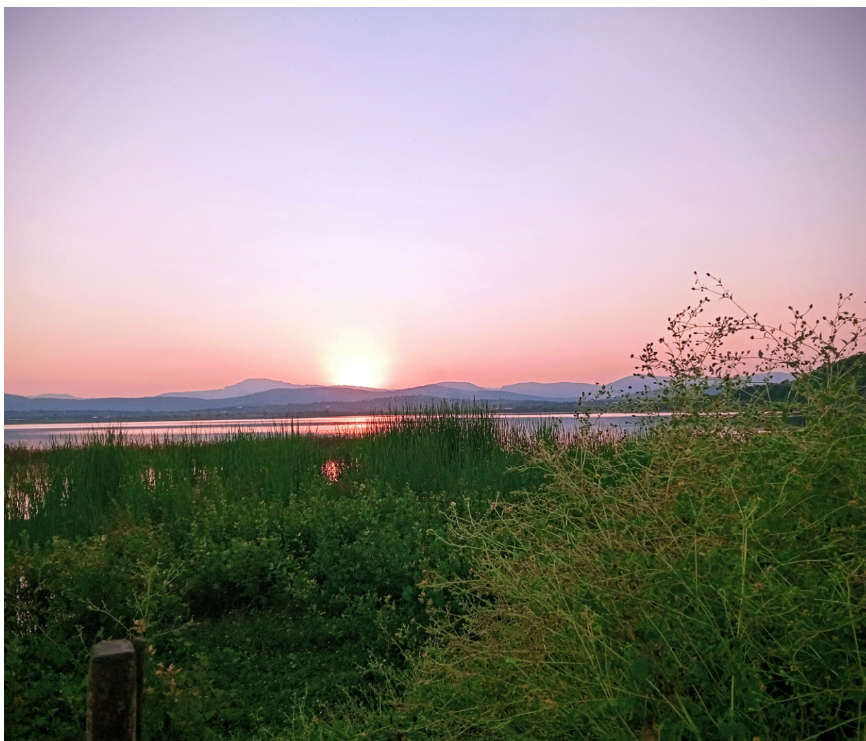
Atardecer en Coatetelco, Morelos, 2024.