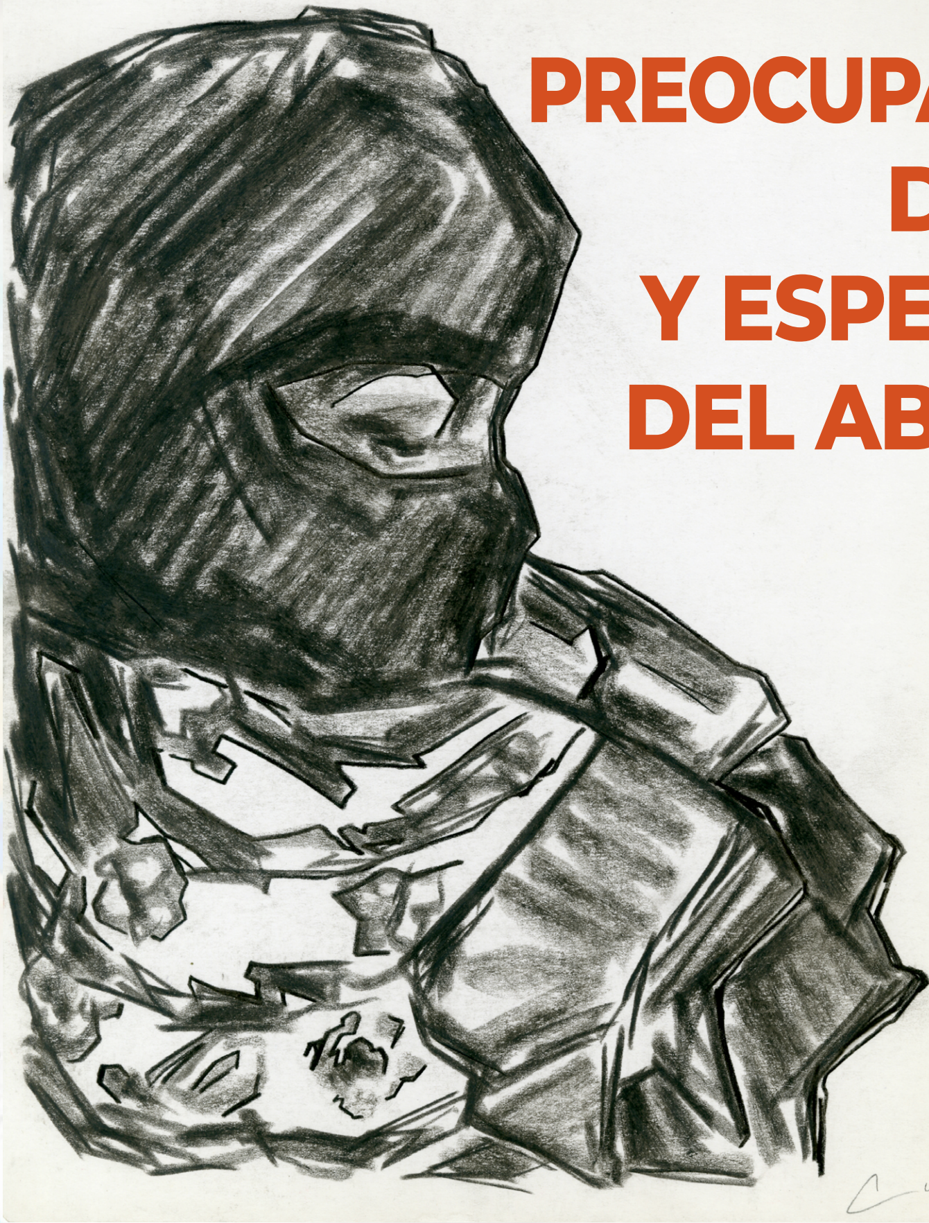
Dibujo al carbón de Arhat Monter Cid

Feministas de Abya Yala resumen en carta algunas de las luchas en los territorios de la región encabezadas por mujeres en defensa de la tierra, el agua, los derechos y la autonomía de los pueblos, frente a las distintas formas de violencia.