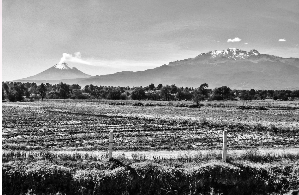
Popocatepetl y Iztazihuatl.