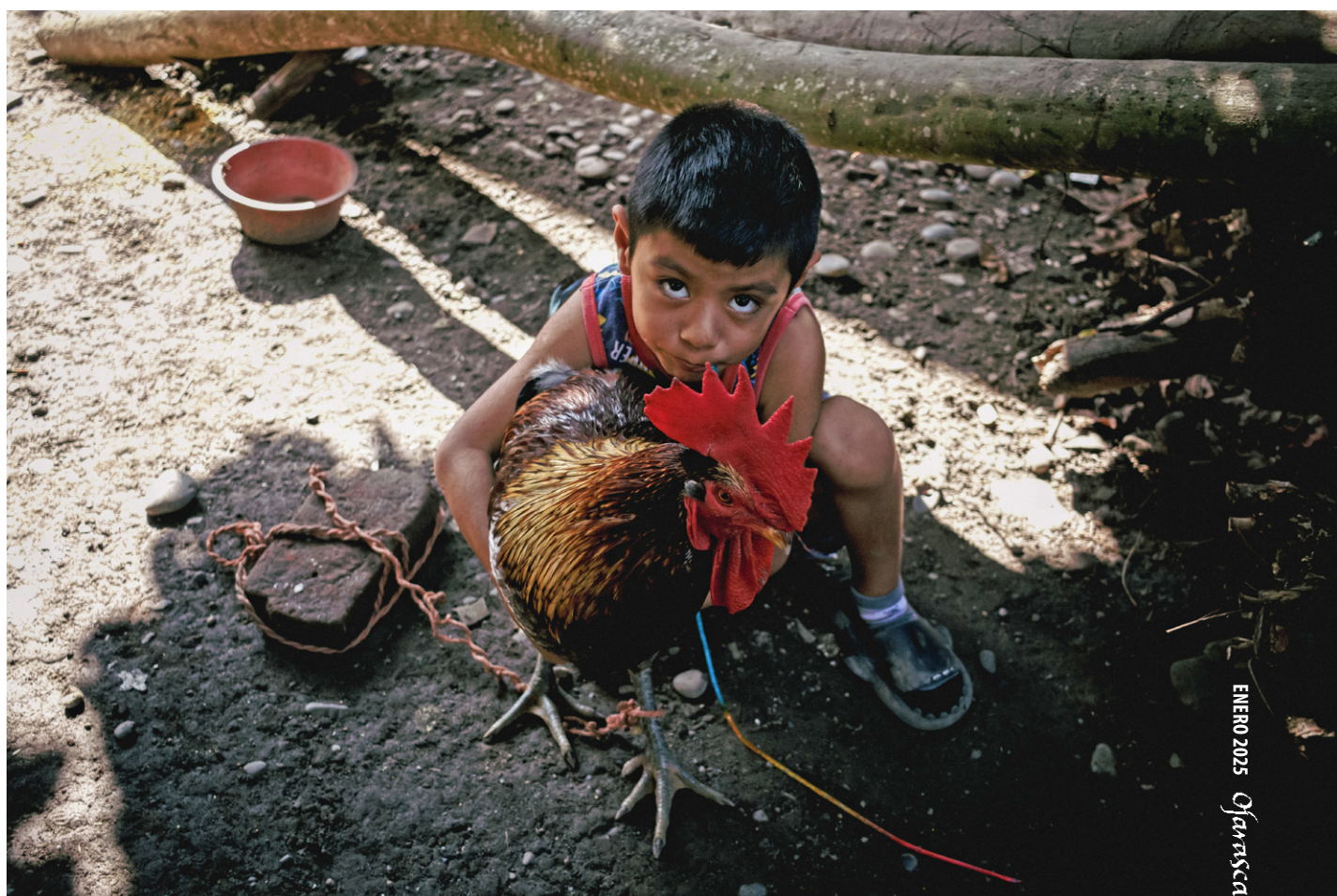
Entabladero, Veracruz, 2024.