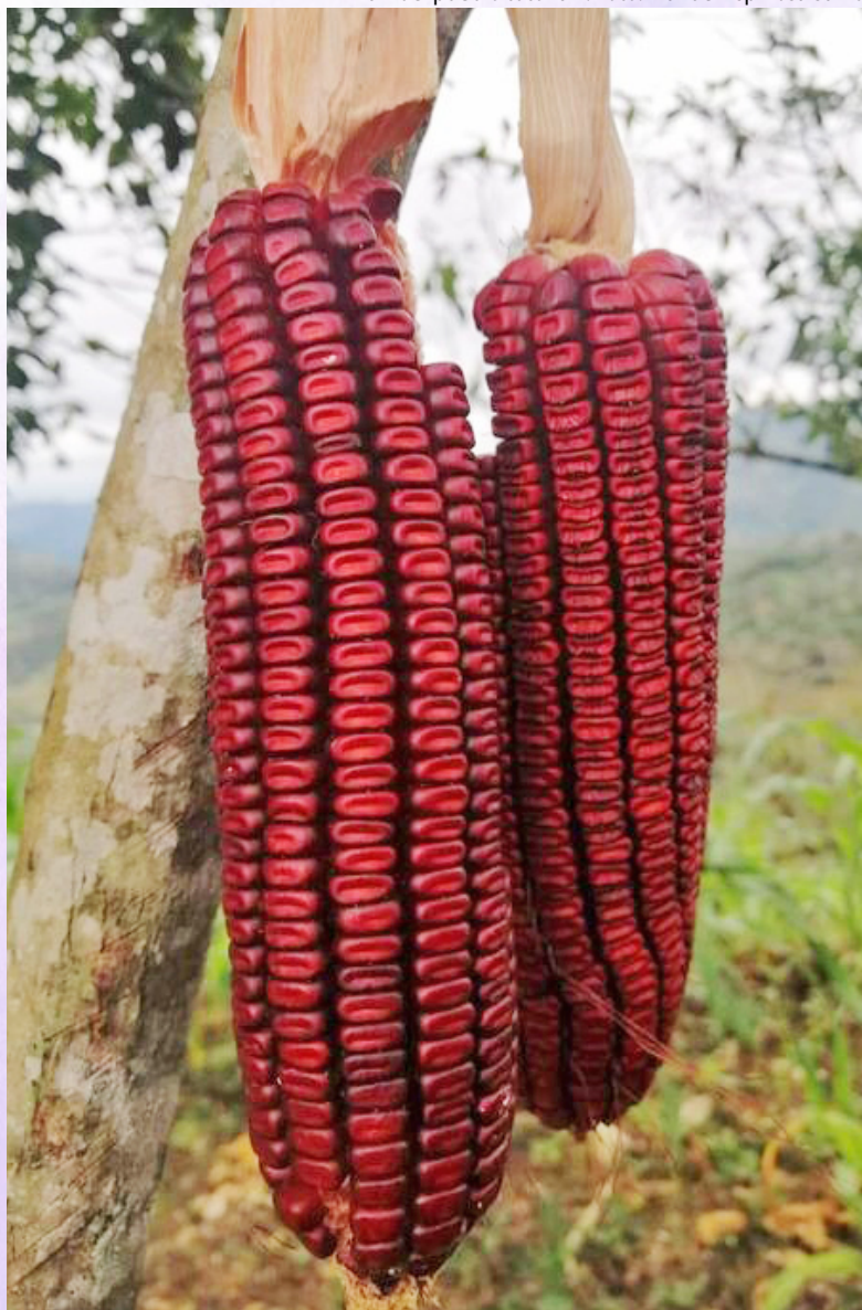
Maíz del pueblo totonaki.

Este texto es un adelanto de un documento más amplio en colaboración con Enlace Comunicación y Capacitación AC.