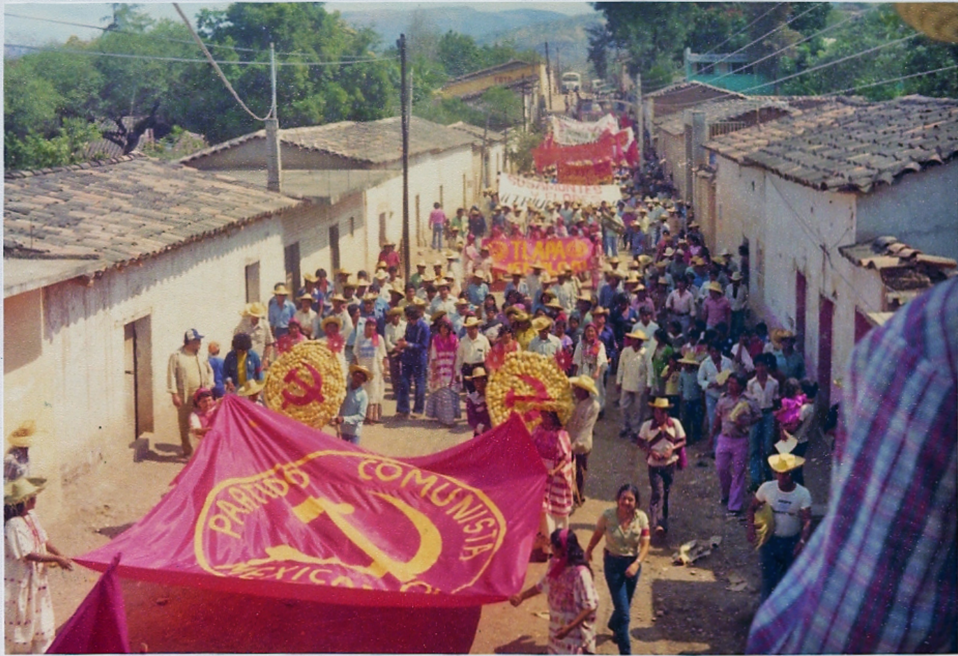
Marcha en Alcozauca, Guerrero, cuando fue llamada La Montaña Roja, 1979. Foto: Alberto Hernández (QEPD)