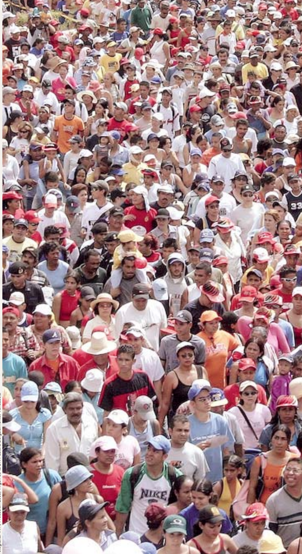
Procesión 2005. Virgen de la DN Pastora Berguismiento, Venezuela

NÚMERO 22 • año 2 • 31 de agosto de 2009