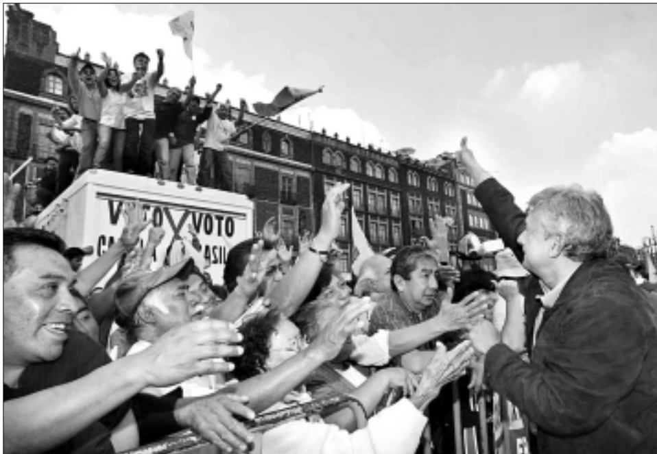
Andrés Manuel López Obrador, candidato de la coalición Por el Bien de Todos, tras pronunciar su discurso en la asamblea informativa en el Zócalo de la ciudad de México. El perredista reafirmó que no aceptarán "el recuento parcial de votos. No queremos un diezmo de democracia, queremos democracia al ciento por ciento" ■ Carlos Ramos Mamahua

■ Traslada hoy la asamblea a la sede del TEPJF