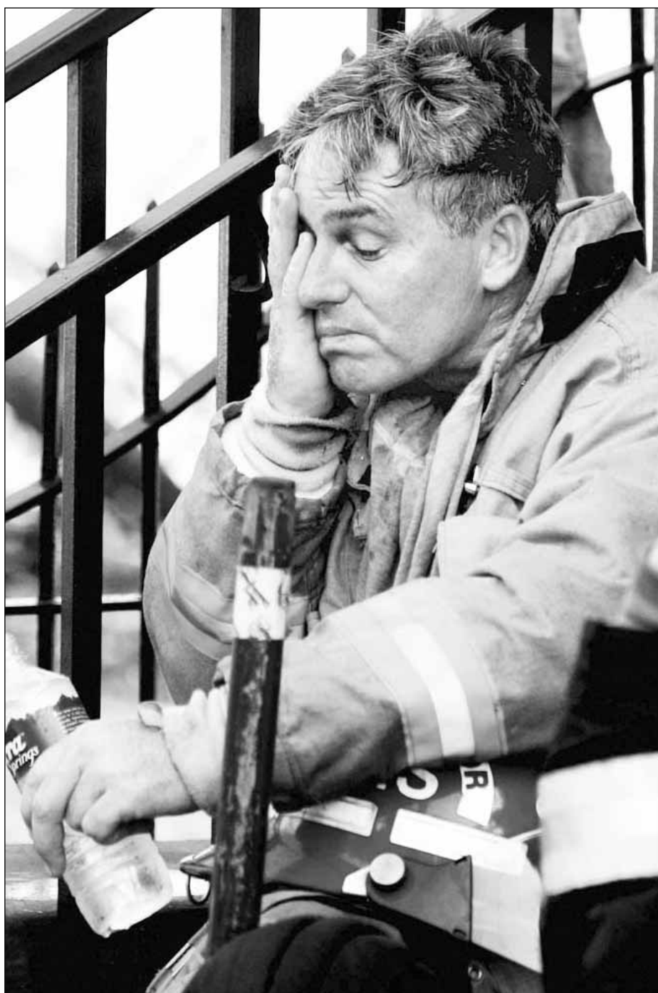
Un bombero toma un descanso después de combatir una serie de incendios en Nueva Orleans por las fugas de gas en inmuebles

■ “¡Váyanse!; hay toxinas por doquier”, dice a damnificados