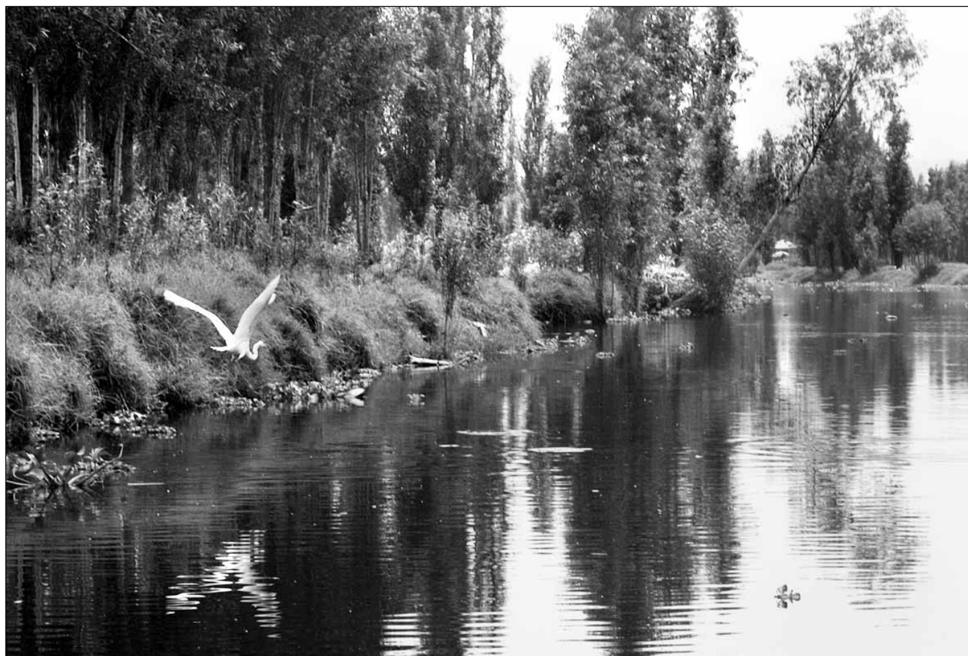
ROBERTO GARCIA ORTIZ

En el primer semestre del programa de recuperación en canales y chinampas de esta demarcación se extrajeron 2 mil 417 toneladas de plantas acuáticas, 530 toneladas de basura y 14 toneladas de carpas y tilapias, especies ajenas al ecosistema. La inversión para estos trabajos conjuntos del Gobierno del Distrito Federal y la UNAM alcanza 2 millones 800 mil pesos